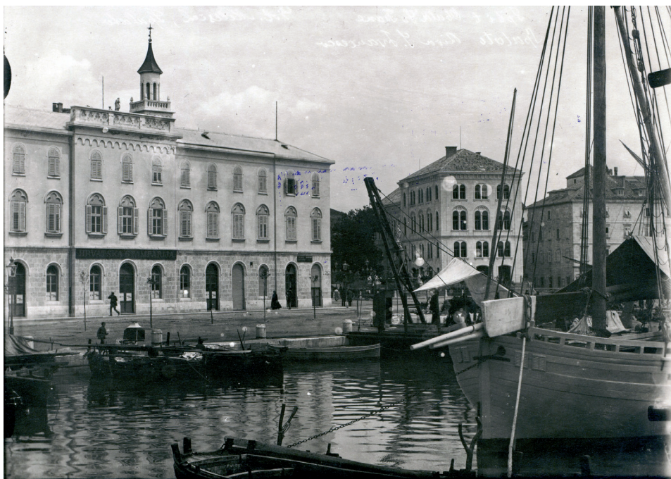
Slika 4. Zgrada Hrvatske štamparije Trumbić i drug (Muzej grada Splita)

vorna radna obaveza. 8 Zadaci koji su stajali pred splitskim općinskim vijećem pod Trumbićevim načelništvom, vidljivi su iz Trumbićeva programatskog govora, održanog 13. veljače 1906. na prvoj radnoj sjednici tog vijeća. U uvodnom dijelu svog govora Trumbić je istakao da je prethodno općinsko vijeće podosta učinilo, ali da je i novom vijeću ostalo „još mnogo posla na svakom polju obćinske radinosti, tim više, što se svaki dan otvaraju nove javne potrebe i pojavljuju novi zahtjevi kao neizbježiva posljedica novih vremena i rastuće važnosti ovoga našega milog grada“. Iako je Split „znamenita točka ne samo u hrvatskoj domovini, nego i na evropskom jugu“, njegov dotadašnji razvitak nije bio srazmjernan „važnosti njegova položaja“. Uz razne druge zapreke najviše je kočilo razvitak Splita to što nije imao željezničkog spoja ni s Bosnom i Hercegovinom, ni s ostalim zemljama Monarhije. Uvjeren da će se ti prometni spojevi uspostaviti u što skorije vrijeme, on je kazao da se za to željeno postignuće treba pripremiti. U svom će se djelovanju općinska uprava „držati strogo zakona i pravice, znajući da se bez toga ne da steći javno povjerenje i pouzdanje“. Ta će uprava – naglašavao je Trumbić – podupirati sve što služi