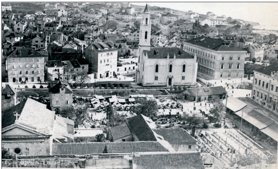
Slika 2. Sv. Petar na Lučcu oko 1910.

splitske odnošaje“ da su u prilici, na primjeru tih izbora, „da nešto nauče“. Taj svoj protest nezadovoljnici su završili riječima: „Ovo su i Splitu zadnji izbori po staroj školi“. 5