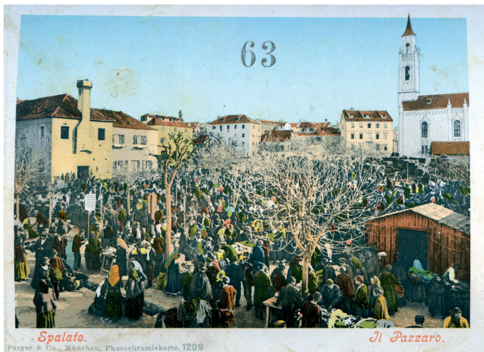
Slika 6. Splitski pazar oko 1908.

Sjednica Općinskoga vijeća održana je početkom svibnja 1913. godine. Na sjednici se raspravljalo o nagodbi s dioničkim društvom Split za cement Portland, tj. za vodopravnu koncesiju na rijeci Jadro, o općinskom doprinosu za daljnje mjerenje okoliša te upotpunjenje nove mape nivelacijom, o smještanju nove škole u Splitu u zgradu zavoda Martinis-Marchi, o nastavku započetog novog puta od Solinske ceste put Gripa, te o gradnji pučkih stanova na općinskom zemljištu uz Solinsku cestu. 59