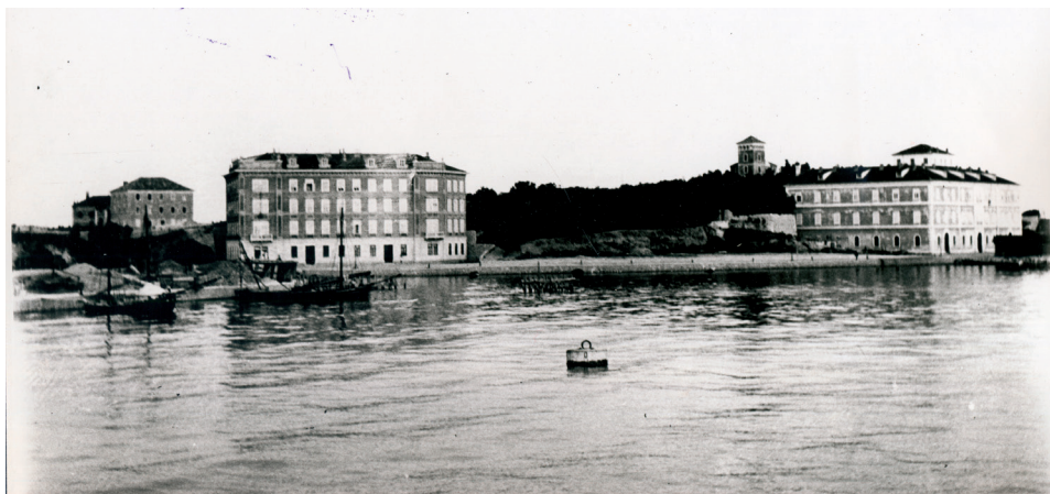
Slika 9. Kuće Katalinić na splitskim Bačvicama