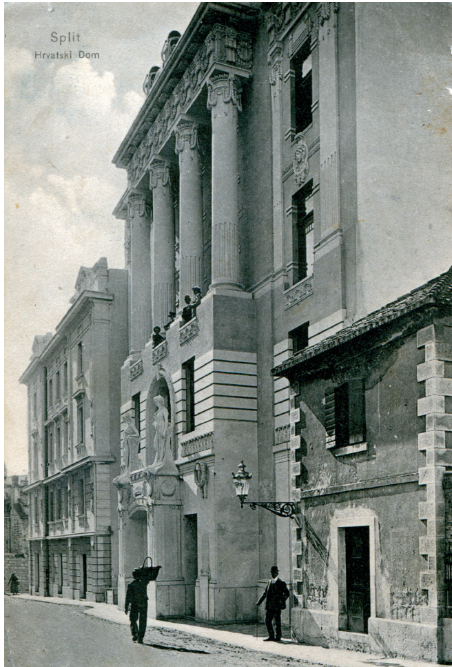
Slika 2. Zgrada Hrvatskog doma oko 1908.