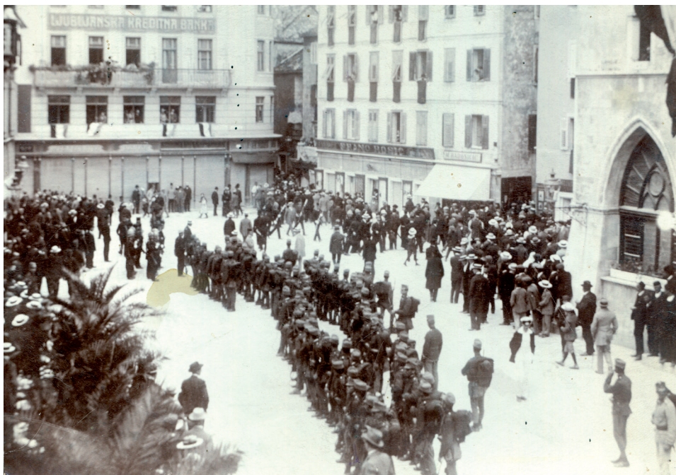
Slika 8. Prosvjedi i neredi na proslavi sv. Duje 7. svibnja 1914.

nio je i igranje tombole na rivi. Narodni trg i centar grada bili su puni vojske i žandara. Uhićeno je 13 osoba no uskoro su svi pušteni na slobodu. 75 Nakon što su oslobođeni, primio ih je načelnik V. Katalinić. 76 Na poticaj splitskih privednika, koji su pretrpjeli gubitke u iznosu 150.000 – 200.000 kruna zbog zabrane rada na blagdan sv. Duje, općinska deputacija na čelu s V. Katalinićem pošla je u Zadar požaliti se namjesniku Attemsenu na ponašanje kotarskog poglavara de Szilvasa. 77