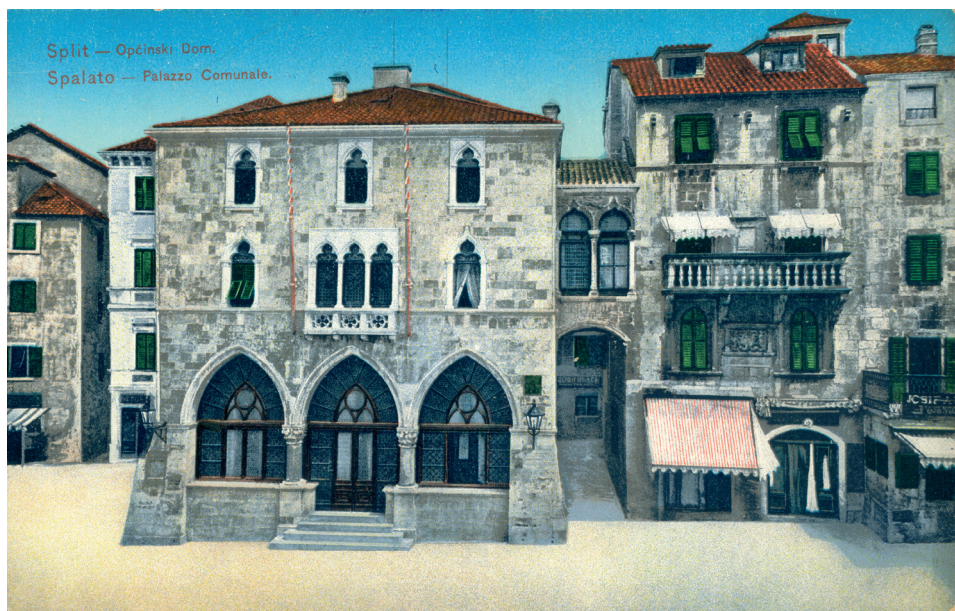
Slika 3. Zgrada Općinskog doma oko 1910.