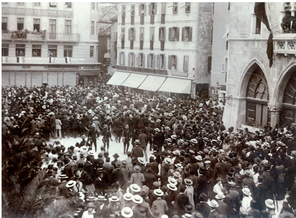
Slika 7. Prosvjedi i neredi na proslavi sv. Duje 7. svibnja 1914.

Zbog teških financijskih prilika, splitska je Općinska uprava povisila tarifu za plin, povišena je cijena najma gradskih prostora za kavane, a povišena je i tarifa za vodu svim građanima. 74