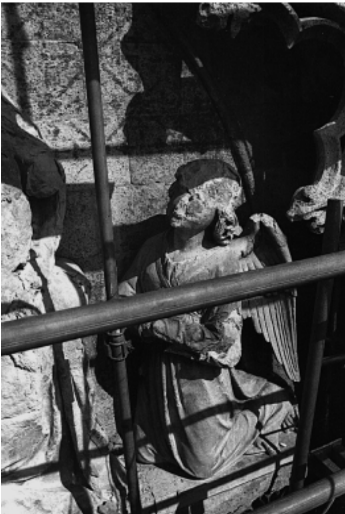
6. Detalji skulptura prije obnove 6. Details of the sculptures before their restoration