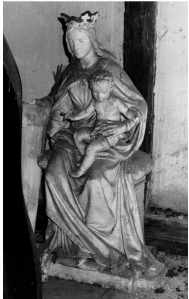
8. Beyerov model Bogorodice u zagrebačkoj Gliptoteci HAZU 8. Beyer's model of the Madonna in the Glyptothek of the Croatian Academy of Sciences and Arts, Zagreb

lina i mana, a one su obično kombinirane. I valja uzeti u obzir da je riječ povjesničara unjtnosti ponekad nemoćna, pa i neuvjerljiva pred argumentima tehnologa – pogotovu kad se, nažalost, ispriječe i financijski pokazatelji. Drugi razlog pada kvalitete od skice do realizacije skulpture bio je pretjerana strojna obrada. Premda je, u situaciji u kakvoj se zagrebačka katedrala nalazi, zasad teško uspostaviti odgovarajući manufakturni standard, bilo je moguće, ali je nažalost propušteno, osigurati veći završni udio kipara na skulpturi. No kako je obrada katedrale stalno učenje, tako će i sljedeći zahvati svakako voditi brigu o navedenom iskustvu. To bi se, uostalom, moralo odnositi ne samo na skulpture nego i na završnu obradu novih dijelova zidnog platna – kako bi se izbjegao dojam hladnoće i mrtvila što ga, recimo, pruža novi zabat.