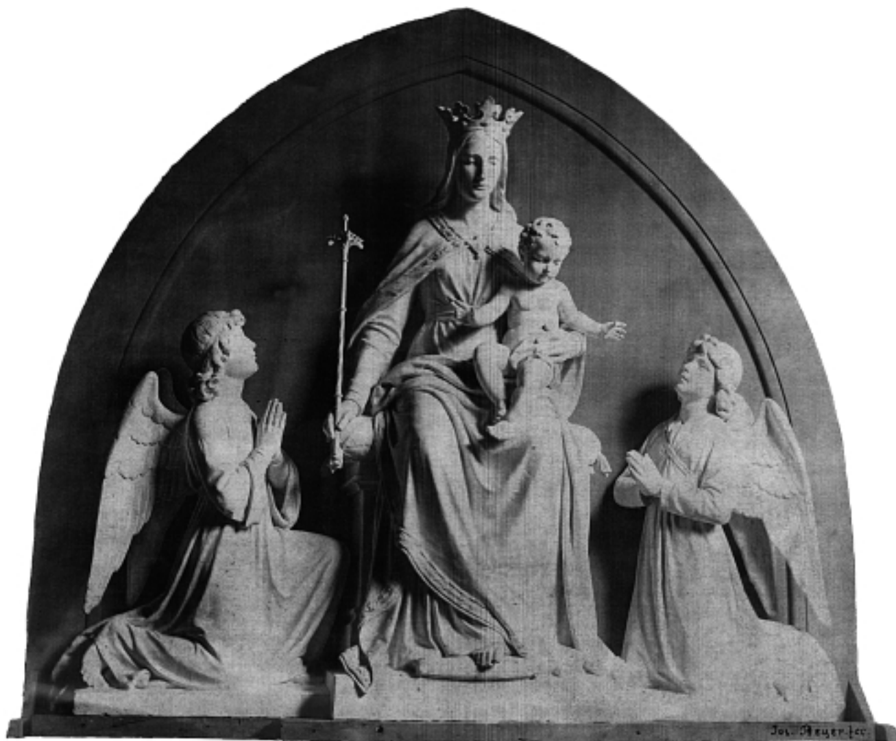
1. Josef Beyer: Bogorodica s Djetetom i anđelima, stara fotografija modela skulpture na timpanonu zapadnog pročelja zagrebačke katedrale, 1890. Riznica zagrebačke katedrale

1. Josef Beyer: Madonna and Child with Angels, old photograph of a model of the sculpture on the tympanon of the western front of Zagreb Cathedral, 1890. Treasury of Zagreb Cathedral