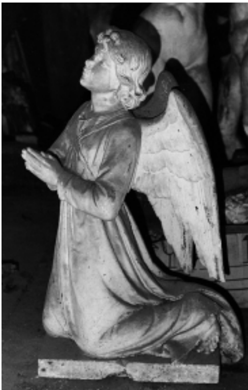
9. Beyerov model anđela u zagrebačkoj Gliptoteci HAZU 9. Beyer's model of an angel in the Glyptothèque of the Croatian Academy of Sciences and Arts, Zagreb