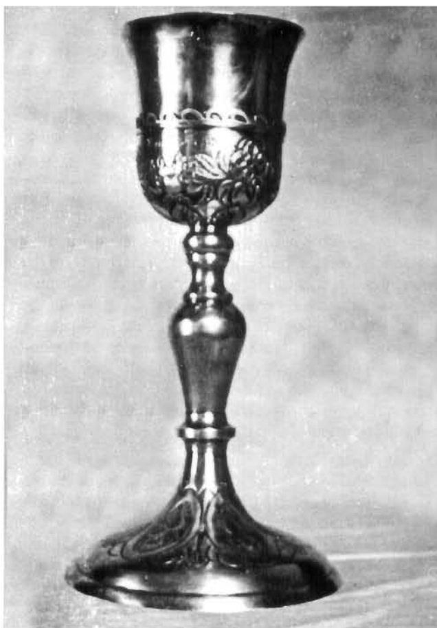
Kalež – župna crkva u Orebiću Chalice. Parish church, Orebić