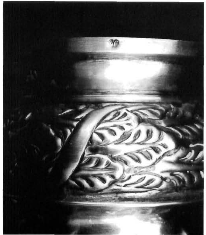
Detalj viseće svjetiljke Hanging Lamp (detail)

Hanging Lamp from the parish church of Saint Blaise in Ston