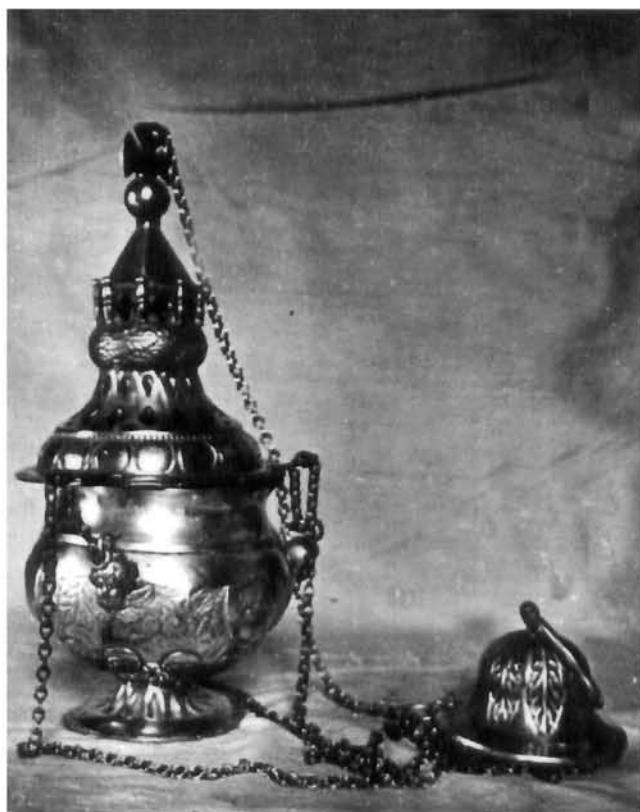
Kadionica – župna crkva u Orebiću Incense Burner. Parish church, Orebić

U crkvenoj riznici čuva se i drugi, nešto skromniji kalež (sl. 1) providen majstorovim žigom na bazi, klasicističkog oblika s dodacima neobaroka, izrađen od lijevanog, iskucanog i djelomično pozlaćenog srebra: visok je 24,5 cm, širina baze