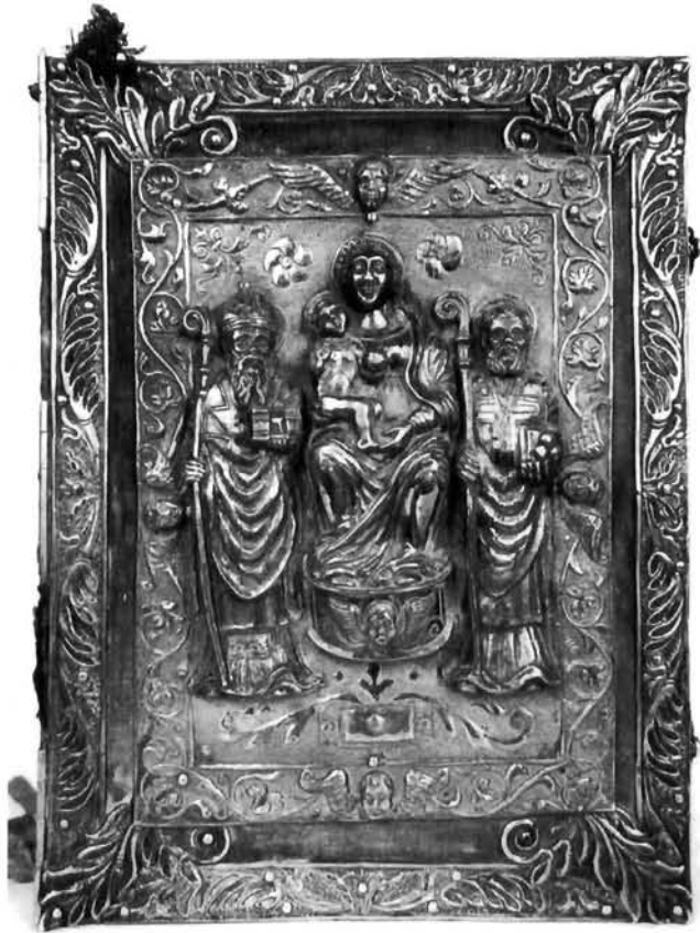
Korice katedralnog misala (rub) iz župne crkve Sv. Vlaho u Stonu (foto: B. Gjukić)

Covers of Cathedral Missal (the borders) from the church of Saint Blaise in Ston (photo B. Gjukić)