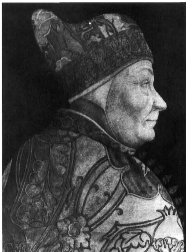
Lazzaro Bastiani, Dužd Francesco Foscari. Museo Correr, Venecija Lazzaro Bastiani, Doge Francesco Foscari. Museo Correr, Venice

Četvrta glava jajolikog oblika prikazuje muškarca mlađih godina, nategnute kože lica, oblih obrva ispod kojih se kriju pronicljive oči, pogleda usmjerenog prema prethodnoj. Glavu mu pokriva kapuljača koja seže do čela.