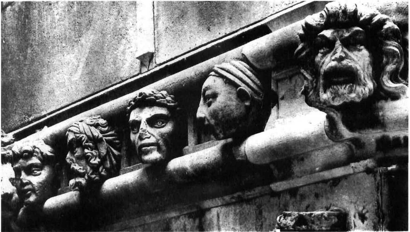
Juraj Dalmatinac, Detalj glava na početku druge apside. Šibenik, katedrala Juraj Dalmatinac, detail of the heads, first part of the second apse, Šibenik cathedral

Giacoma Pasinija, spomenutog kipara koji je u XIX. st. radio na izmjeni i restauraciji Jurjevih glava. Za glavu žene izrazito pravilna ovalna lica – šesnaestu na drugoj apside – mislilo se da prikazuje Danteovu Beatrice. U četvrtoljavi na trećoj apside, za koju se pretpostavljalo da je portret Maksimilijana, brata cara Franje Josipa I, prepoznaje Škarica lik orguljaša Tedeschinija, a u tridesetoljavi fizionomiju suca Jakova Nikolinića. 25