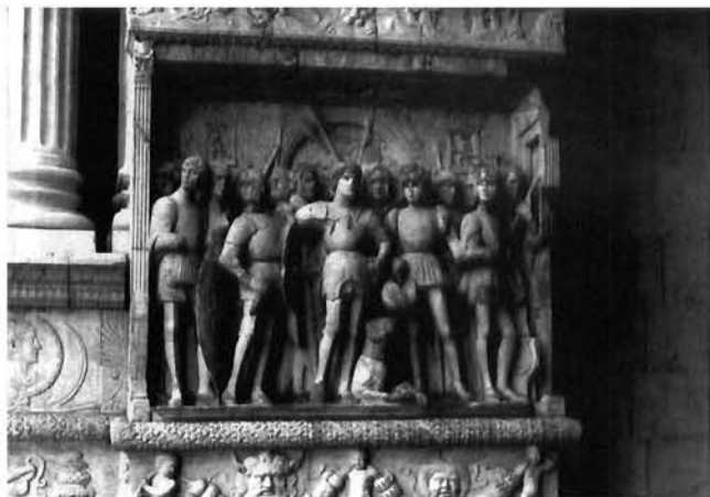
Alfonso Aragonški s pratnjom, slavoluk u Castelu Nuovo, Napulj Alfonso Aragonski with his suite, triumphal arch in Castel Nuovo, Neaples