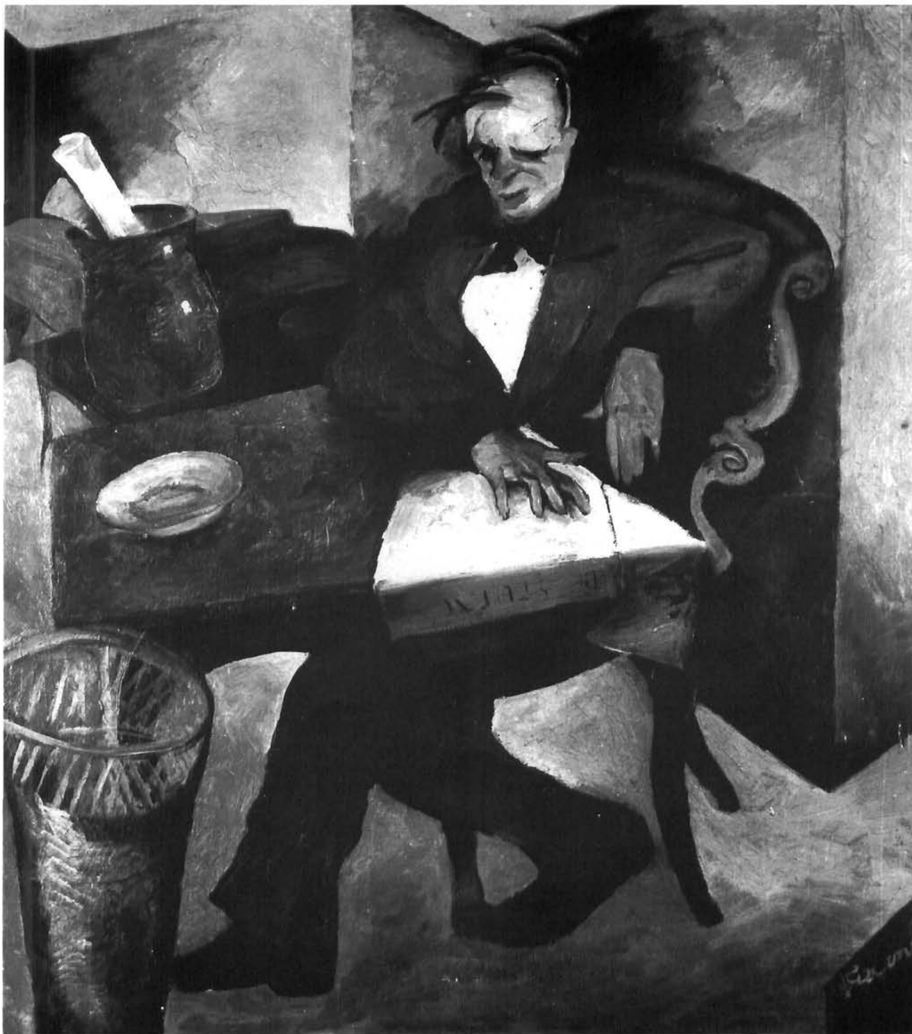
Vilko Gecan: Cinik, ulje, 1921. Moderna galerija, Zagreb Vilko Gecan, The Cynic, oil on canvas, 1921. Modern Gallery Zagreb