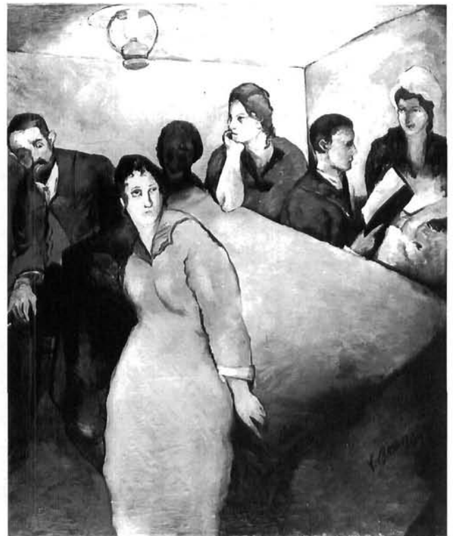
Vilko Gecan: Kod stola, ulje, 1919. Moderna galerija, Zagreb Vilko Gecan, At Table, oil on canvas, 1919. Modern Gallery, Zagreb

Ali, usamljeni muški lik za stolom, kao što će to slikar prikazati na Ciniku , ima nekoliko važnih starijih srodnika. Tako u crtežu Bijesni , koji je nastao samo dvije godine prije (1919), nalazimo isti ikonografski motiv: sjedećeg muškarca za stolom. Na čelavoj glavi tek su šturo označene oči i nos, a ono što individualizira lik jesu geste. Točnije rečeno, lijeva ruka izbačenog palca o koju je lik nalakćen. Druga je pak ruka prebačena preko naslona stolice i blago valovita obrisna linija izdvaja je iz veoma izražajnih šrafura. Dakako da je ravna i svijetla ploha stola, na kojemu je u sredini postavljena tek jedna čaša, neka vrsta »prologa«, uvodna sekvenca koja će nas približiti kompozicijskom središtu, sjedećoj