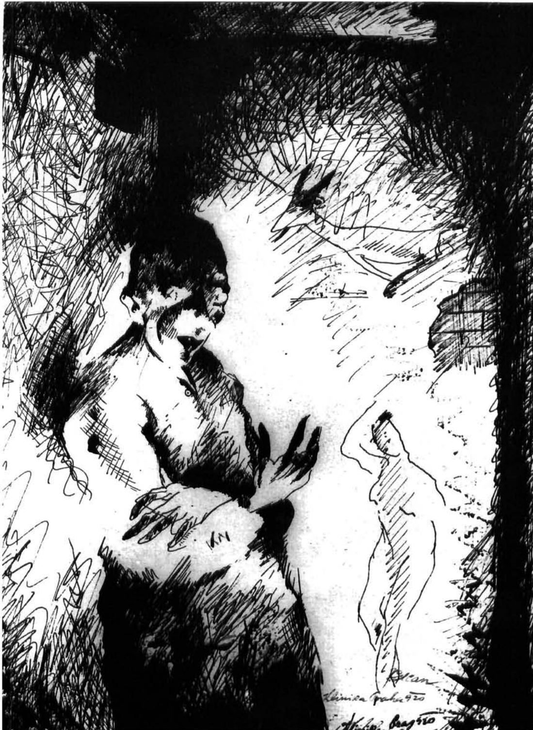
Vilko Gecan: Ludak, crtež tušem, 1920. Moderna galerija, Rijeka Vilko Gecan, Madman, Indian ink drawing, 1920. Modern Gallery Rijeka