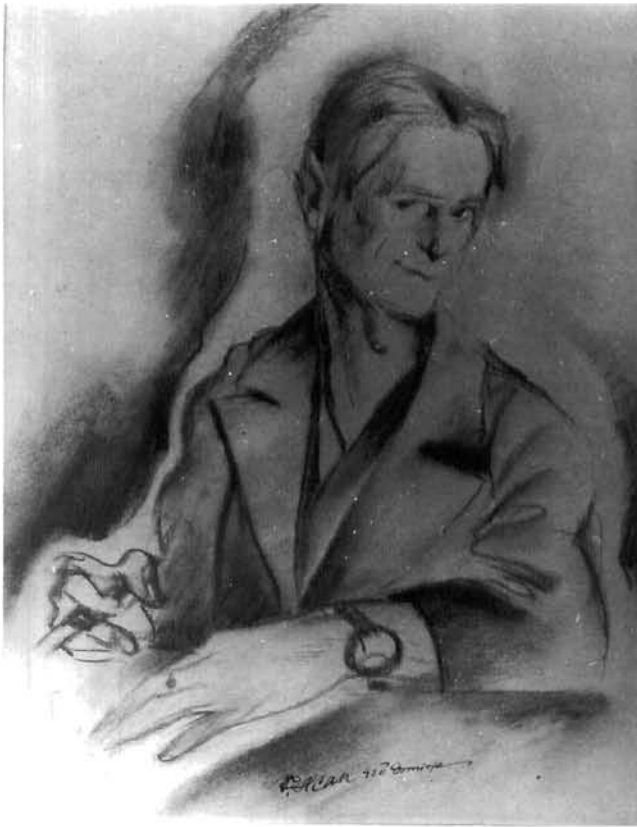
Vilko Gecan: Studija cinika, kreda, 1920. Nacionalna i sveučilišna biblioteka, Zagreb

Vilko Gecan, Study for the Cynic , chalk, 1920. National and University Library Zagreb