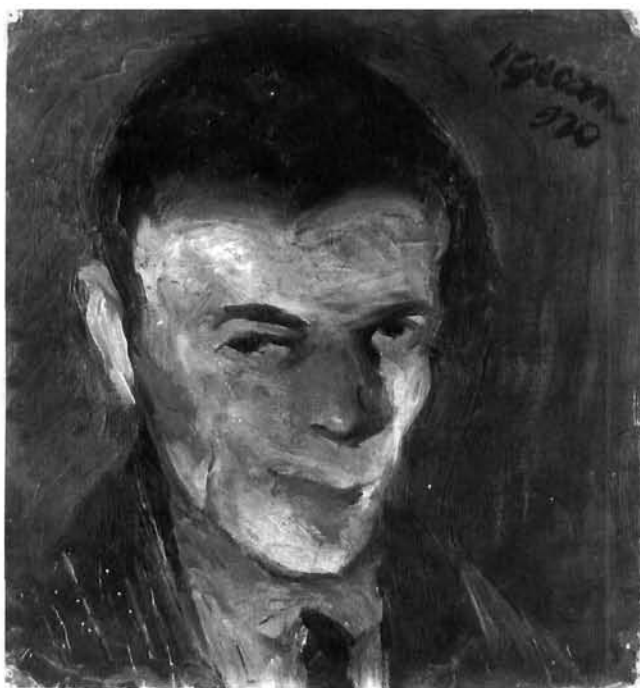
Vilko Gecan: Autoportret, ulje, 1920. Muzej suvremene umjetnosti, Zagreb

Vilko Gecan, Self-Portrait, oil on canvas, 1920. Museum of Contemporary Art, Zagreb