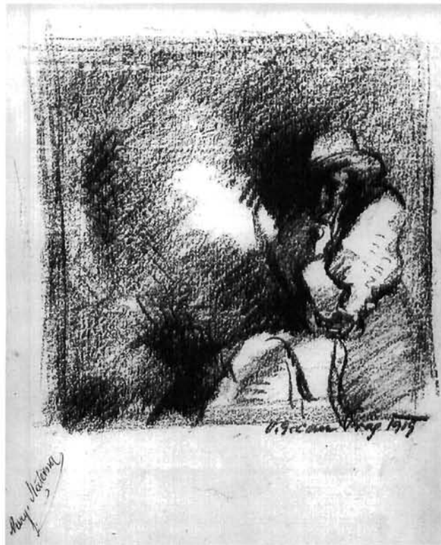
Vilko Gecan: Sjedeća figura , krejon, 1919. Privatno vlasništvo, Zagreb Vilko Gecan, Seated Figure , crayons, 1919, private collection, Zagreb

Vilko Gecan, The Angry One , Indian ink drawing, 1919. National and University Library Zagreb