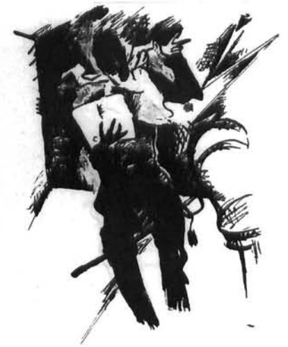
Vilko Gecan: Ropstvo u Siciliji, mapa litografija, 1921. Vilko Gecan, Imprisonment in Sicily, portfolio of litographs, 1921