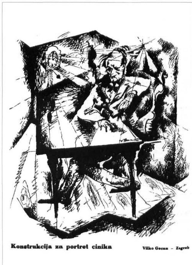
Konstrukcija za portret cinika