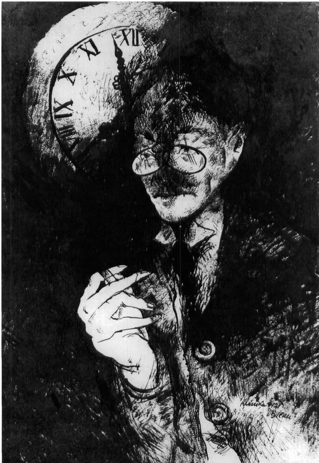
Vilko Gecan: Doktor Löwi, crtež tušem, 1921. Muzej savremene umetnosti, Beograd Vilko Gecan, Dr. Löwi, Indian ink drawing, 1921. Museum of Contemporary Art Belgrade