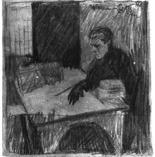
Vilko Gecan: Za stolom, crtež olovkom, 1916. Privatno vlasništvo, Zagreb Vilko Gecan, At Table, pencil drawing, 1916, private collection, Zagreb

Između toga posve ranoga Gecanova crteža i kasnije slike iz 1921. godine moguće je naći možda najranijeg i pritom najizravnijeg Cinikova dvojnika. Jedan crtež olovkom nastao 1916. godine za slikareva ratnog zarobljenštva u Cataniji prikazuje mušku figuru kako sjedi za prostranim stolom u jednom kubičnom prostoru izrazito skošena tla. Nagnuta glava usmjerena je prema ispruženoj crnoj pesnici, tako da se jedno s drugim veže.