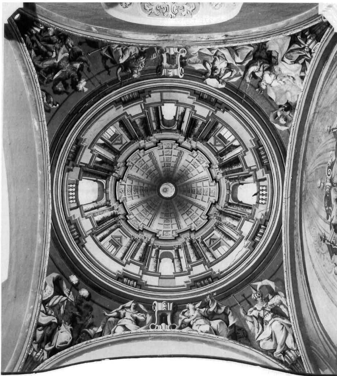
Alegorije četiriju kontinenata i isusovačkih zavjeta ilustriraju djelovanje Sv. Franje Ksaverskoga na svodu dvorske kapele u Gornjoj Stubici

Allegory of the four continents and the Jesuit ows illustrating the deeds of St. Francis Xavier; vault of the royal chapel in Gornja Stubica