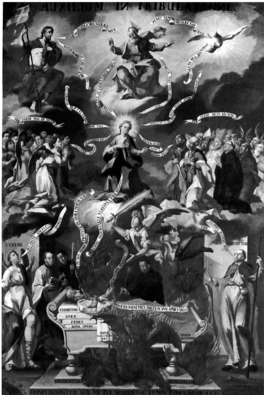
»Auxilium in tribulatione« – Marija pomoćnica i posrednica iz župne crkve u Kutini

»Auxilium in tribulatione« – Mary as helper and mediator in the Kutina church