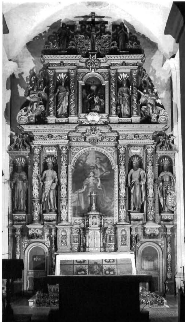
Apostolski prvaci Sv. Petar i Pavao i »apostoli Panonije« Sv. Stjepan i Ladislav na oltaru Sv. Katarine u franjevačkoj crkvi u Krapini

Series of miracles performed by St. Anthony of Pauda; Franciscan church in Varaždin