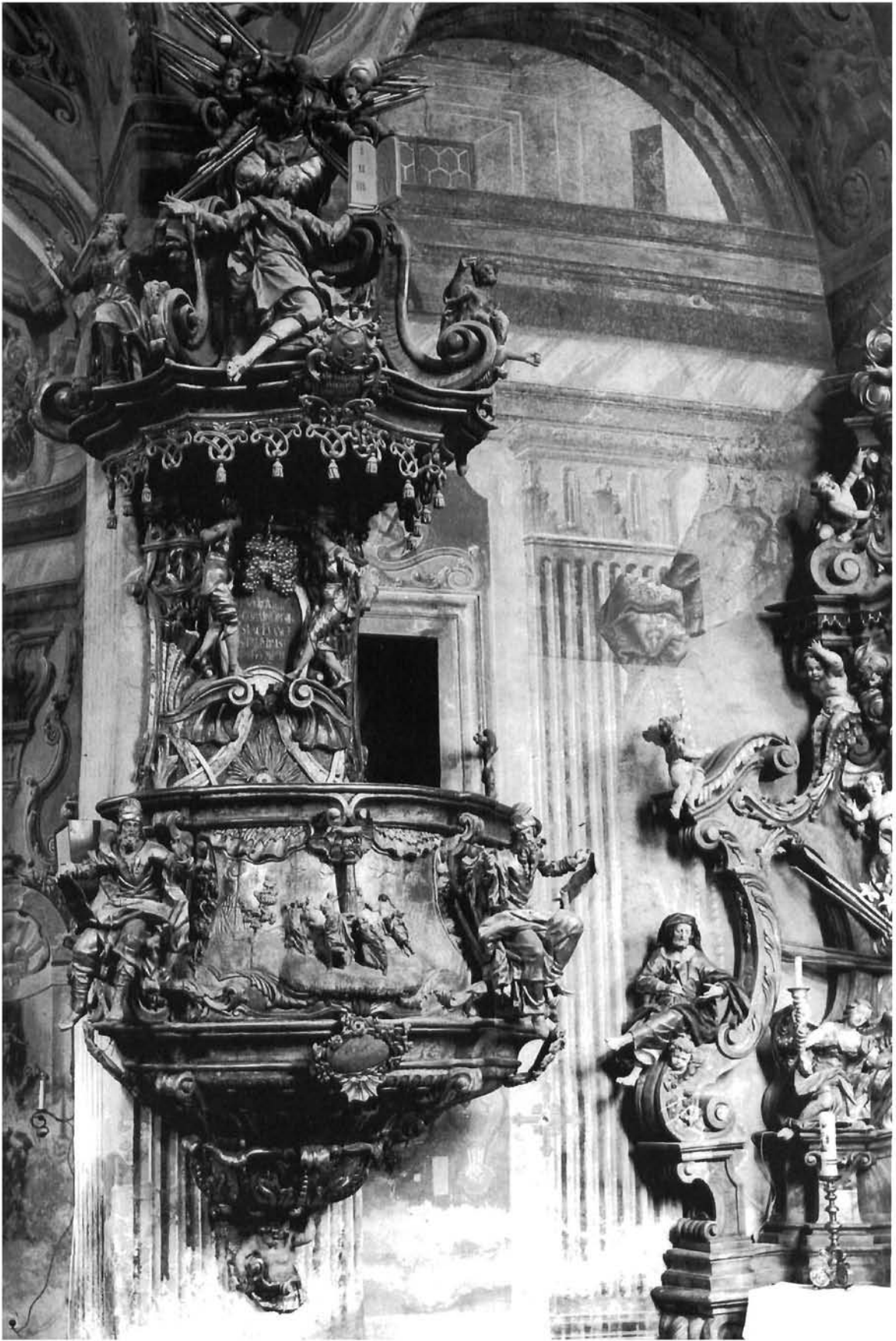
Starozavjetni motivi osnovica su ikonološkoga programa propovjedaonice u crkvi Marije Snježne u Belcu Old Testament motifs underlying the iconographic programme on the pulpit of the church of Our Lady of the Snow in Belec