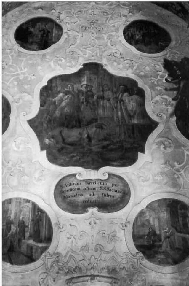
Cjelovit ciklus čudesa Sv. Antuna Padovanskoga iz franjevačke crkve u Varaždinu

Series of miracles performed by St. Anthony of Pauda; Franciscan church in Varaždin