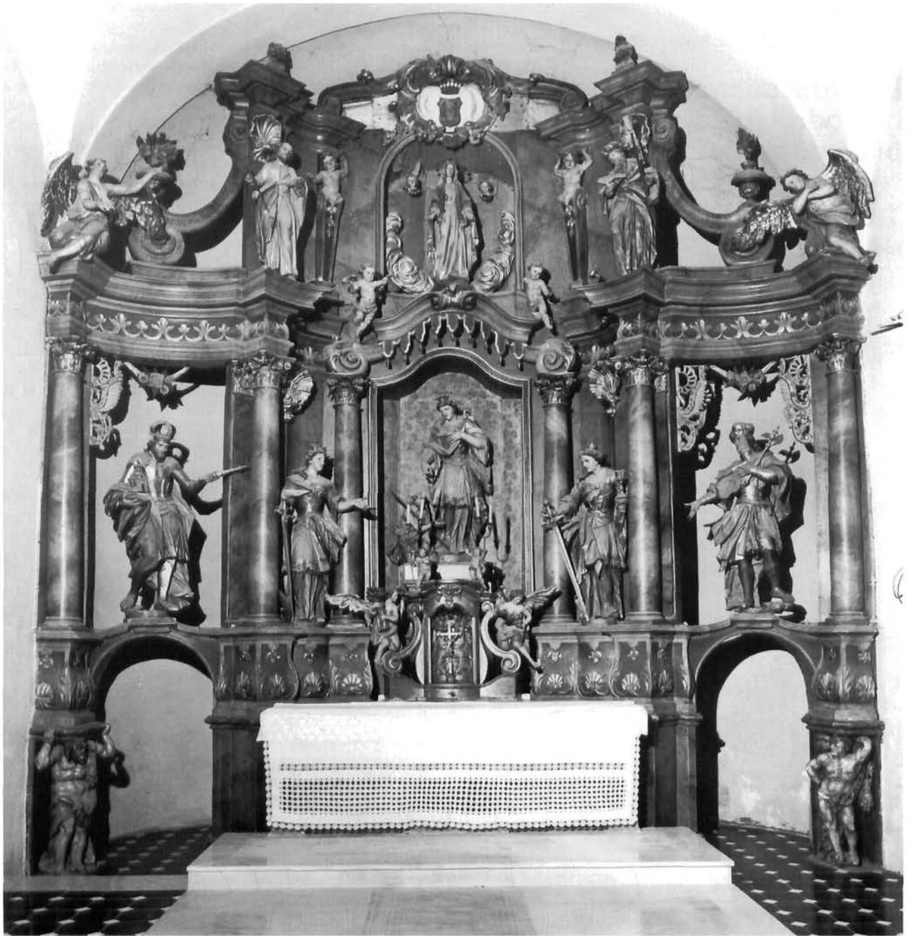
Oltar Sv. Elizabete Ugarske s likovima svetih ugarskih kraljeva Stjepanom i Ladislavom iz župne crkve u Jalžabetu Altar of St. Elisabeth of Hungary with the figures of the saintly Hungarian kings Stephen and Ladislaus from the parish church in Jalžabet

odnosima sa susjednim područjima). Evo o čemu je riječ: Na pojedinim geografskim, etničkim ili na neki drugi način zaokruženim komunikacijskim područjima, pa i na područjima biskupija kao što je Zagrebačka, oblikovale su se za vlastite potrebe lokalno obojene ikonografije. One su stvarane na temelju životopisa svetaca uz koje su ta područja bila povijesno ili teritorijalno vezana. U takvu su strukturu zatim utkivani sveti zaštitnici onih djelatnosti kojima se bavilo stanovništvo i sveci zagovornici u