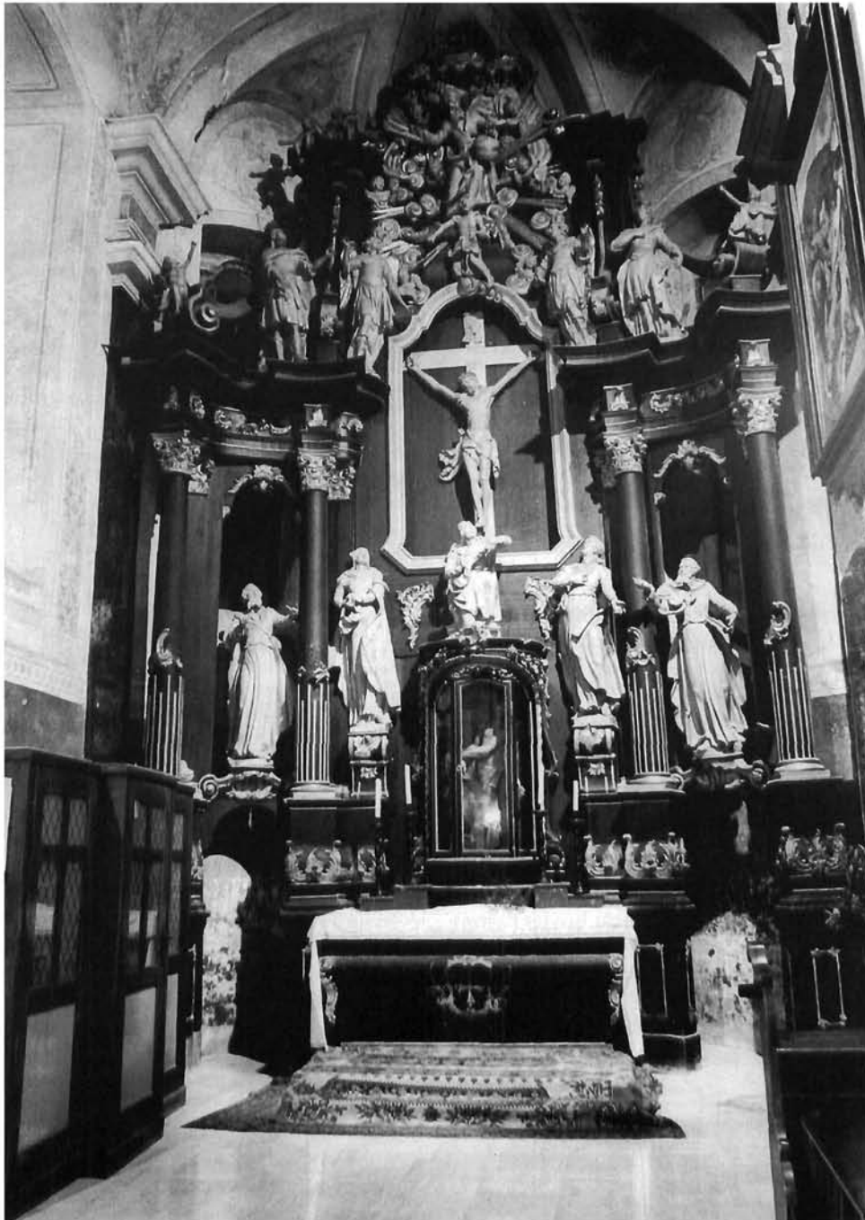
Oltar Sv. Križa iz franjevačke crkve u Našicama. To je najčešći motiv vezan uz Kristov život.

Altar of the Holy Cross from the Franciscan church in Našice. This is the commonest motif from the life of Christ.