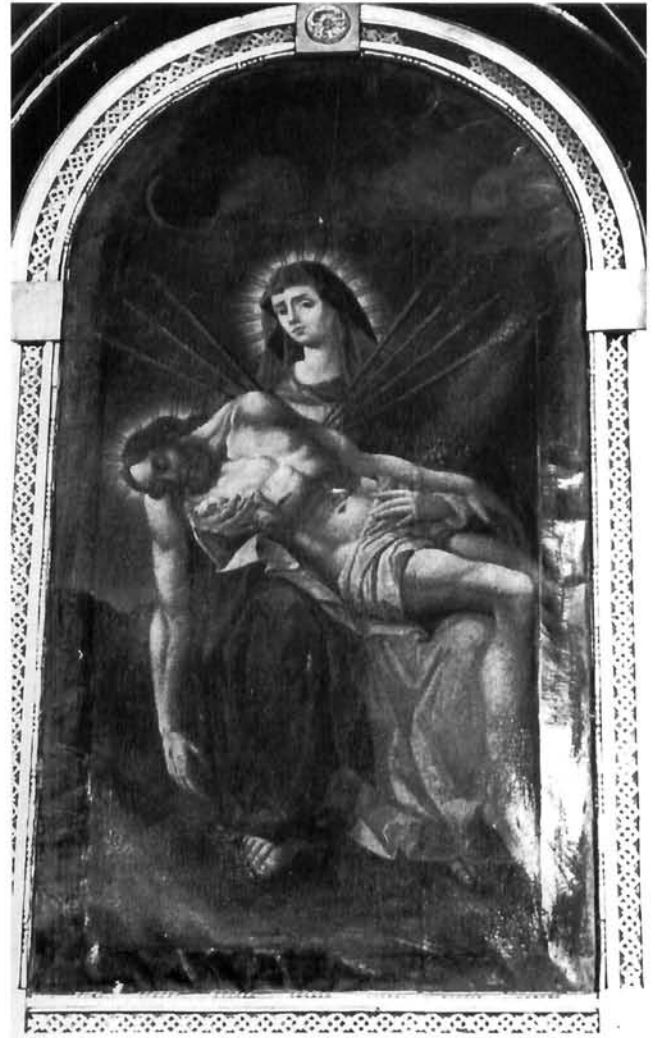
Vjerna kopija zagrebačke Majke Božje Žalosne u crkvi Sv. Klare u Sv. Klari

Prema baroknom poimanju sakralnoga prostora, umjetnina djeluje na promatrača zajedno s glazbom, pjesmom i riječju. Sve