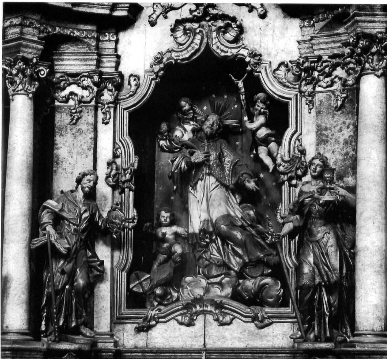
Oltar Sv. Ivana Nepomuka, omiljenog zaštitnika od poplava, iz crkve Sv. Roka u Virovitici

Altar of St. John Nepomucenus, a popular protector against floods, from St. Rao's church in Virovitica