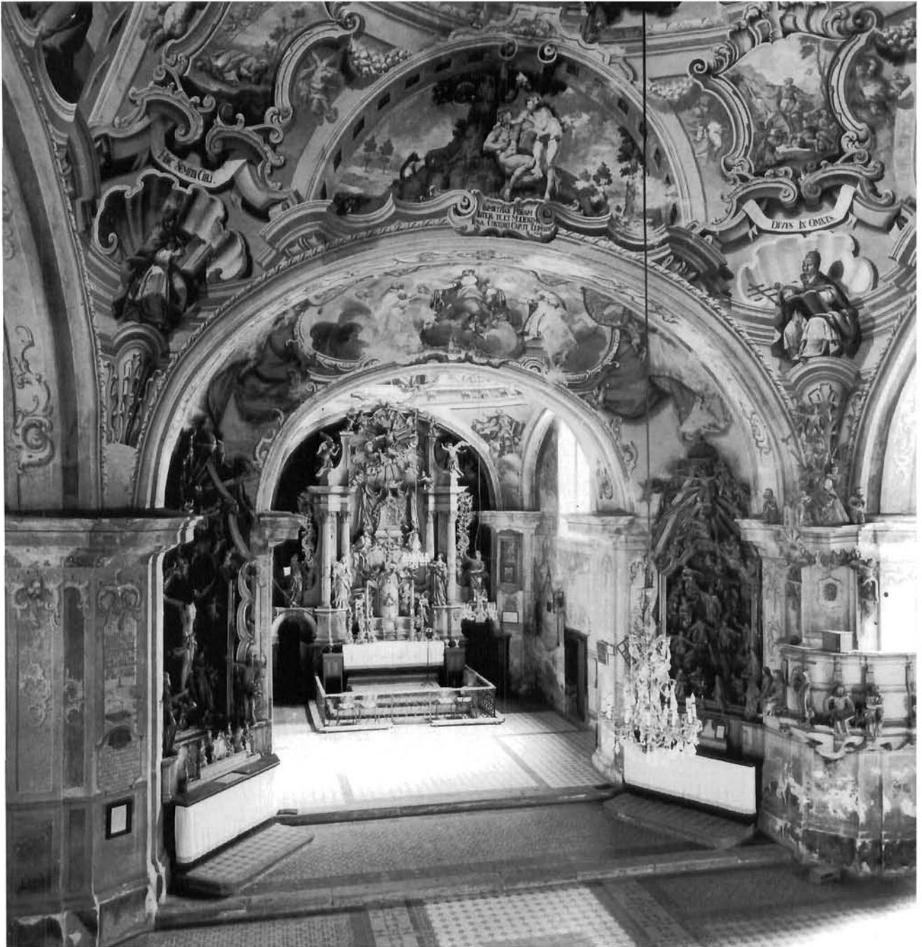
Jedinstveno opremljena i ikonografski uskladena unutrašnjost proštenjarske crkve Majke Božje Jeruzalemske na Trškom Vrhu kraj Krapine

The unique iconographic and decorative ensemble in the interior of the pilgrimage church of Our Lady of Jerusalem on Trški Vrh near Krapina