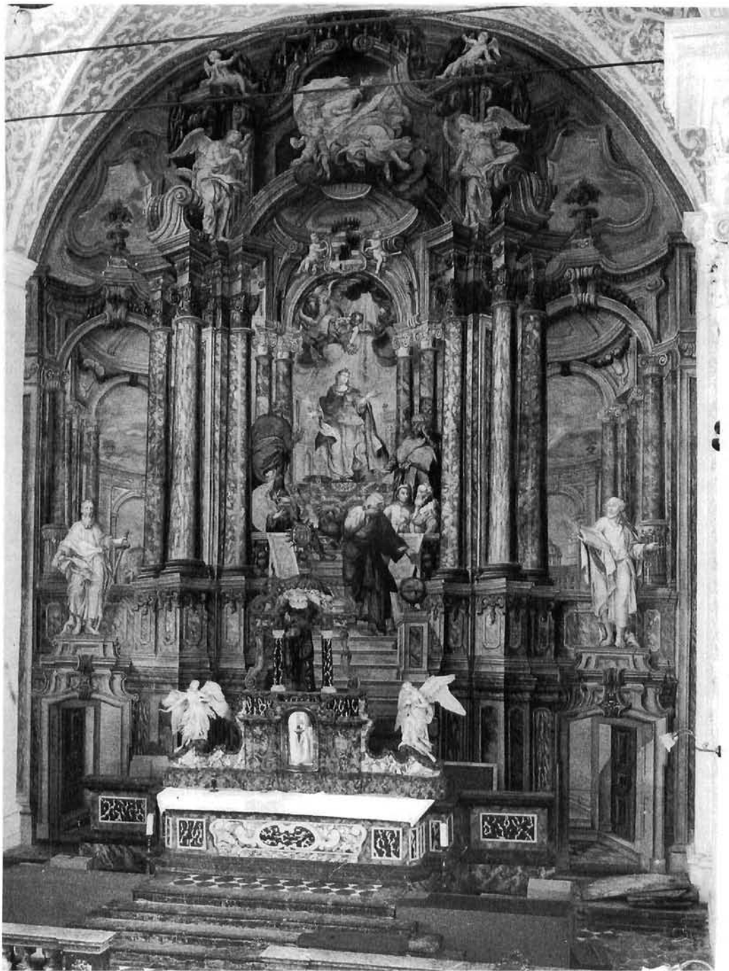
Vjerna kopija Loretske Gospe zagrebačkih isusovaca pred slikanim retablom glavnoga oltara u crkvi Sv. Katarine u Zagrebu A faithful copy of Our Lady of Loreto owned by the Zagreb Jesuits placed in front of the painted retablo on the main altar in St. Catharine's church in Zagreb

nika, te Franjo Ksaverski koji je liječio kužne bolesnike, oživljavao umrle i činio čudesna ozdravljenja. Budući da je Franjo Ksaverski jedan od najčuvenijih misionara, često je udružen s drugim misionarima i propovjednicima, kao apostol Indije bio je pogodan kao dopunski lik apostolskih oltara, kao što su i apostoli bili rado korišteni kao dopune njegovih oltara. Zbog njegovih vizija (i raspela koje mu je dao Sv. Ignacije na put u Indiju) uklapao se i u kristološku motiviku. Sv. Franjo Ksaverski tu služi kao primjer kako je jedan svetac bogate ikonografije bio povezan