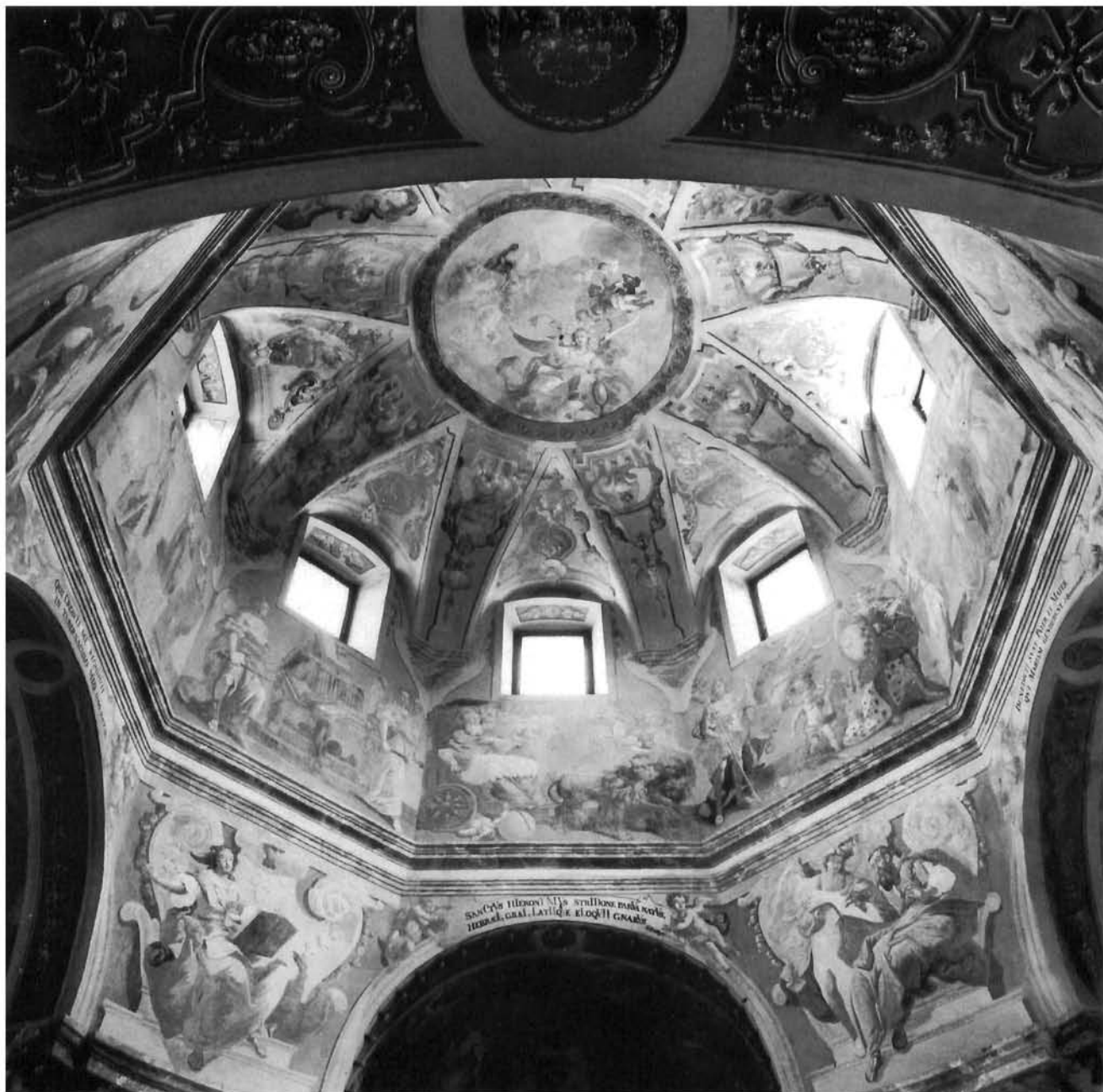
Spoj marijanske i svetačke ikonografije osnovica je uspjelog baroknog programa u pavlinskoj crkvi Sv. Jeronima u Štrigovi A combination of scenes from the life of Mary and various saints inspiring the fine Baroque programme of the Paulite church of St. Jerome in Štrigova.

pije. Moglo se vidjeti da je ona u potpunosti uklopljena u opću ikonografiju Rimokatoličke crkve, a umjetnički i kulturno djelatni redovi (franjevci, pavlini i isusovci) dodali su, sukladno svojim potrebama, svoje specifično izvedene ikonografije. Te su sastavnice podjednake u svim rimokatoličkim zemljama, tek nisu posvuda zastupljeni isti redovi. No, kao što su sve tri vodeće redovničke zajednice potekle iz srednje Europe ili još bile povezane s njom (franjevci Provincije Sv. Ladislava odvojili su se od Ugarske provincije Sv. Marije polovicom XVII. stoljeća, pavlini, nastali u Ugarskoj, odvojili su se od Ugarske provincije tek