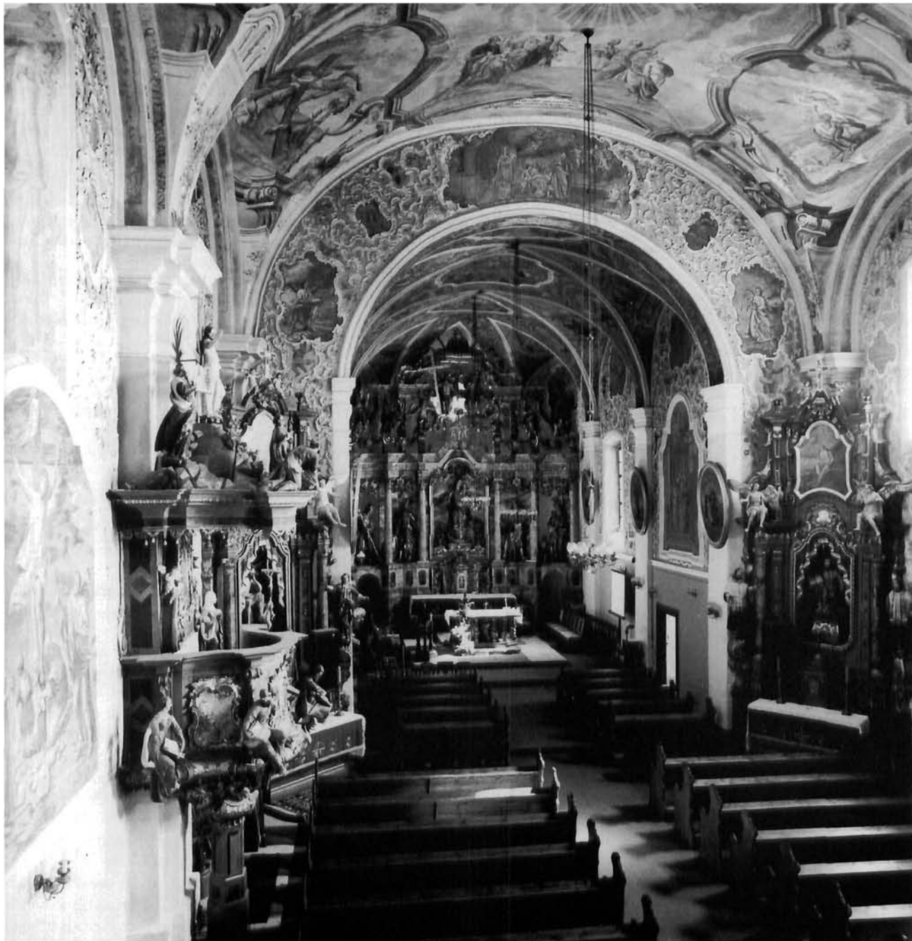
Oslikana unutrašnjost crkve Marije Snježne u Kutini – spoj mariološkoga i kristološkoga programa Painted interior of Our Lady of the Snow in Kutina – a combination of the Mariological and Christological programme

Ponegdje se Marijin lik našao na glavnome oltaru i u crkvama drugih titulara. To se zbilo npr. u pavlinskoj crkvi Sv. Ane u Križevcima, pa u njihovoj crkvi Sv. Jeronima u Štrigovi, gdje je njezin lik osnovica cjelokupnoga programa koji je izveo Ivan Krstitelj Ranger (Mirković 1994d). Isto se tako u franjevačkim crkvama nalazi njezin lik na slikama glavnih oltara u Čakovcu (posvećenom Sv. Nikoli), u Požegi (Silasku Duha Svetoga) i Karlovcu (Presvetom Trojstvu koje kruni Mariju), pa u Kostajnici (na oltarnoj slici Sv. Antuna iz 1759. god., koja je najvjerojatnije