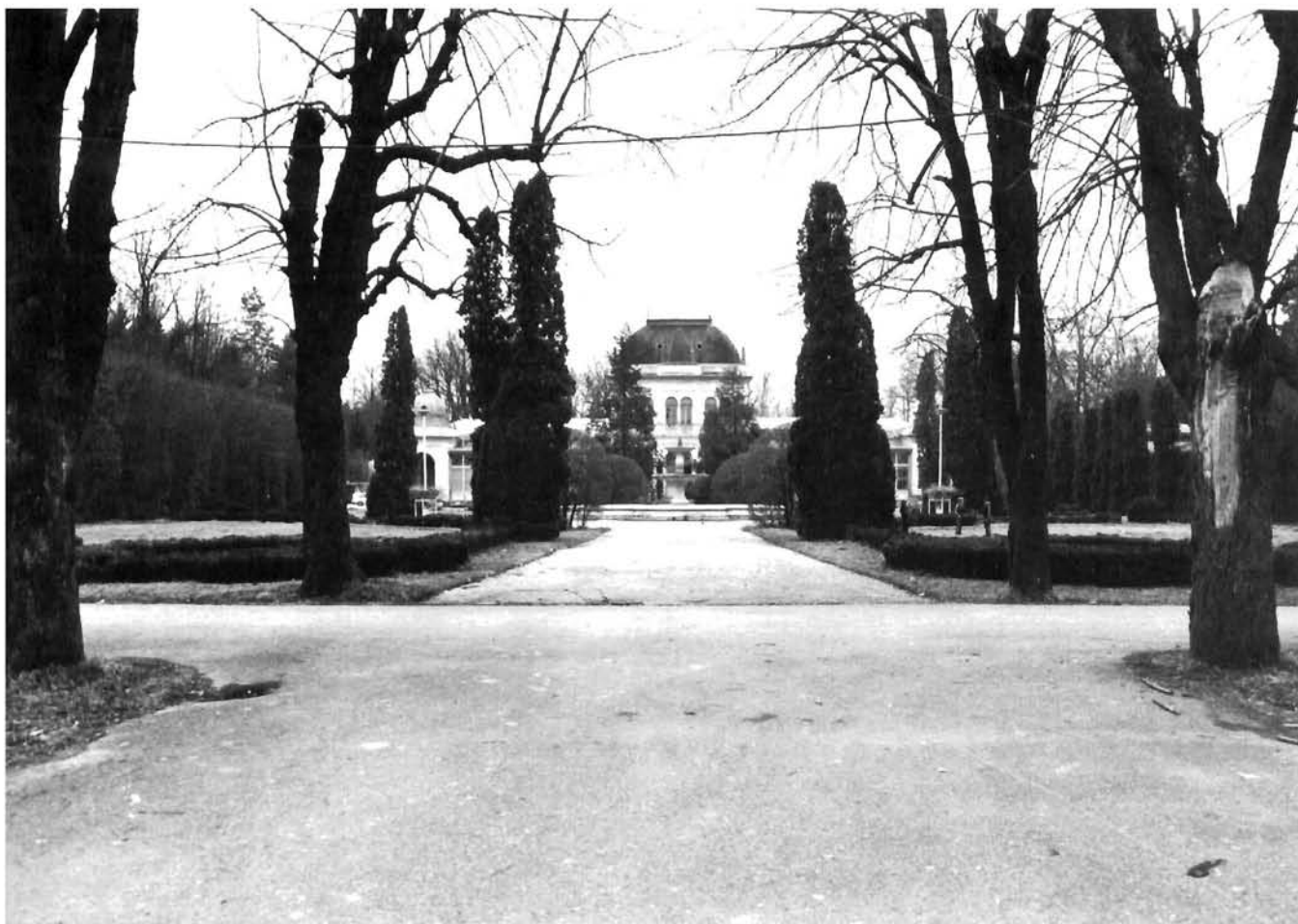
Lipik, središte lječilišnog kompleksa prije razaranja Lipik, Thermae, balneological complex before the destruction

imati mnogo zajedničkoga sa starima. Dosadašnji prijedlozi za aktualizaciju i minimalnu modernizaciju tradicijske kuće teško da mogu biti prihvaćeni, jer ne vode dovoljno računa o promijenjenim okolnostima i potrebama. Taj je problem, međutim, vrlo urgentan i zahtijeva ozbiljniji angažman i pomoć većeg broja kreativnih arhitekata.