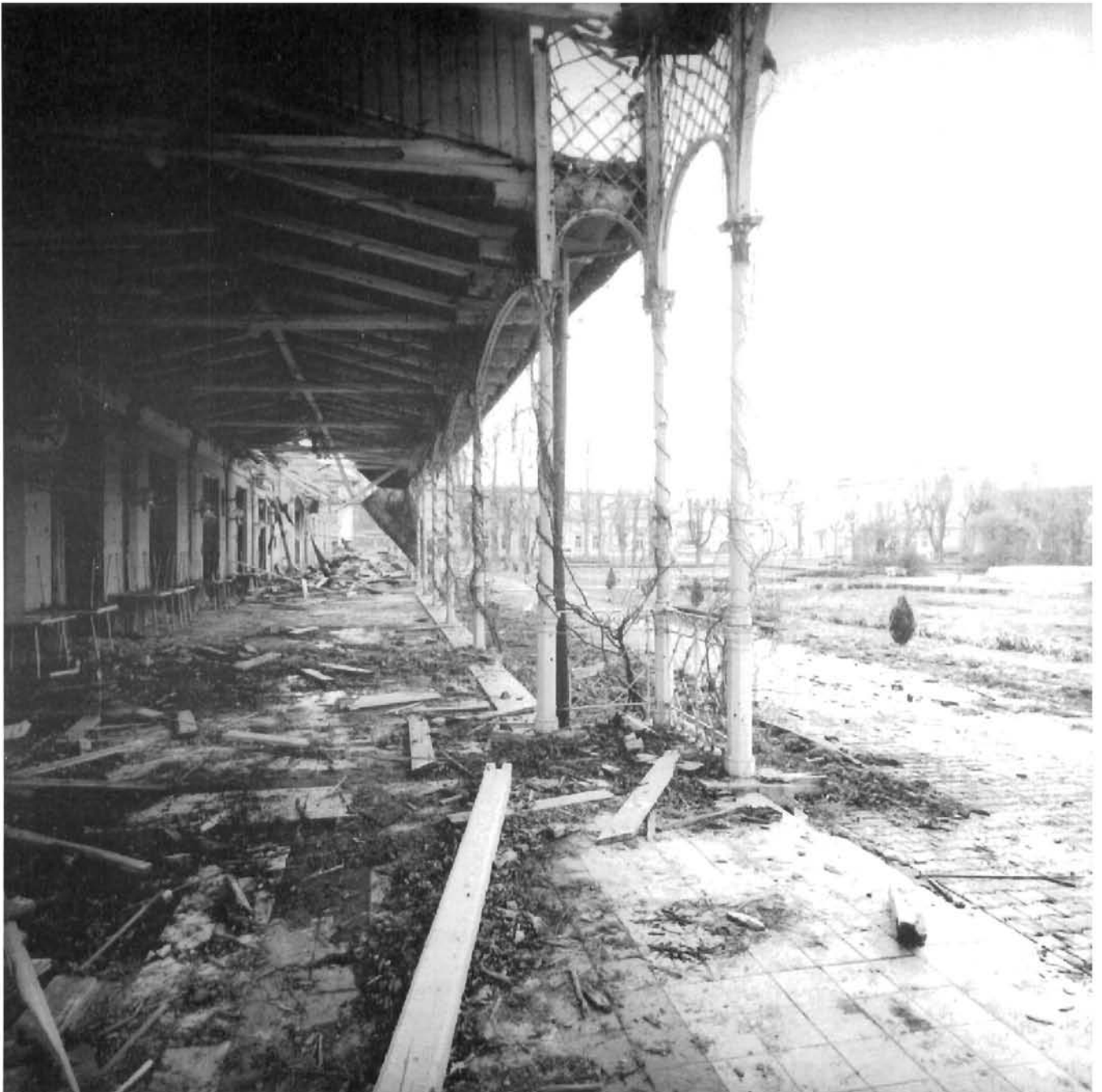
Lipik, dio lječilišnog kompleksa nakon razaranja Lipik, part of balneological complex after the destruction

Grad je formalno pod nadzorom UNPROFOR-a, ali stvarnu vlast imaju kvislinzi koje je uspostavio okupator. U godinu dana nakon osvajanja oni nisu uspjeli osigurati ni najelemnarnije potrebe, pa uglavnom nema čak ni struje ni vode. Teško oštećene i devastirane povijesne građevine i dalje rapidno propadaju, a grad stoji kao sablasna ruševina. Nakon osvajanja potpuno je opljačkan i ispražnjen, ostavši bez stoljetne kulture svojih građana. Gradski muzej, koji je bio sklonjen u podrum-ske prostorije baroknog dvorca Eltz, gdje je bila smještena njegova vrijedna zbirka, također je opljačkan i otpremljen u