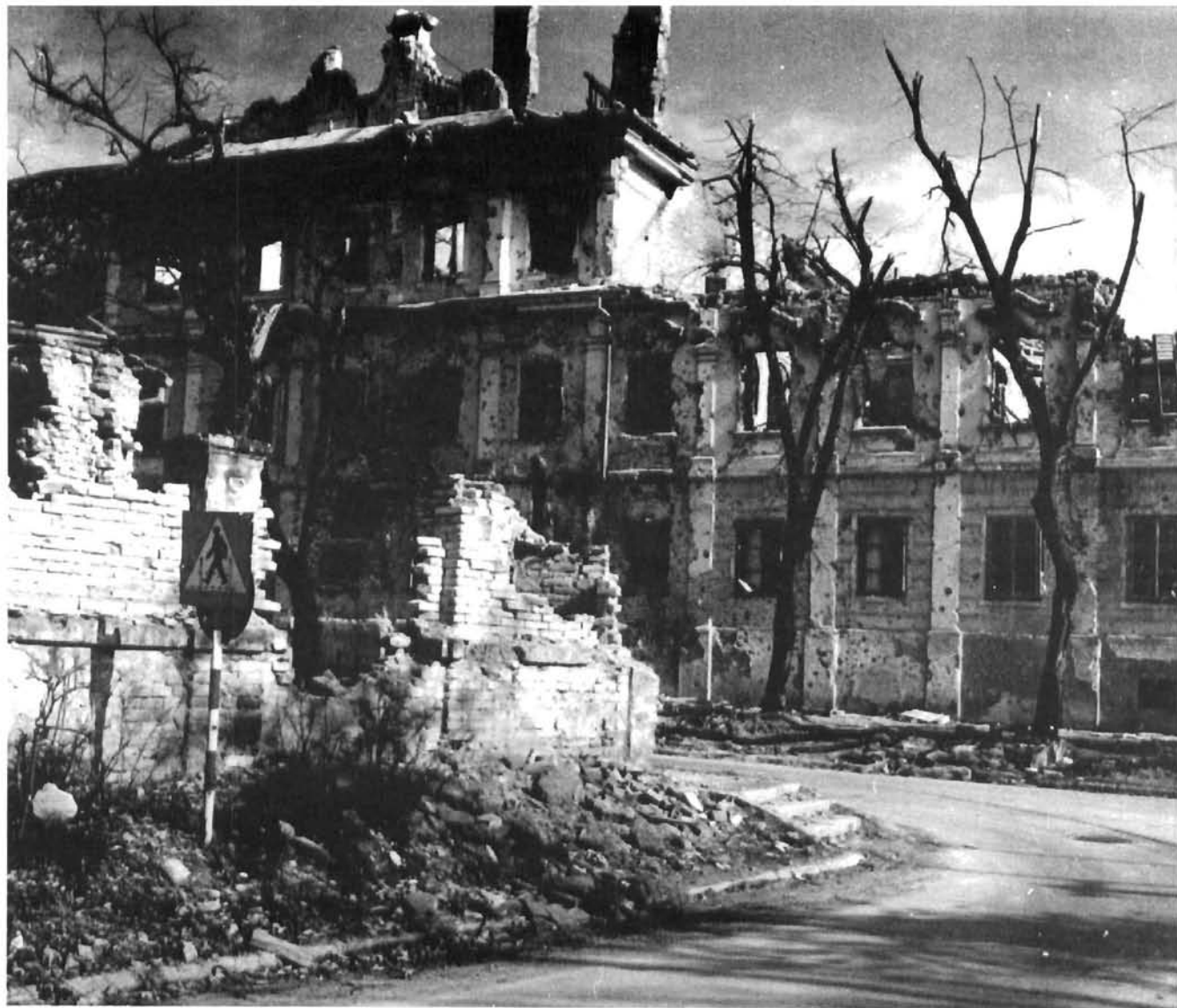
Vukovar, dvorac Eltz, ulično pročelje nakon razaranja Vukovar, the Eltz Castle, main facade after the destruction