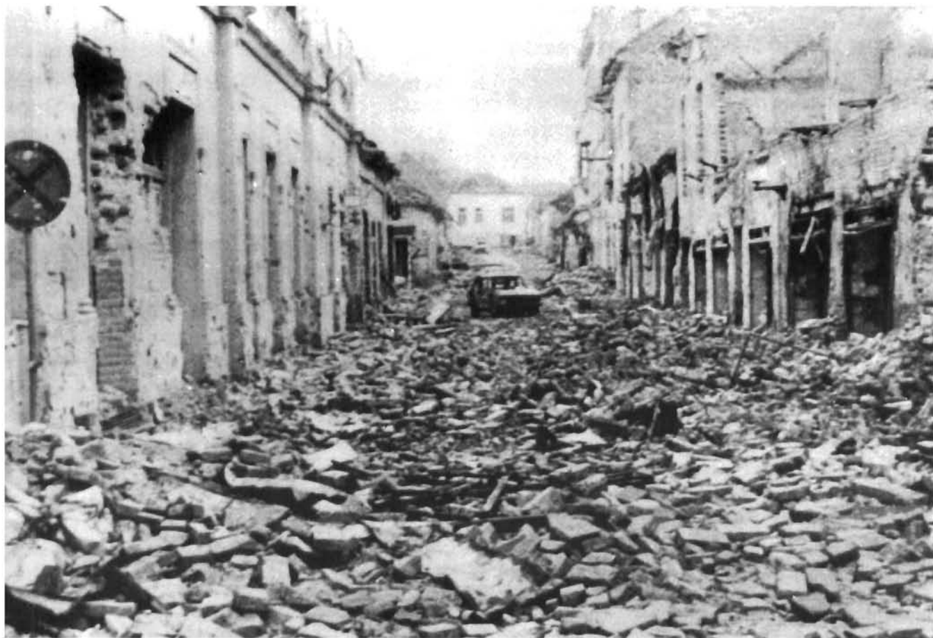
Vukovar, središte grada u jesen 1991. Vukovar, center of the town, autumn 1991

Slučaj Voćina, malog, danas potpuno razrušenog naselja u zapadnom dijelu Slavonije, u tom je smislu još indikativniji. Svoju nesretnu povijest u ovom stoljeću Voćin duguje istim razlozima koji su doveli do njegova konačnog, gotovo potpunog uništenja. Nakon tri rata mjesto je ostalo bez svojih povijesnih spomenika koji su mu davali izraziti identitet i izdvajali ga među susjednim naseljima. Nakon prvoga svjetskog rata 1918. u lokalnoj "mini revoluciji" u znak tadašnjeg ujedinjenja u novu državu srušen je klasicistički dvorac obitelji Janković koji je, zajedno sa svojim velikim parkom, davao osobiti pečat mjestu u romantičnom krajoliku, s planinskim potokom koji teče njegovim središtem. U drugom svjetskom ratu spaljena je kasnogotička crkva sv. Marije, najvažniji povijesni spomenik Voćina, gotovo su posve nestale ruševine srednjovjekovnog kaštela koje su stajale visoko na vrhu brijega iznad naselja, a sada je nestala i sva stambena i ostala starija arhitektura samog naselja.