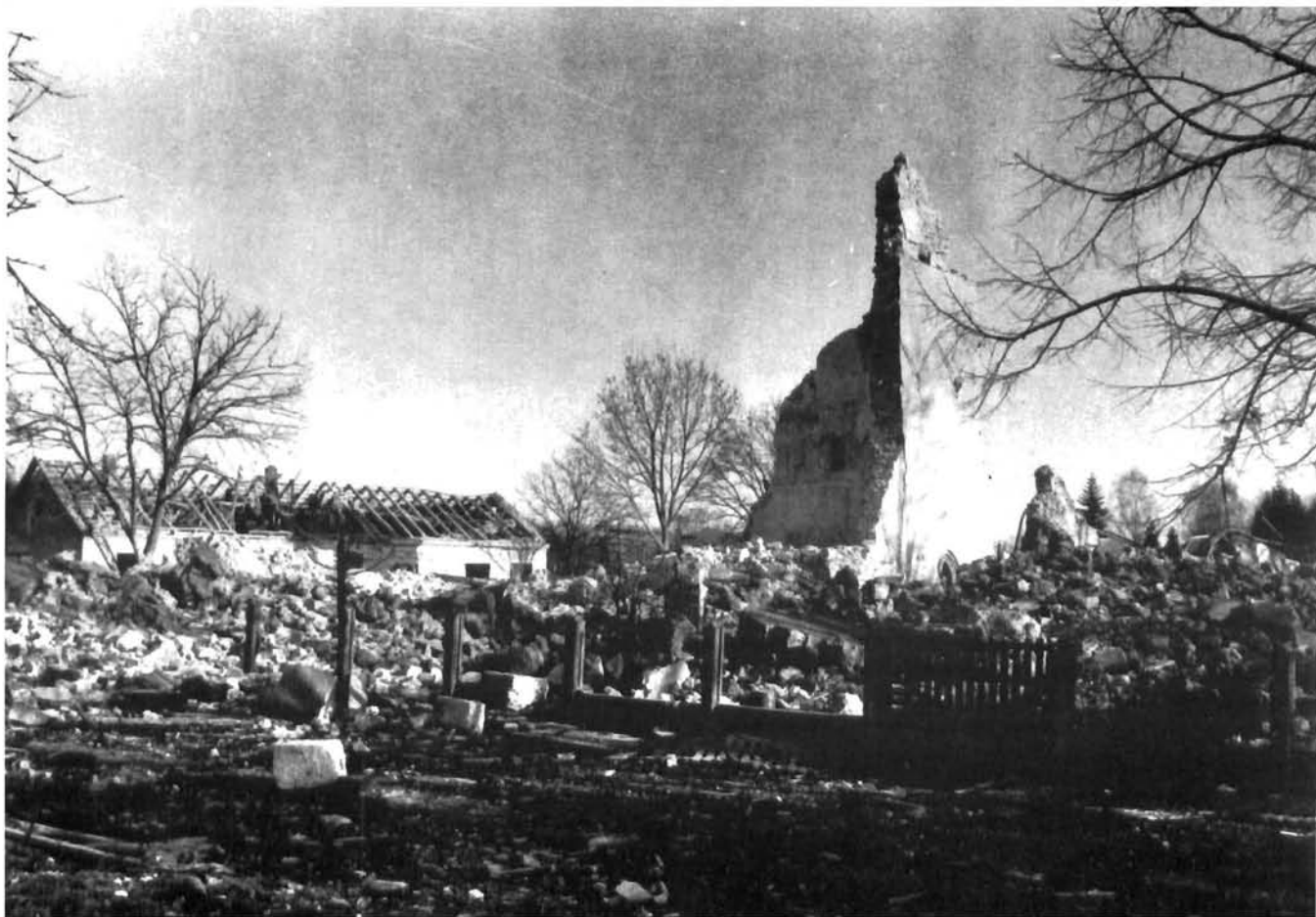
Voćin, crkva sv. Marije nakon eksplozije Voćin, St. Mary Church after the explosion