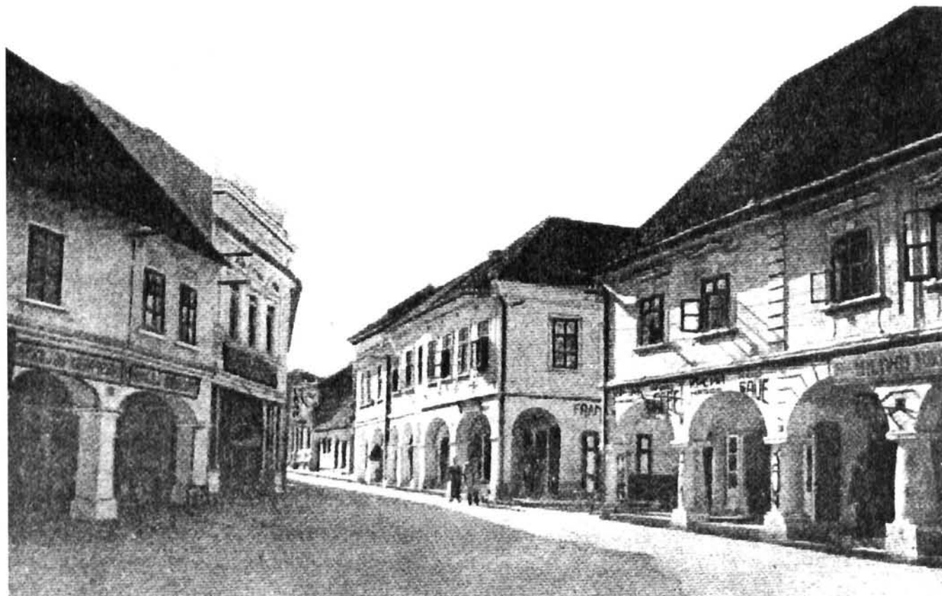
Vukovar, glavna ulica, izgled prije rata Vukovar, the main street before the war

U situaciji kada je neizvjestan datum povratka Vukovara u vlast Hrvatske, ozbiljnije planiranje obnove vrlo je otežano. Ali trebalo bi pripremiti prije svega strategiju obnove grada, njegove revitalizacije i rehabilitacije onih njegovih urbanih vrijednosti koje su činile temelj urbaniteta. Za obnovu povijesnih spomenika sada nedostaje prije svega dovoljna arhitektonska dokumentacija. Grad se formalno nalazi pod zaštitom UN, pa bi možda u ovom slučaju međunarodna pomoć mogla biti djelotvorna.