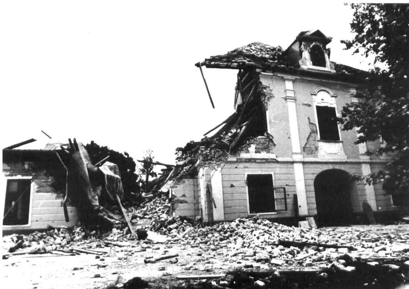
Vukovar, dvorac Eltz, ulaz u dvorac i dvorišno krilo nakon razaranja Vukovar, the Eltz Castle, entrance and the courtyard wing after the destruction