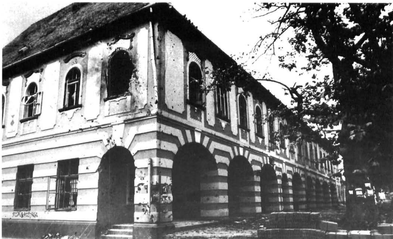
Vinkovci, zgrada Muzeja Vinkovci, Town museum