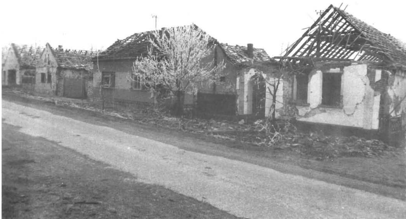
Nuštar, ulica u selu, jesen 1991. Nuštar, a street in the village, autumn 1991