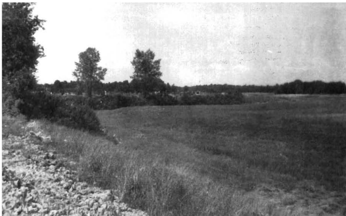
Ostaci tvrđave Orlica Remains of the Orlica fortress

Orsovi, Temišvaru, Szegedinu, Velikom Varadinu i Arrathu, za koje je radio i planove.