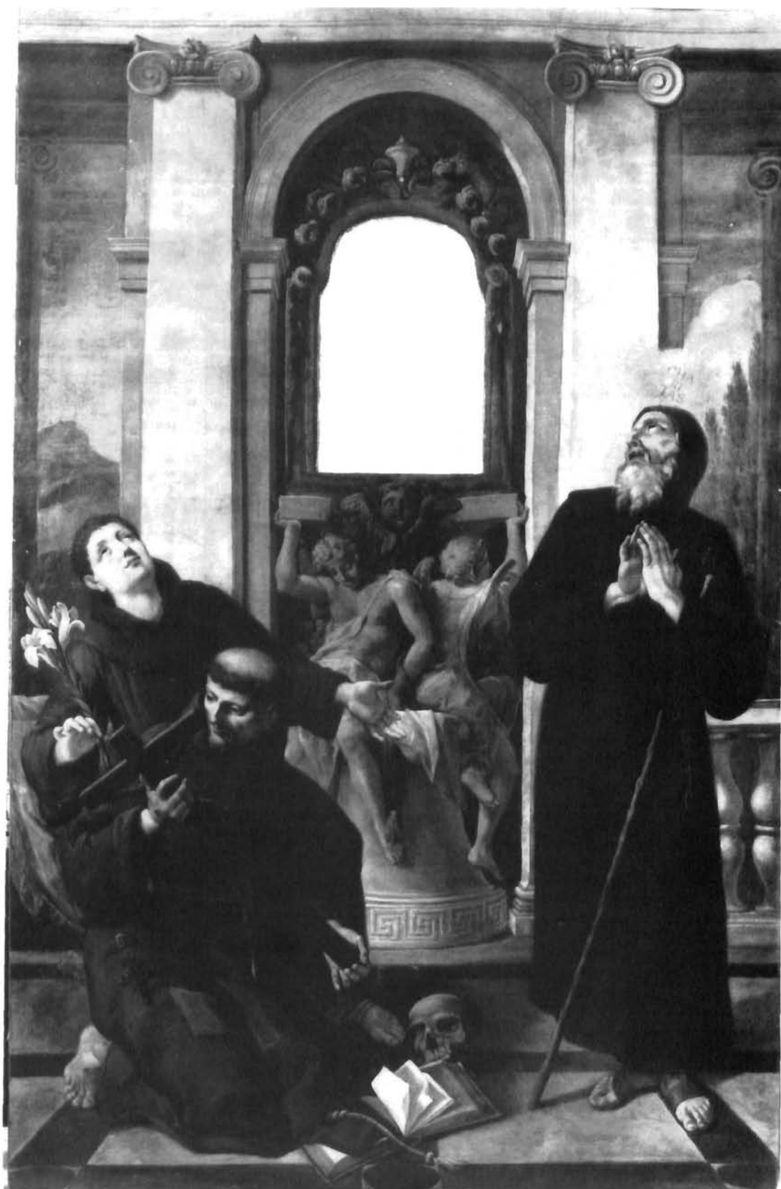
G.B.A. Pitteri, Oltarna pala obitelji Garanjin u katedrali u Trogiru G.B.A. Pitteri, altar pala of the Garanjin family in the Trogir cathedral