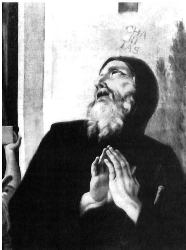
G.B.A. Pitteri, Oltarna pala obitelji Garanjin u katedrali u Trogiru, detalj G.B.A. Pitteri, altar pala of the Garanjin family in the Trogir cathedral, a detail

Atribuciju trogirski pale G.B.A. Pitteriju zasnivamo na nizu analogija s mnogim pojedinostima na spomenutim njegovim djelima u Dalmaciji i na općenitim sličnostima s njegovim palama s manjim brojem likova u kompoziciji, te na srodnostima s njegovom tipologijom i s kolorističkim rješenjima.