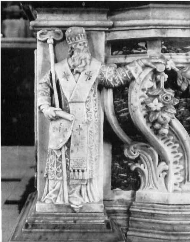
Murter, sv. Jeronim, glavni oltar Murter, main altar, St. Jerome