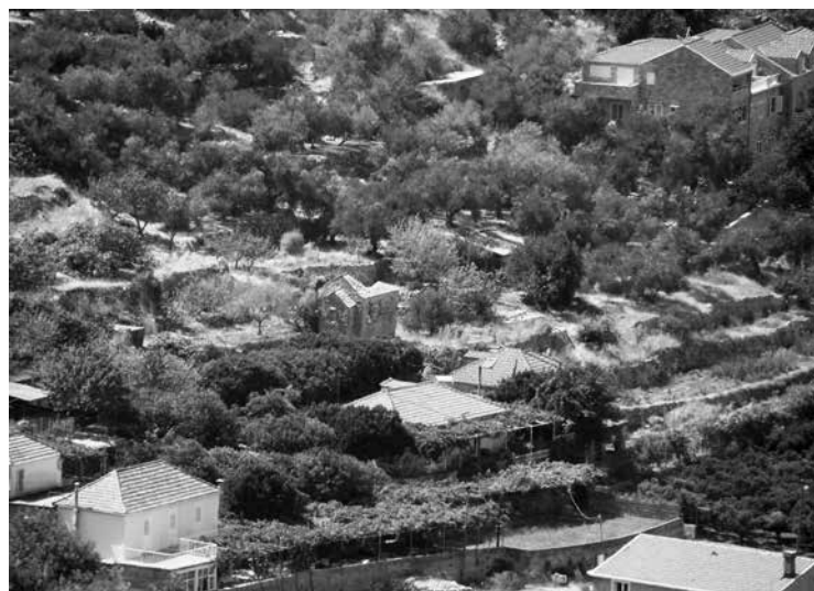
sl. 1. Pogled na crkvu sv. Ilije na Lopudu.

Na otoku Lopudu, na jugozapadnom dijelu lopudske uvale, podno predjela Sutiona (Sutionik), smještena je srednjovjekovna crkva sv. Ilije (sl. 1) 1 . Ta ranoromanička građevina, jedan od primjera tzv. južnodalmatinskog jednobrodnog kupolnog tipa – u novije vrijeme datirana u prvu polovinu ili sredinu 12. stoljeća 2 – bila je podignuta kao dio složenijeg sklopa, čije faze izgradnje i funkcija, međutim, još nisu ustanovljene. U ranijoj se literaturi navodi kako je uz crkvu, na njevoj sjevernoj strani, bio podignut zvonik, a spominje se i naknadno podignuti trijem uz zapadno pročelje 3 . Crkva je već u 18. stoljeću bila u ruševnom stanju, u kakvom je