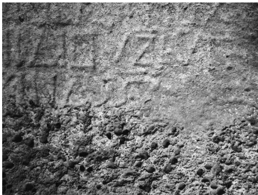
sl. 6. Lopud, Župna zbirka, sarkofag Izaka sina Antiohova, detalj svršetka natpisa.

Oblikom je minuskulna stigma (ς) veoma nalik minuskulnoj završnoj sigmi (ζ), pa ih je često moguće razlikovati samo po kontekstu (utoliko više jer se stigma rijetko javlja u majuskulnom obliku). Osim kao ligatura slova sigma i tau (ΣΤ, στ), stigma je u grčkom pismu služila i kao numerički znak za brojku 6, u čemu je bila sljednik stare digame, šestog slova arhaičnog alfabeta; ujedno, stigma se koristila kao interpunkcijski znak (στίγμα je u izvornom značenju „ubod, oznaka, točka, biljeg, žig, znak“) i kao oznaka pokrate. Razlikujemo, dakle, četiri funkcije stigme: u službi ligature, u službi znaka interpunkcije ili pokrate, i u službi brojke. Pošto je kao ligatura ζ = στ stigma ušla u upotrebu tek u srednjobizantskim tekstovima 9. i 10. stoljeća, pisanim minuskulom, jasno je da u našem natpisu može biti riječi jedino o drugim trima funkcijama stigme – brojci, pokrate ili interpunkciji. Kako je u epigrafiji teško razlučiva razlika između stigme kao pokrate/interpunkcije i stigme kao broja (u bizantskoj terminologiji ἐπίσημον) zbog njihova identična oblika, u klesanim tekstovima ih se uočava prema kontekstu u kojem se nalaze. U našem je slučaju ta zadaća olakšana time što je na lopudskom natpisu klesar upotrijebio dvije donekle različite grafije za te dvije službe istog grčkog slova – očigledno kako bi natpis učinio razumljivijim te potencijalnim čitateljima olakšao snalaženje. Stigmatu u značenju brojke 6, naime, uklesao je u pravilnom, uspravnom obliku te u