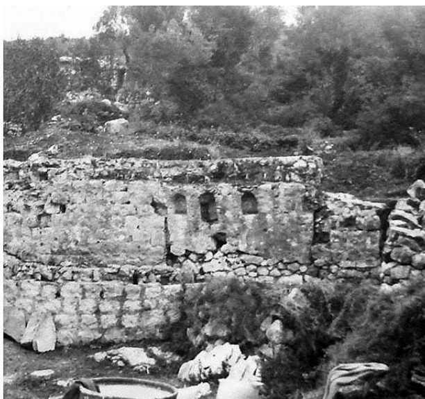
sl. 2. Lokalitet crkve sv. Ilije – južni zid s tri niše i grobnica (Fototeka Konzervatorskog odjela u Dubrovniku, 1978., foto: M. Mojaš).

đeni i ulomci pleterne plastike ranoga srednjeg vijeka, kao i ulomci arhitektonske dekoracije i crkvenog namještaja iz 5. i 6. stoljeća 8 , što upućuje na mogućnost da je i prije izgradnje ranoromaničke crkve sv. Ilije, moguće adaptacijom nekog rimskog, a svakako ranijeg zdanja, na lokalitetu najprije bila uređena ranokršćanska kulturna građevina.