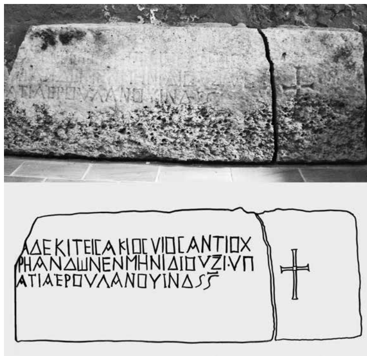
sl. 3. Lopud, Župna zbirka, ulomci sarkofaga Izaka sina Antiohova, 452. godina.