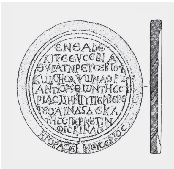
sl. 7. Arheološki muzej, Split, nadgrobna menza Euzebije, 5. ili 6. stoljeće ( Salona I. Catalogue de la sculpture architecturale paléochrétienne de Salone . [Collection de l'École française de Rome, 194], ur. N. Duval, E. Marin, C. Metzger. Rome - Split, 1994: Pl. XXXVI, kat. VII. c. 5).

sad navedene paleografsko-epigrafske, jezične, toponimijske i antroponimijske karakteristike kakve smo primijetili na Izakovu epitafu. To su: sarkofag Kirina sina Talasijeva porijeklom iz naselja [...]meles[...], vjerojatno Sirijca (ime njegova oca Thalassios često je u Siriji) ili Maloazijca (toponim je prema sufiksu maloazijski), datiran 27. rujna 440. godine; sarkofag nepoznatog pokojnika datiran 17. rujna 450. godine; sarkofag Euzebija sina Stratonova iz sela Zopyros (Mala Azija ili Bliski istok), iz sredine 5. stoljeća 72 . Lopudski sarkofag kvalitativno i kvantitativno obogaćuje korpus grčkih natpisa i onomastike u ranokršćanskoj Dalmaciji, do sada poznatih praktično samo u Saloni.