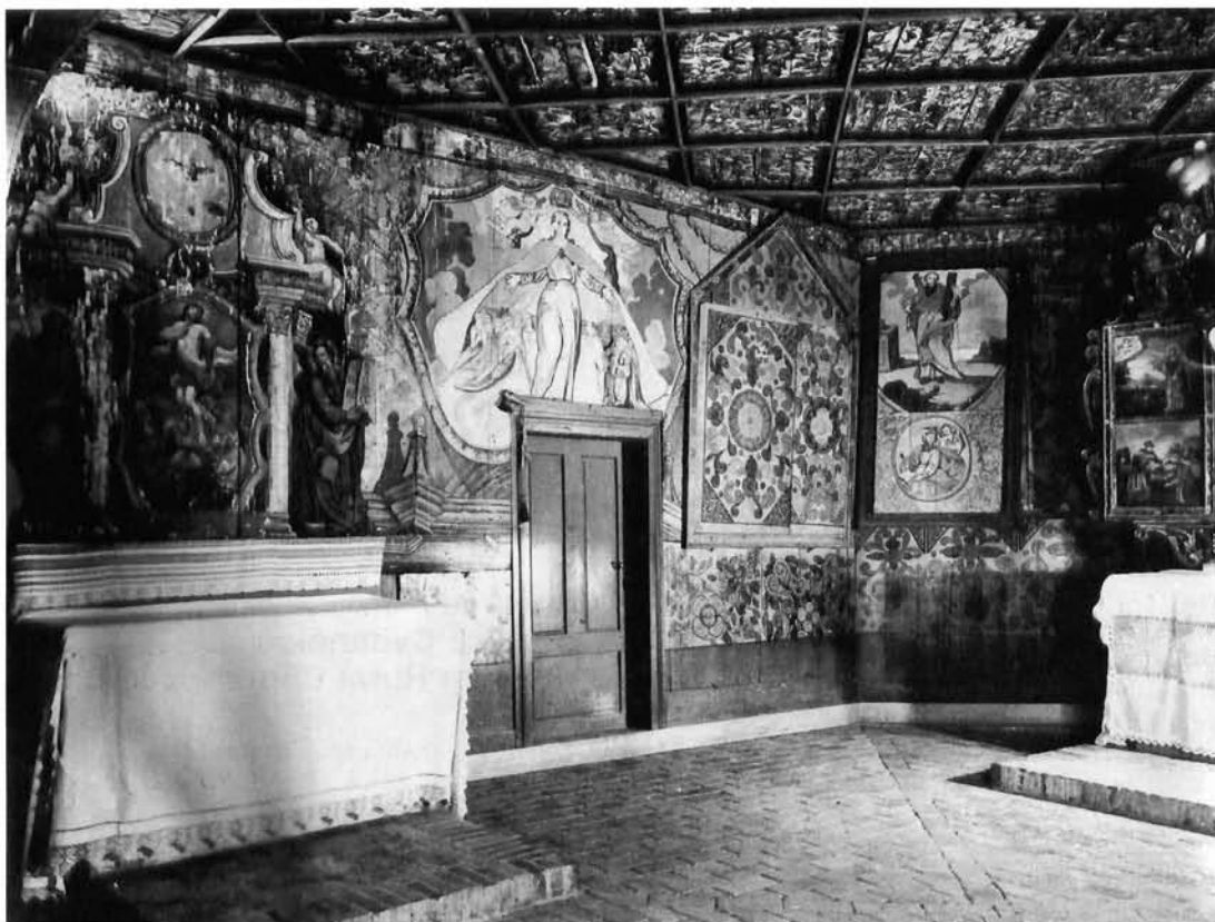
Velika Mlaka – Sv. Barbara, pogled na sjevernu stijenu svetišta Velika Mlaka – Sv. Barbara, view of the northern wall of the sanctuary