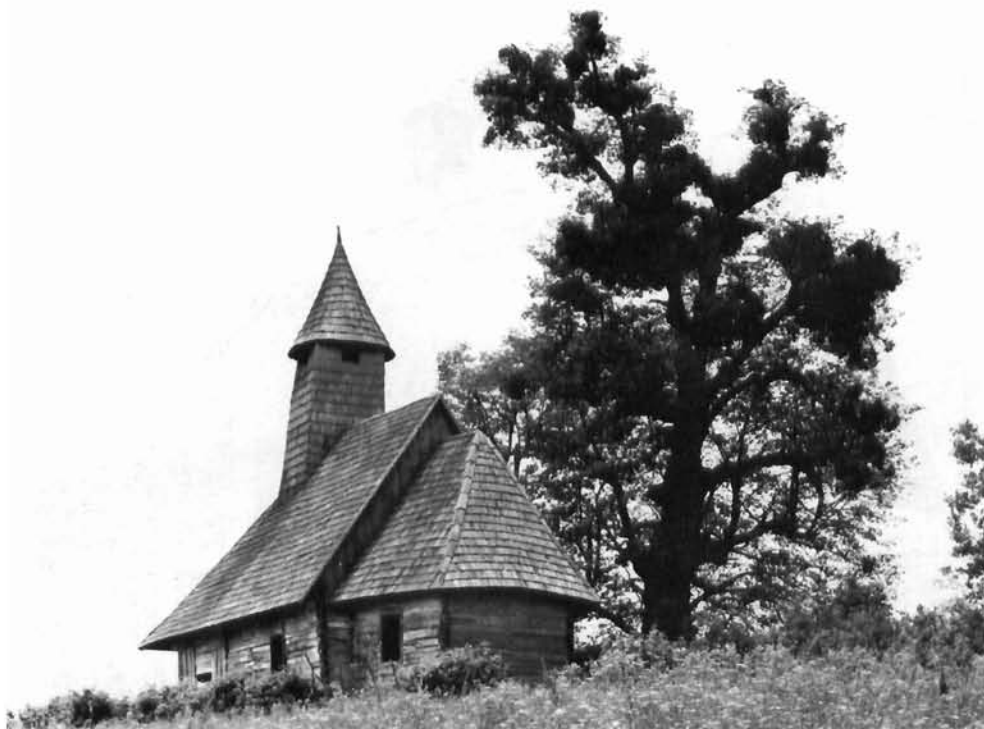
Ljevi Štefanki – kapela sv. Jurja Ljevi Štefanki – the chapel of St. George