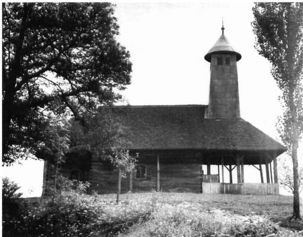
Banski Kovačevac – drvena kapelica Banski Kovačevac – the wooden chapel