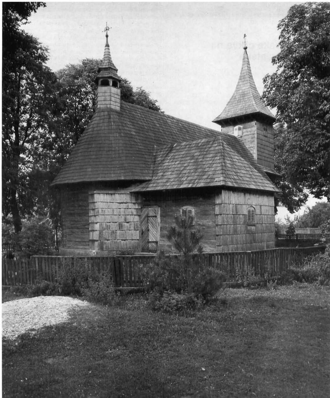
Velika Mlaka – Sv. Barbara, drvena kapela Velika Mlaka – Sv. Barbara, the wooden chapel