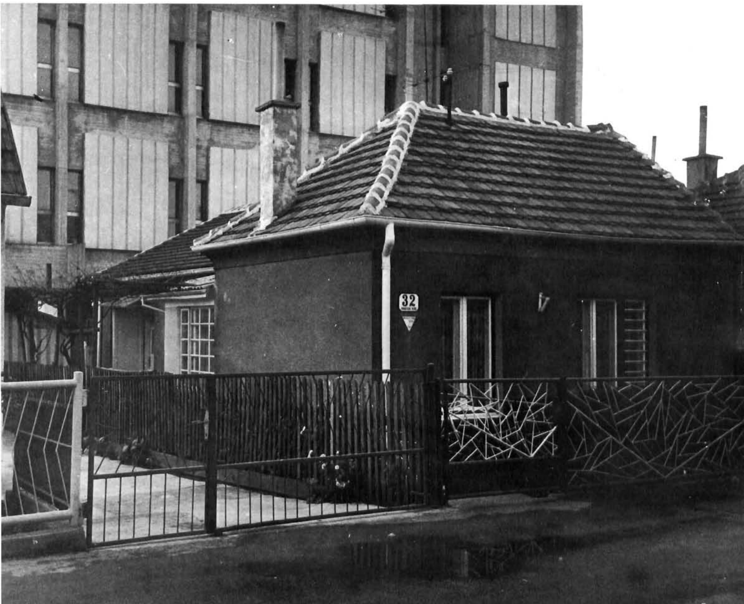
Ovo je primjer dosadašnjeg postupka prema Trnju