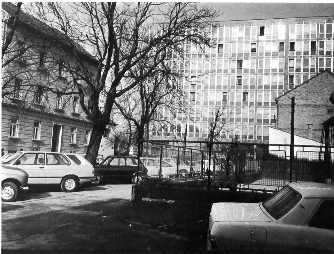
»Palača pravde« bez ikakve je potrebe presjekla povijesnu prometnicu. »Konkretan« prostor (središta jedne velike periferijske zone) pretvorila je u »apstraktan« prostor (makete), ne uspostavljajući nikakav odnos s okolinom u kojoj se nalazi, niti naviještavajući moguću tvorbu nekog novog odnosa.

dokida kategoriju »ničije zemlje« kakva se stvara među slobodno posijanim objektima. On uvažava gotovo biološki zakon javnog i privatnog, ostavljajući s vanjske strane jači javni promet, javne sadržaje, ulicu, a otvarajući s unutrašnje strane prostor mira i rekreacije. Zelenilo unutrašnjosti bloka više nije »ničije zelenilo«, nego park jedne zajednice stanara koja upravo oko te središnje površine stječe svoju koheziju. Trnje može postati uistinu nov Donji grad ako toj zlorabljenoj, ali vrijednoj povijesnoj formuli dade novu socijalnu interpretaciju.