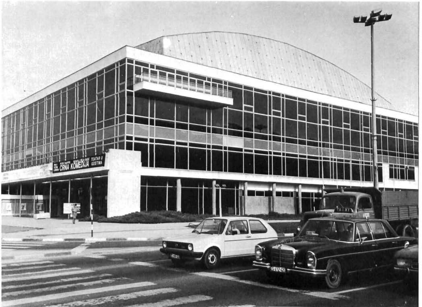
Novi javni objekti u Trnju nisu oko sebe oblikovali nikakvu »kontaktnu zonu«. Postavljeni u asfaltnoj pustoši, ravnodušni prema prolazniku, niti jednim elementom ne pokušavaju ga zaustaviti u svojoj blizini.

do Trnja, ali ne Trnja do središnjeg Zagreba. Stoga treba posvetiti maksimalnu pažnju oblikovanju i sadržajnosti, funkcioniranju onih ulica koje će uistinu spajati Trnje s Donjim gradom, kao što su produžena Draškovićeve, produžena Runjaninova ( bez odvojka kroz Botanički vrt! ); treba povesti računa o povlačenju spojeva na liniji Petrinjske, Palmotićeve, te ostalih ulica koje se okomito slijevaju u Branimirovu. Bez obzira koliko ova primjedba zvučila nerealno, dovoljno je podsjetiti se intenzivne uloge starog željezničkog mosta koji je Trnjansku cestu dovodio do kolodvorskog trga i Branimirove, i zapravo spajao s Petrinjskom. Za odvijanje pješačkog prometa serija ovakvih mostova može poništiti zapreku pruge, stvarno povezati dvije umjetno odvojene gradske cjeline, pa čak postati i element identiteta ovoga područja. Drugim riječima, ulice koje iz Trnja treba povlačiti prema sjevernom Zagrebu moraju se ponašati kao da pruge nema — jer je jednoga dana uistinu možda neće biti.