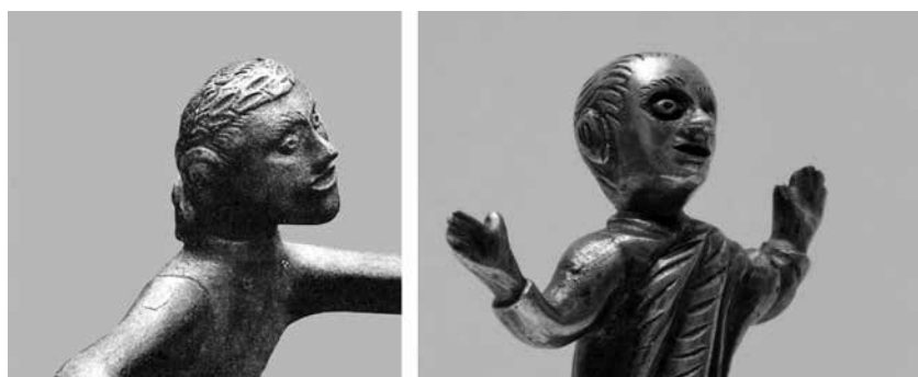
sl. 7. Usporedba glava gardunskog oranta i muškarca iz sinjske grupe .