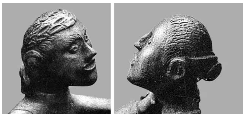
sl. 6. Muška i ženska glava sinjske grupe .

Zajednička osobina lica na svim kipićima jest da imaju naglašenu veliku mesnatu bradu, poluotvorena usta, široki nos s probušenim nozdrvama, velike oči s romboidnim reljefnim zjenicama te lučne široke obrve izvedene urezima (sl. 7). Na glavama su u svim primjerima i velike uši s rupom u sredini, kojom se pokazuje otvor toga slušnog organa. I kosa na glavi muškarca s lovorovim vijencem iz sinjske grupe vrlo je slična onoj na gardunskom kipiću. Izvedena je širokim urezima koji se pružaju od čela prema tjemenu. Vrlo zanimljiv detalj na licu gardunskoga oranta su široki i dugački zalisci (njem. backenbart , tal. baffi , franc. rouflaquette , eng. sideburns ), preciznije izvedeni na desnoj strani glave (čini se da ih je imao i muškarac sinjske grupe ), a koji se kao modni detalj na muškome licu pojavljuju tek od 18. stoljeća (sl. 8). U široku upotrebu ušli su u drugoj polovini 19. stoljeća, što bi također mogao biti vrlo važan pokazatelj vremena u kojemu je kipić napravljen. Prsti na rukama gardunske statuete izvedeni su dorađivanjem nakon lijevanja, i to