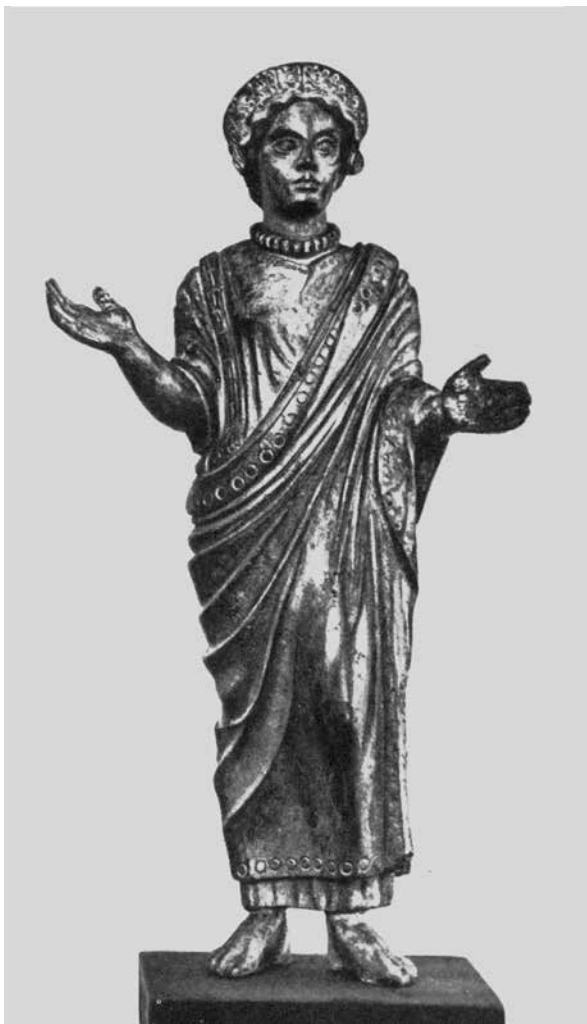
sl. 2. Figurica oranta iz Britanskog muzeja (prema: Th. Klauseru).

što je vrlo dobro bilo pokazano i na tematskoj izložbi organiziranoj u Ravenni 9 . Ta je izložba također pokazala i to da su prikazi oranta, iako prisutni u umjetnosti staroga svijeta, u kršćanskoj umjetnosti upadljivo učestaliji. Posebno se to odnosi na onu njenu sferu koja je nastala u kasnoantičko doba i koja se razvijala tijekom srednjeg vijeka pod okriljem kršćanstva u nekadašnjem istočnom dijelu Rimskog Carstva.