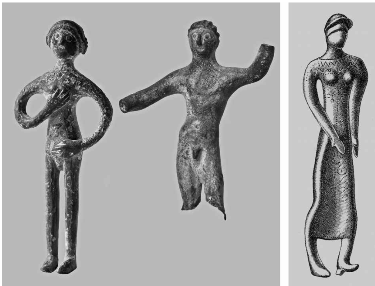
sl. 4. Etrušćanske figurice iz Dalmacije: 1-2. Arheološka zbirka Franjevačkog samostana u Sinju; 3. Studenci kod Imotskog (prema: B. Čović).

ali to ne dolazi u obzir iz jednog drugog razloga... No ni M. Nikolanci nije dobro proučio lik. Nije posrijedi čelava i obrijana glava egipatskih svećenika, jer čovjek ima kosu pruženu od straga prema naprijed i na čelu se jasno vide kratki i ravni pramenovi, oblikovani poput resa. To je italski način češljanja...“