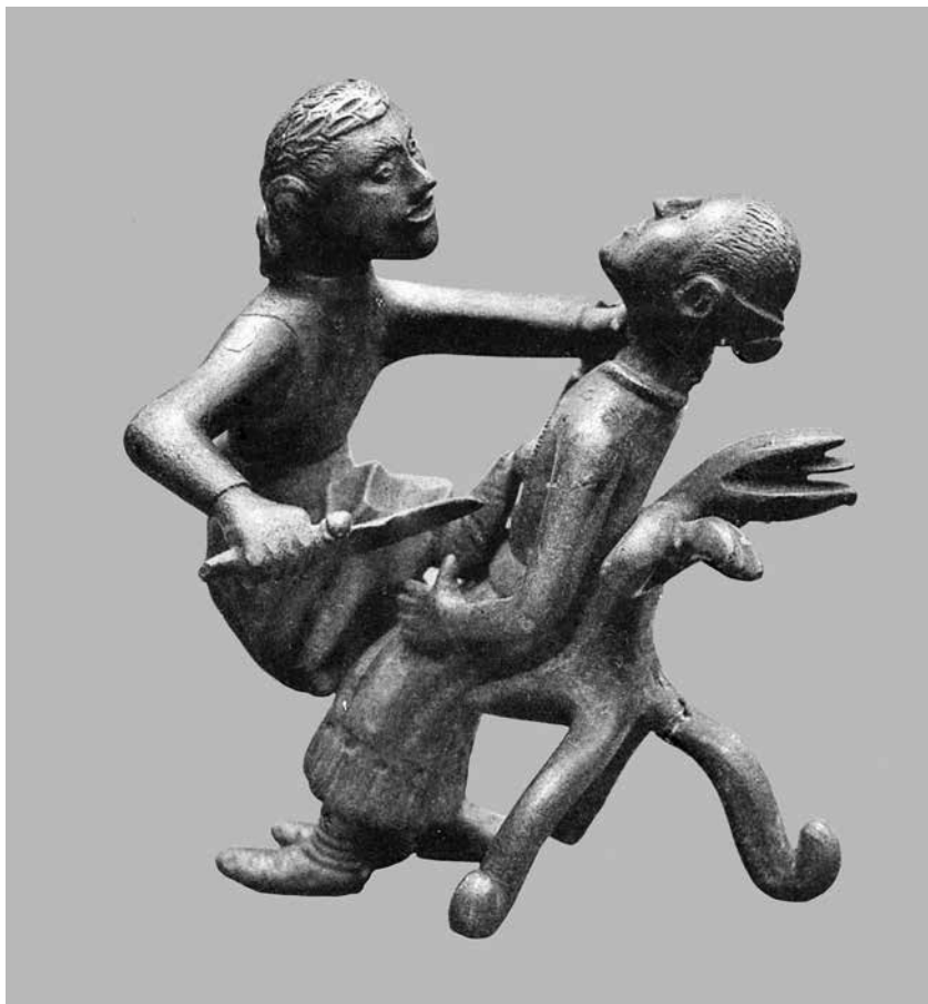
sl. 5. Figuralna kompozicija ( sinjska grupa ), krivotvorina iz kraja 19. stoljeća (prema: GZM, 1890.).

Hörnes tako navodi da je riječ o grupi od dvije sadržajno povezane figurice izlivena u bronci s jednoličnom finom tamnozelenom patinom. Djelomično su sačuvani tragovi posrebravanja, što se vidi u predjelu pojasa muške figure. Najveća širina i visina joj je 11,6 – 13 cm, pri čemu je visina sjedeće ženske figure 11,3 cm, a polustojeće muške 13 cm. Visina tronošca s naslonom je 7,5 cm. Hörnes je još zapisao, a to će se pokazati ključnim u nastavku moga teksta, da su glave obiju figura nesrazmjerno velike. Od tjemena do brade visoke su