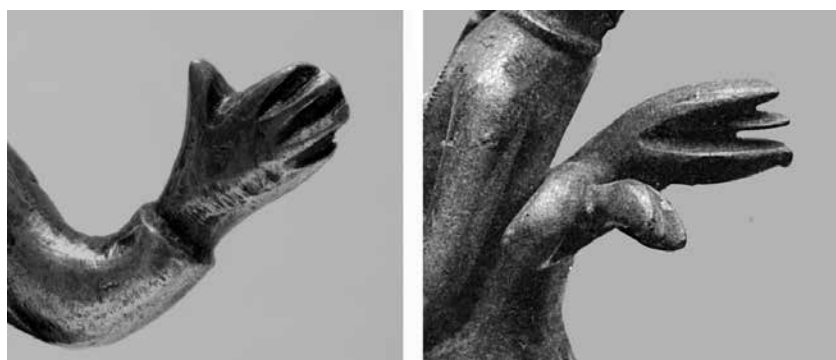
sl. 9. Usporedba detalja na figuricama gardunskog oranta i sinjske grupe .