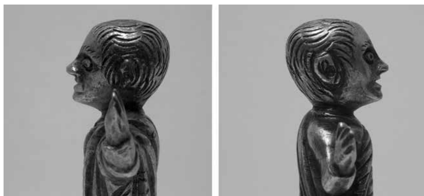
sl. 8. Zalisci na licu gardunskog oranta.