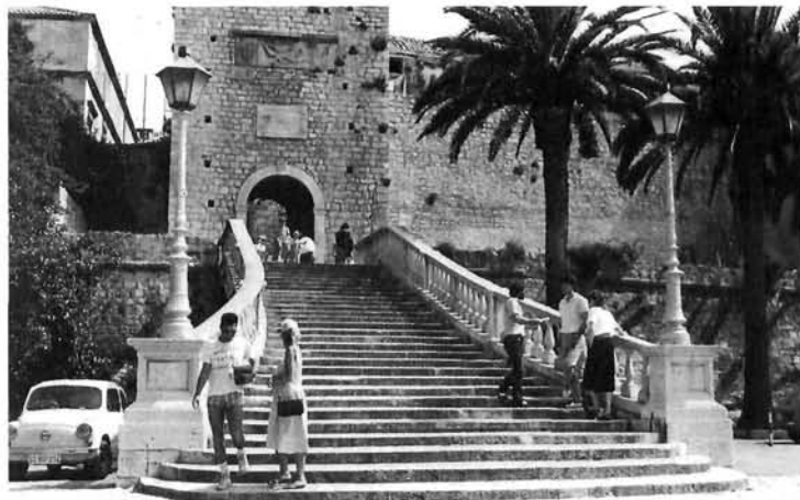
Korčula, Kopnena gradska vrata i dio južnih zidina. 14. stoljeće Korčula, inland city gate and part of the southern ramparts, 14th c

Mala kneževa kula ima oblik vitkog, visokog valjka. Nekada je pri vrhu bio prsobran oslonjen na velike konzole, no sada su obnovljena samo dva prstena konzola, a lukovi prsobrana nedostaju. Na kuli je ploča s grbom kneza F. Loredana i nat-