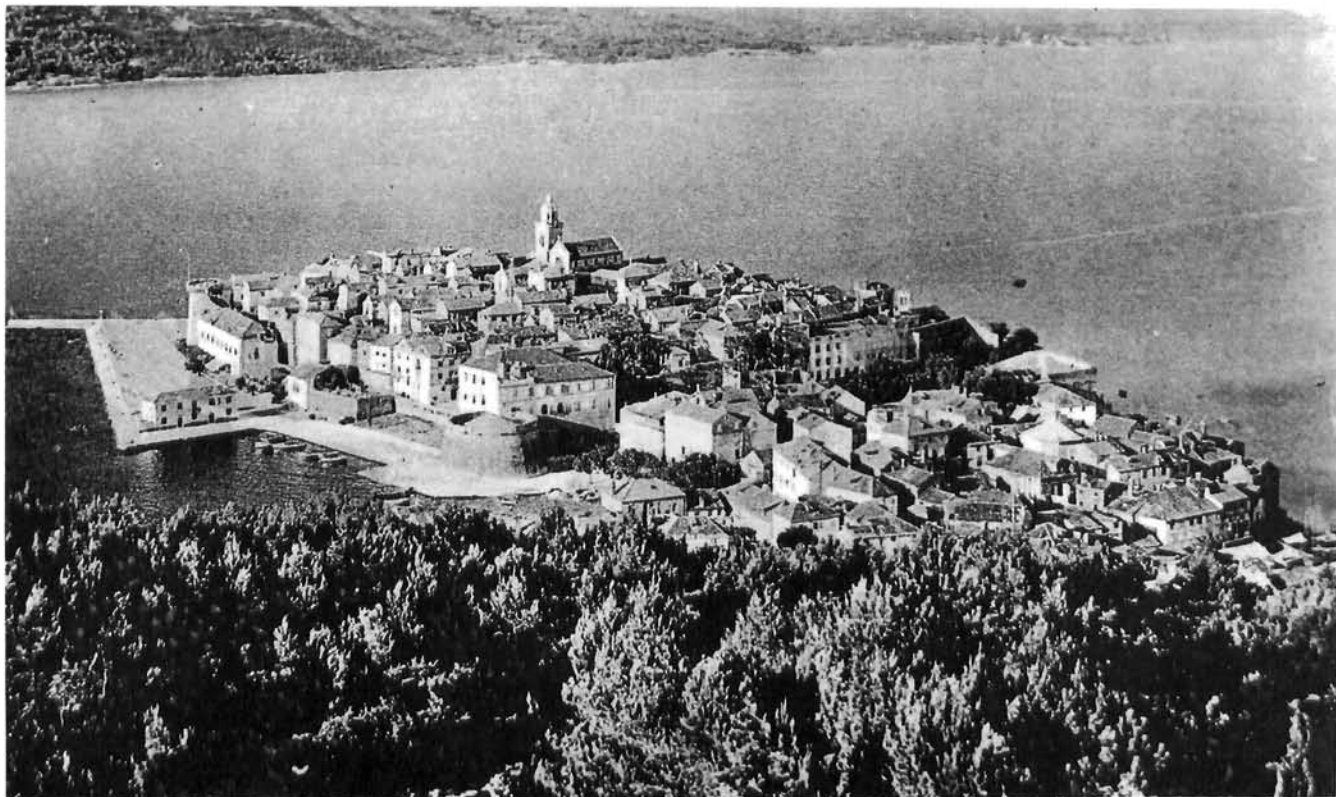
Curzola - Panorama