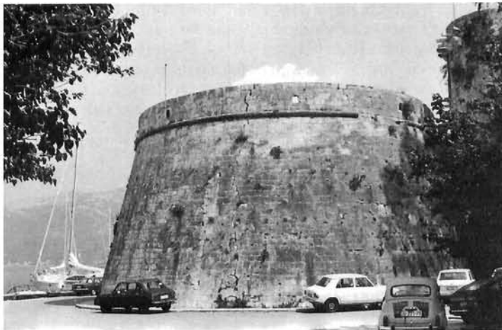
Korčula, Velika kneževa kula, 15. stoljeće Korčula, large Rector's Tower, 15th c

MCMXXV Korčulani« ukrašena stiliziranim, klesanim pleternim okvirom. Sjeverno pročelje kule gotovo sasvim pokriva slavluk Leonarda Foscola. Natpis na slavluku ističe pohvalnim riječima Foscolove pobjede nad Turcima a glasi: