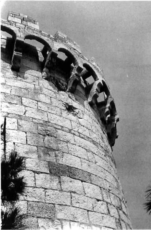
Korčula, krunište kule Zakerjan (Berim). 15. stoljeće Korčula, Zakerjan (Berim) Tower battlements, 15th c

koje je vojska odavno, potpuno i konačno napustila. One su, kaže, tako zapuštene, da će, potraje li ovakvo stanje, sasvim propasti. Stoga traži da se predaju brizi općine. 19