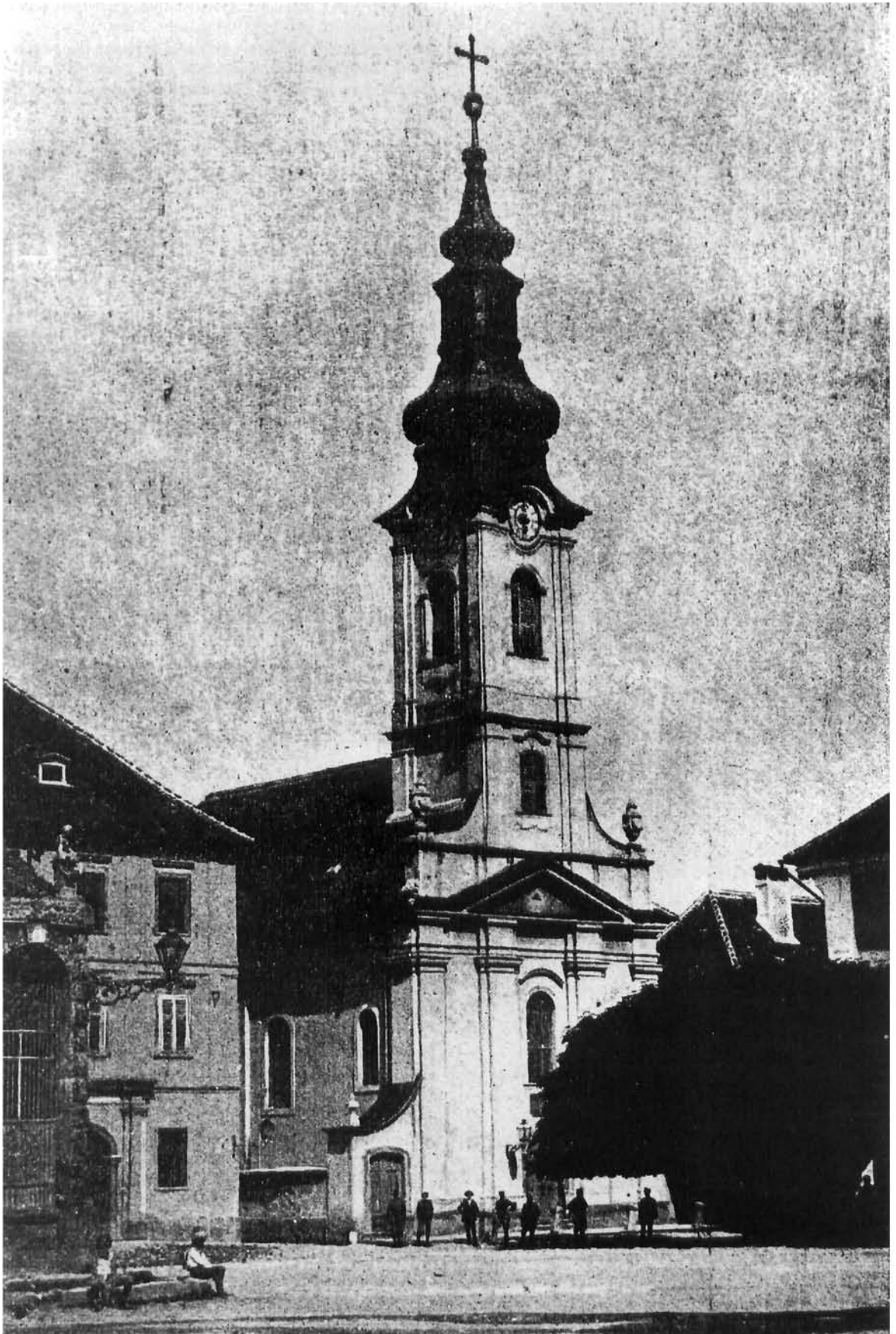
Karlovac, srpsko-pravoslavna parohijska crkva sv. Nikole (E. Strohal, Grad Karlovac, 1906) Karlovac, orthodox church of St. Nicholas (E. Strohal, Grad Karlovac, 1906)