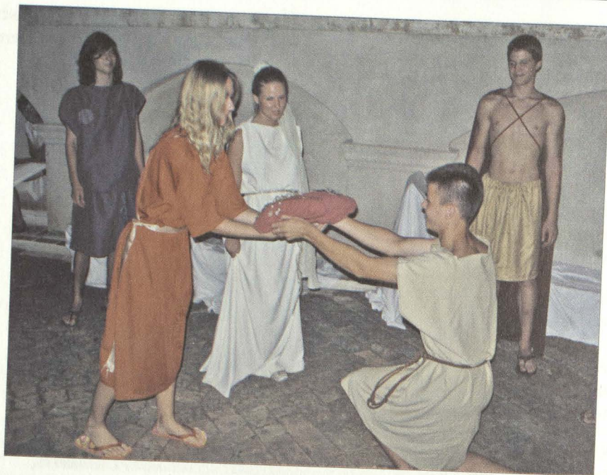
Privatna klasična gimnazija – Zagreb