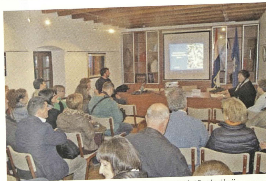
Slika 2. Izlaganje o urbanizaciji antičke Enone u ninskoj Baroknoj kući (fotografirao F. Budić, 5. studenog 2015.)

Posljednji je dio programa posvećen radovima o jadranskom otočju. Nakon povijesnog uvoda o otoku Ugljanu u antici, izlagачi su prezentirali arheološke nalaze s kopna i iz mora na ugljanskim lokalitetima Muline i Gospodska gomila. Uslijedila je