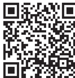
Slika 6. Primjer QR koda.

Visok stupanj razvijenosti tehnologije i investicije potrebne za uvođenje BIM-a do sada su bile prepreka za hrvatske tvrtke. Uz to, problemi su i nedovoljna educiranost zaposlenika o korištenju BIM-a te nedovoljno mogućnosti za dodatno obrazovanje. U Hrvatskoj se organiziraju stručni tečajevi o BIM-u te su oni većinom orijentirani na komercijalne programe i organizirane od strane tvrtki njihovih distributera [49]. Međutim, za kvalitetnu edukaciju ljudskih potencijala i osposobljavanje za odabir alata i procesa odgovarajućih za svaki projekt ili tvrtku zasebno, nužna je šira i nepristrana edukacija. Pozitivan primjer promjena vidi se u novim projektima u hrvatskoj edukaciji, poput organizacije BIM ljetnih škola na građevinskim fakultetima u Zagrebu i Splitu te korištenja QR kodova u obrazovnim projektima. Na slici 6. prikazan je primjer QR koda koji povezuje korisnika s karakteristikama stupa kao konstrukcijskog elementa građevine, a koji je korišten u sklopu Erasmus + projekta EIBigMac s ciljem promicanja građevinske struke u populaciji srednjoškolaca.