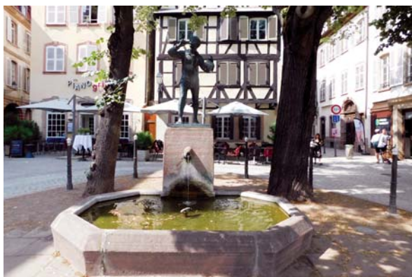
Slika 5: Fontana Meiselocker, zamjena za fontanu Vater Rhein