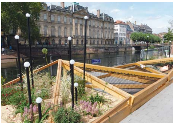
Slika 13: Ljeto u gradu na obalama Illa