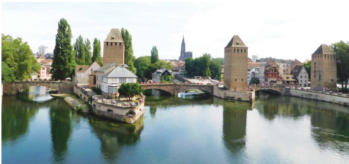
Slika 1: Ponts Couverts, natkriveni mostovi

Strasbourg je staro keltsko naselje smješteno na otoku između dvaju rukavaca rijeke Ill, koje Rimljani pretvaraju u kastrum Argentoratum . U III. i IV. stoljeću bio je snažna rimska utvrda koja je branila limes na donjem toku Rajne. Godine 355. osvojili su ga i razorili Alemani. Grad se ponovno spominje potkraj V. stoljeća