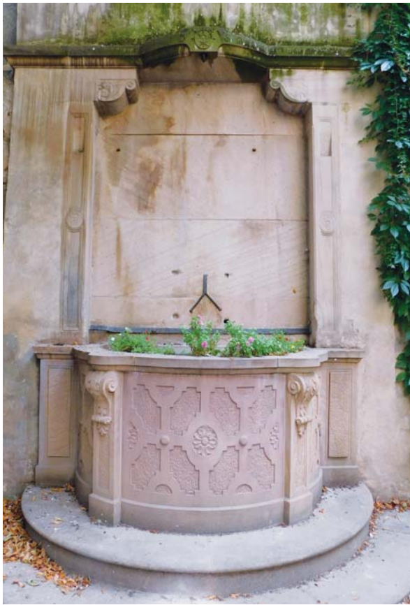
Slika 7: Cour du Corbeau, renesansni bunar iz 1560. godine