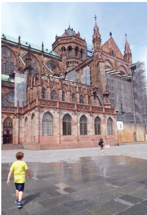
Slika 15: Katedrala – ljetno osvježanje uz podnu fontanu