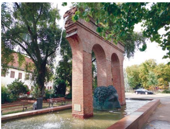
Slika 12: Fontaine de Janus, Janusova fontana