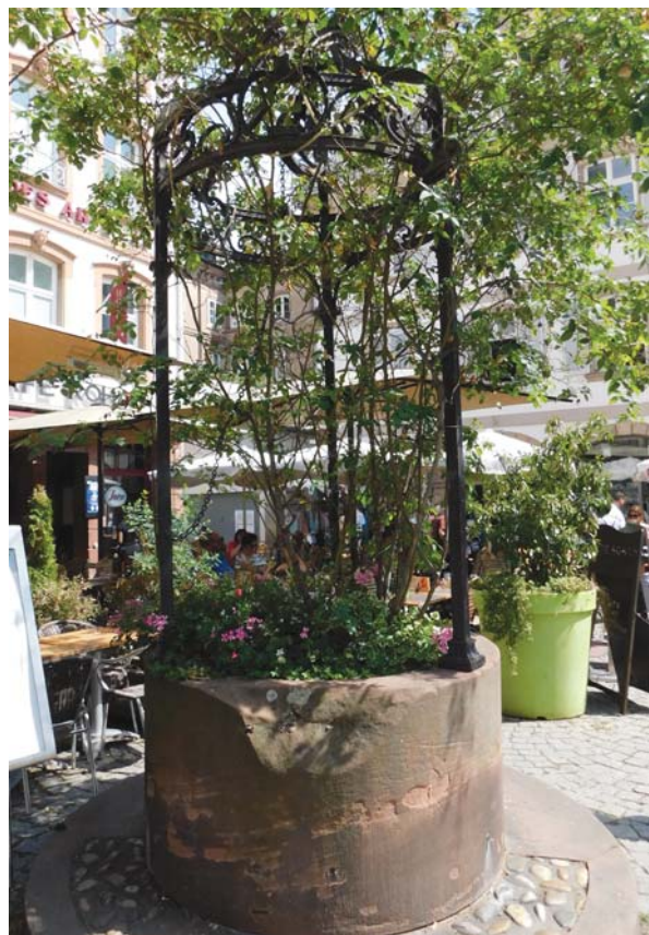
Slika 10: Place du Marché-aux-Cochons-de-Lait, bunar iz XVIII. st.