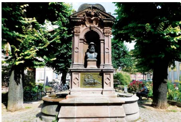
Slika 3: Monument aux Zurichois, Ciriška fontana