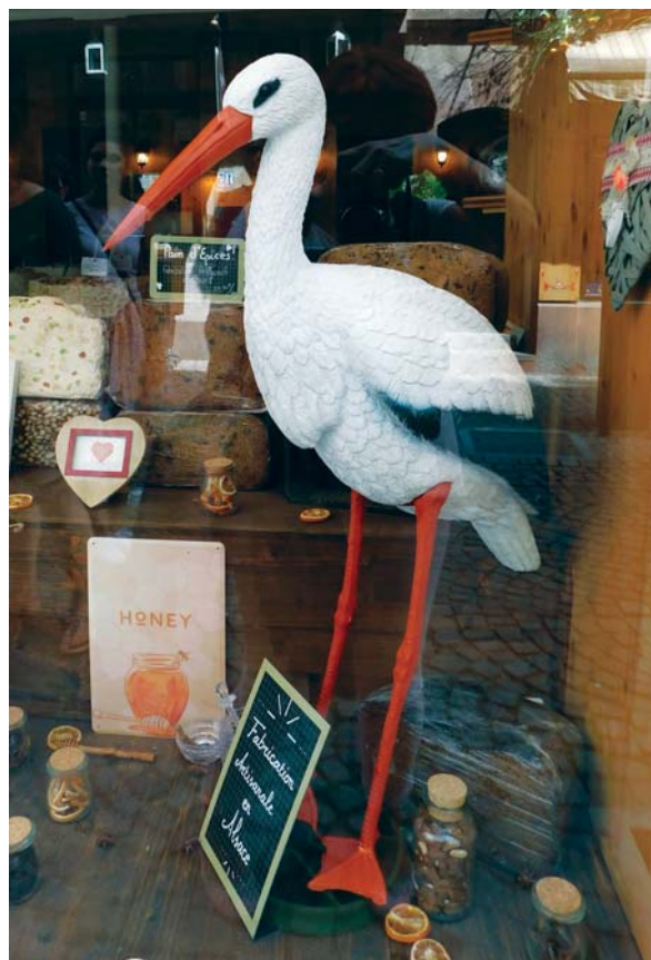
Slika 16: Prema predaji rode u Alzasu donose djecu iz bunara koji je, prema predaji, spojen s velikim podzemnim jezerom ispod katedrale