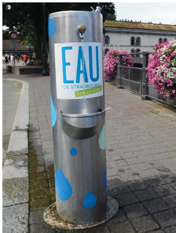
Slika 14: Moderni javni gradski zdenac s pitkom vodom

Janus je rimski bog početka svih stvari, zaštitnik vrata i dveri. Rimljani su ga prikazivali s dva lica okrenuta na suprotne strane. Voda istječe na oba kraja akvedukta u pripadajući bazen. Na sjevernoj strani nalazi se natpis na latinskom ( Argentoratum MM ), a s južne na francuskom jeziku ( Strasbourg 2000 ). Poznat je kao Janusov akvedukt, Janusova fontana ili Rođenje civilizacije. Simbolizira dva lica Strasbourga, antičko i suvremeno, jedno koje gleda u prošlost, a drugo u budućnost, ali je istovremeno i simbol povijesti Alzasa između Francuske i Njemačke, koje su dugo ratovala za tu regiju.