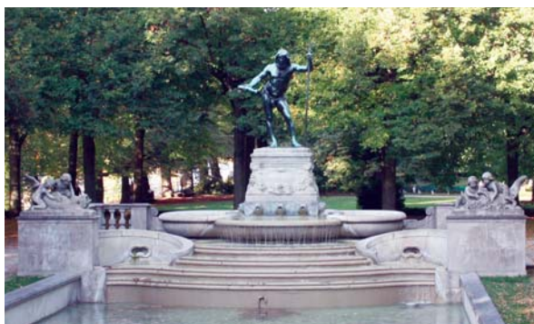
Slika 6: Fontana Vater Rhein nekada u Strasbourg, a danas u Münchenu

Stari dio grada na otočiću Grande Île upisan je na UNESCO-vu listu svjetske kulturne baštine (1988.).