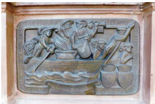
Slika 4: Hirsebreifahrt, detalj fontane s prikazom vožnje prosene kaše iz Züricha u Strasbourg