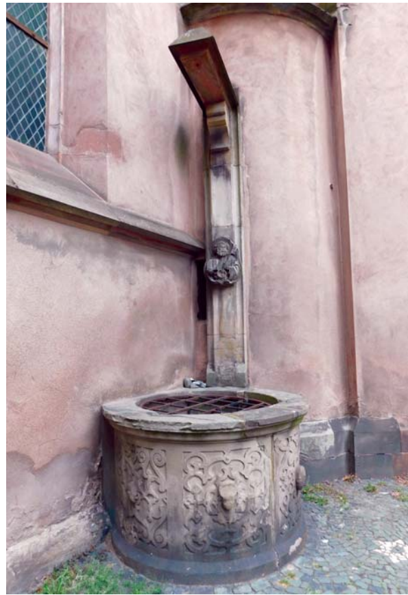
Slika 9: Bunar uz crkvu St-Pierre-le-Jeune