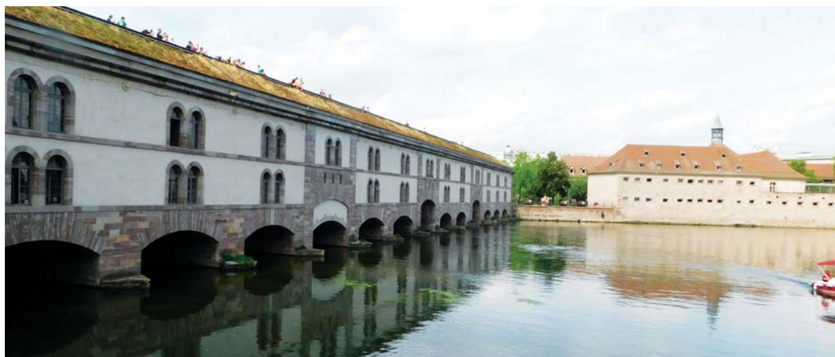
Slika 2: Barrage Vauban, most i brana iz XVII. st.

Danas je Strasbourg moderan europski grad te sjedište brojnih europskih institucija.