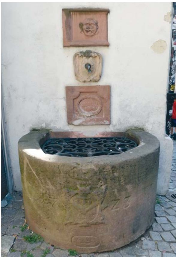
Slika 8: Rue du Maroquin, bunar iz 1723. godine