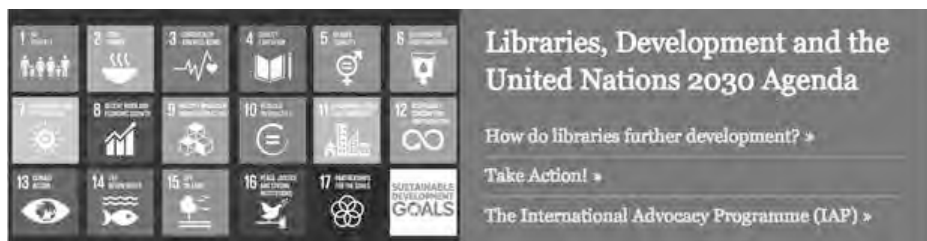
Slika 1. Libraries, Development and the United Nations 2030 Agenda

U kontekstu međunarodnog programa zagovaranja podrazumijevaju se akcije kojima pojedinci ili organizacije pokušavaju utjecati na donošenje odluka na lokalnoj, regionalnoj, državnoj, nacionalnoj i međunarodnoj razini. Takve akcije, odnosno procesi djelovanja pomažu u kreiranju željenih politika ili financiranju raznolikih javnih potreba. Pristup informacijama u Agendi 2030 prepoznat je kao univerzalni 16. cilj održivog razvoja i pretpostavlja „promicanje miroljubivih i inkluzivnih društava za održivi razvoj, osiguravanje pristupa pravdi za sve i izgradnju učinkovitih, odgovornih i uključivih institucija na svim razinama“.