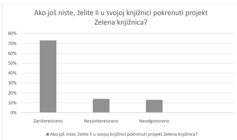
Slika 3. Ako još niste, želite li u svojoj knjižnici pokrenuti projekt Zelena knjižnica?

Na pitanje „Ako još niste, želite li u svojoj knjižnici pokrenuti projekt Zelena knjižnica?“ većina knjižničara odgovorila je da su zainteresirani za sudjelovanje u projektu (73 %), 14 % nije zainteresirano, a 13 % nije odgovorilo na to pitanje (slika 3).