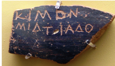
Slika 1. Primjer pločice s imenom Kimona, sina Miltijadovog

kao mehanizam zaštite poretka postajao popularniji: 480-ih pr. n. e. dogodio se prvi val ekpulzija, potom sredinom stoljeća, te posljednji poznati postupak, onaj protiv Hiperbola, nakon kojeg nema zapisa o daljnjim izgonima.