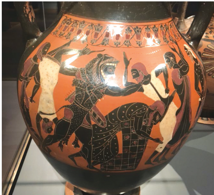
Slika 5. Atenska amfora s prikazom Herakla kako navaljuje na Busirida