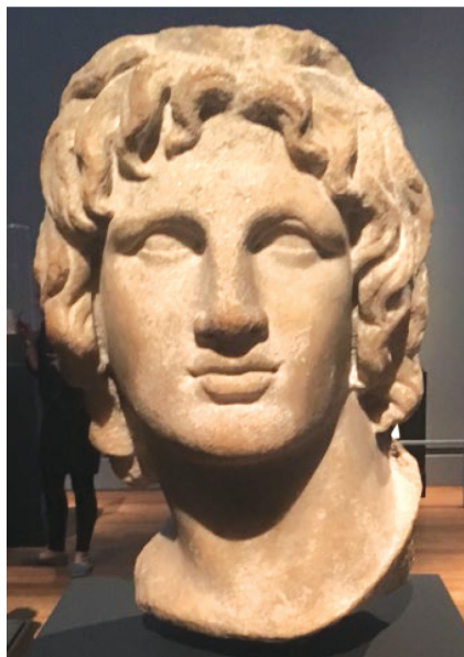
Slika 6. Glava Aleksandra Makedonskog