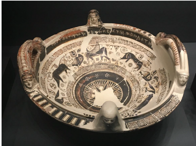
Slika 4. Posuda iz Naukratije s Roikovom posvetom Afroditi

Art Museum) i hidrija iz Caere u Etruriji (Kunsthistorisches Museum Wien), prikazuju kako Heraklo presuđuje faraonu Busiridu i njegovim slugama. Iz Ferekidovih, Panijazidovih, Euripidovih i Herodotovih odlomaka, znamo da je mit bio vrlo popularan u 5. st. pr. Kr., ali ga spominju i kasniji antički pisci.