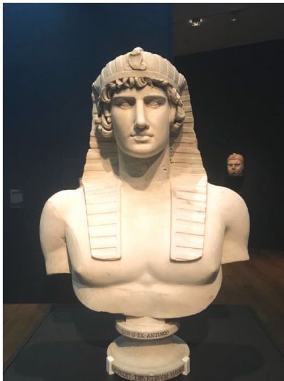
Slika 10. Antinojeva bista iz Hadrijanove vile u Tivoliju

Na sredini posljednje prostorije stoji golemi nilski konj od crvenog mramora za kojeg se smatra da potječe iz Salustijevih vrtova u Rimu (Ny Carlsberg Glyptotek). Kroz prednju nogu provedena je cijev pa se smatra da je kip bio dio fontane. Slijede stele i kipovi koji u egipatskom stilu prikazuju ili spominju rimske careve - primjerice stela cara Tiberija iz Tebe (Allard Pierson Museum, Amsterdam) ili kip cara Domicijana iz Beneventa (Museo del Sannio di Benevento) koji u potpunosti slijedi drevni egipatski kiparski kanon: ruke pripijene uz bokove, lagani iskorak, na glavi faraonski klaft s kobrom itd. Velika mramorna bista Hadrijanova ljubavnika Antinoja (Louvre) zauzima posebno mjesto na izložbi. Mladić se utopio u Nilu oko 130. godine, a nesretni ga je car proglasio bogom. Portret je pravi odraz deifikacije – spoj egipatskog sakralnog inventara i skladne heleniističke skulpturne tradicije. Uz Antinoja izloženo je nekoliko skulptura iz luksuzne Hadrijanove vile u Tivoliju, među njima i dvostruka bista Izide i Apisa od crnog i bijelog mramora koja se čuva u Vatikanskim muzejima. Na kraju izložbe stoji golema granitna glava cara Karakale (University of Pennsylvania Museum of Archaeology and Anthropology, Philadelphia) koji je posjetio Egipat tijekom priprema za rat protiv Parta oko 200. godine. Smatra se je u istom vremenu podignut njegov kolosalni kip. Glavu je otkrio Flinders Petrie 1894. godine u Izidinom hramu u Koptu.