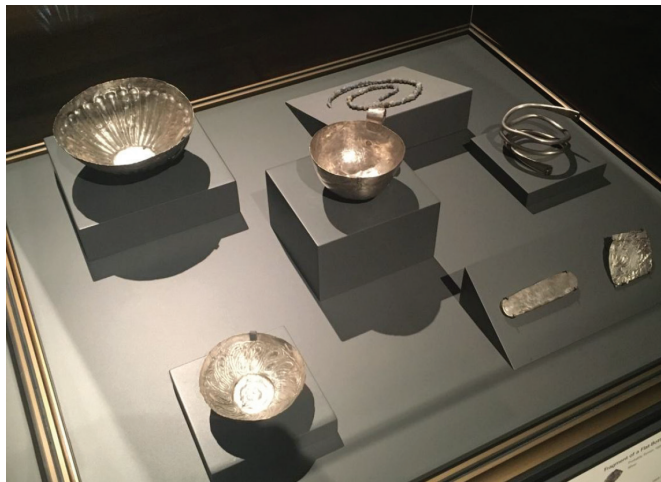
Slika 2. Srebrno blago iz Toda kraj Tebe