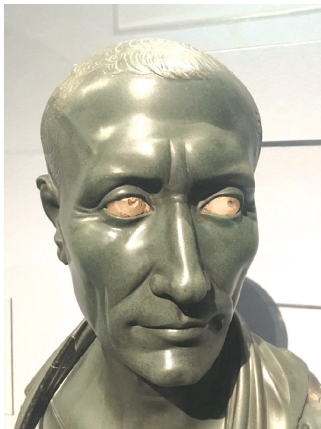
Slika 7. Poprsje Julija Cezara

Slijede predmeti iz razdoblja rimske vlasti nad Egiptom. Reljef Izidine svećenice Aleksandre iz atenske četvrti Kerameik (Εθνικό Αρχαιολογικό Μουσείο, Αθήνα) uvodi posjetitelja u širenje egipatskih kultura Rimskim Carstvom. Četverostruki čvor na prsima jasan je simbol Aleksandrina religijskog opredjeljenja, a natpis na grednjaku edikule iznad kipa odaje njezino grčko podrijetlo. Kasnoantička pločica, rijedak primjer slikanja temperom, prikazuje boga Herona koji je stilski i onomastički vrlo sličan tračkom Heroju (Museum of Art, Rhode Island School of Design, Providence). Mladoliki bradati čovjek odjeven je u rimski oklop i ogrtač, a njegov je kult bio popularan među egipatskim vojnicima. Iz grčkog natpisa znamo da je pločicu zavjetovao neki Panefrimid za dobru sreću.