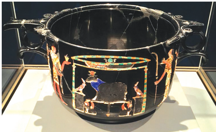
Slika 9. Skif iz vile San Marco u Stabijama