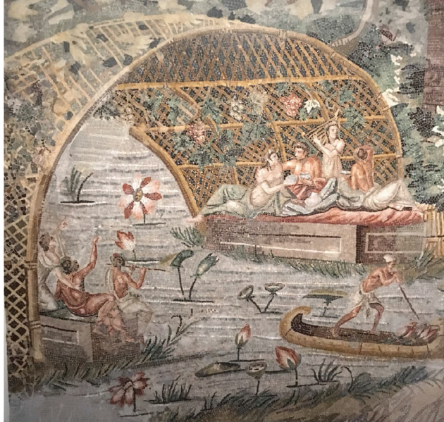
Slika 8. Mozaik s nilskim krajolikom iz Pompeja

glavnoj ulozi, a u gornjem registru stoji natpis na grčkom ΠΙΕ ΖΗΣΕΝ! Ovo je rijetka kombinacija poganske doktrine u likovnom izrazu s frazom koja će postati popularna na kršćanskom religijskom posuđu. Još je upečatljiviji skif od opsidijana iz vile San Marco u Stabijama (Museo Archeologico Nazionale di Napoli). Ukrašen je umetcima od zlata, zelenog jaspisa, lapis lazulija, malahita, karneola te ružičastih i bijelih koralja. Oblik posude je grčko-rimski, a pogrebni motivi su egipatski.