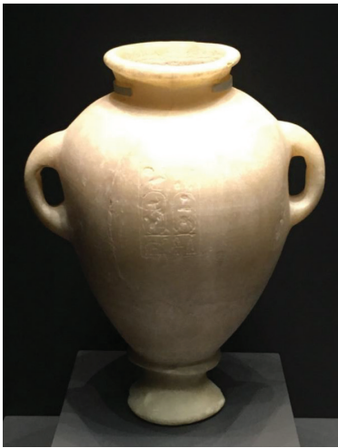
Slika 1. Amfora od alabastera iz grobnice Katsambas na Kreti s kartušom Tutmozisa III. 1

stoji kruna minojsko-egipatskih kontakata – slavno blago iz hrama boga Montua u Todu nedaleko od Tebe (Louvre). Vjeruje se da srebrne posude oponašaju minojske modele koje je faraon Amenemhet II. u 18. st. pr. Kr. dao posvetiti bogu rata kao simbolični dar za podjarmljivanje neprijateljskih naroda. Nasuprotni zid krasi znameniti Londonski medicinski papirus iz 18. dinastije (The British Museum) na kojem su zapisane magične formule za ozdravljenje. Za dvije vradžbine protiv kožnih bolesti piše da potječu iz jezika naroda Keftiu, što bi trebao biti egipatski oblik etnonima brončanodobnih Krećana.