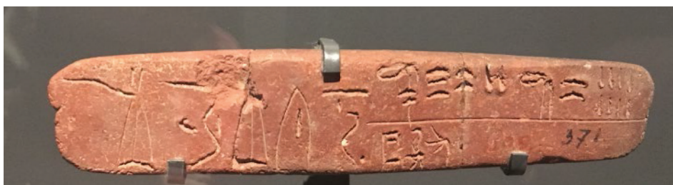
Slika 3. Pločica iz Knosa s imenom ai-ku-pi-ti-jo na linearnom B pismu

Slijede predmeti iz mikenskog razdoblja. Primjer kontakta s Egiptom su dragocjeni predmeti iz Kolone na Eginu (The British Museum). Zlatni nakit pokazuje vješt rad egejskih radionica čije su majstore inspirirali egipatski, sirijsko-levantski i anatolijski stil. Pokraj njih je pločica iz Knosa (Αρχαιολογικό Μουσείο Ηρακλείου) na kojoj je linearnim B pismom urezano ime ai-ku-pi-ti-jo , odnosno Egipat. Više tipičnih mikenskih stremenastih posuda ( stirrup jars ) koje su pronađene duž Nila od delte pa sve do Nubije (Fitzwilliam Museum, University of Cambridge; Petrie Museum of Egyptian Archaeology, University College London), svjedoči da je razmjena između egejskog i egipatskog kulturnog kruga bila aktivna i tijekom kasnog brončanog doba.