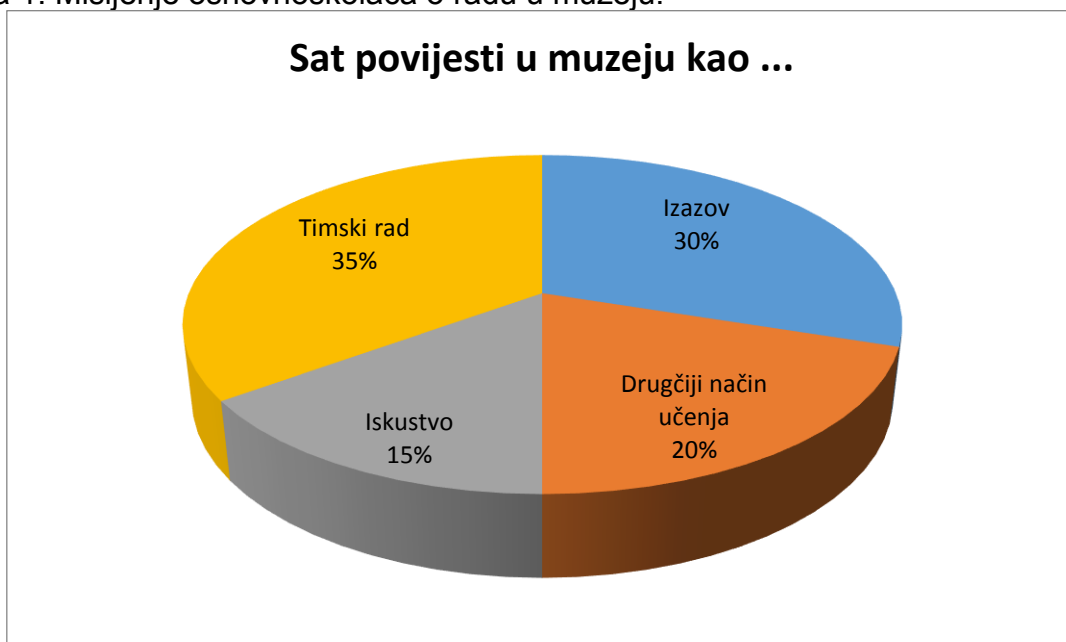
Slika 2: Zadovoljstvo učenika.