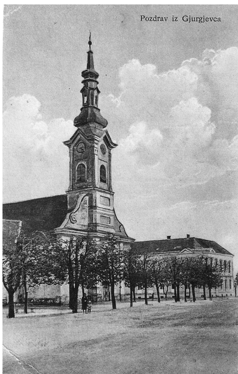
Sl. 2. Razglednica Đurđevca s motivom župne crkve.

Istodobno je župa napredovala u duhovnom i intelektualnom pogledu jer je u to vrijeme nekoliko Đurđevčana zaređeno za svećenike (sedmorica njih rođenih između 1801. i 1806. godine) od kojih su neki svoju prvu svetu misu prikazali u novoj župnoj crkvi. U selima koja su bila župne filijale upravo tada otvarane su škole u suradnji s krajiškim vlastima s čijim je predstavnicima kao mjesnom elitom župnik odlično surađivao. Milinković je 1830. godine dao preporuke zagrebačkom biskupu Aleksandru Alagoviću za tadašnjeg đaka Ivana Trnskog (1819. – 1910.) porijeklom iz Novigrada Podravskog kojeg je biskup doista primio u biskupijski orfanotrofij. 9