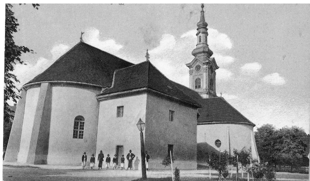
Sl. 1. Župna crkva svetog Jurja u Đurđevcu koju je 1824. godine sagradio župnik Franjo Milinković.

želio sagraditi novu. Kako u tome naumu nije uspio, dao je proširiti i popraviti staru crkvu. Takva je crkva dočekala i župnika Milinkovića te se očito dalje raspadala čemu je pridonijelo veliko nevrijeme koje je zahvatilo Podravinu u lipnju 1821. godine te nanijelo štetu crkvi i drugim građevinama u Đurđevcu. Iste je godine u Đurđevcu boravio zagrebački biskup Maksimilijan Vrhovac s velikom pratnjom (među njima i pomoćni biskup Žalec). Obišavši župni dvor i crkvu nedavno pogođene nevremenom, biskup Vrhovac potaknuo je rušenje stare i gradnju nove župne crkve. Đurđevčani na to očito nisu bili spremni te je župna crkva u takvom stanju dočekala posjet budućeg zagrebačkog biskupa Aleksandra Alagovića 1822. i đakovačkog biskupa Karla Mirka Rafaja 1823. godine. 8