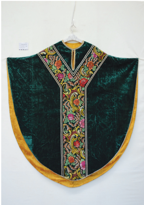
Sl. 7. Misnica „boromejka“ 7 – prednja i stražnja strana (foto: E. Vučković, 2016., arhiva HRZ ROL-a)