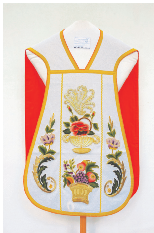
Sl. 4. Misnica 4 – prednja i stražnja strana