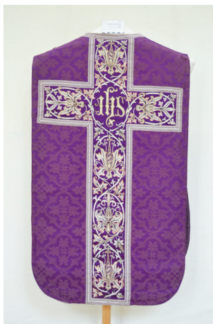
Sl. 3. Misnica 3 – prednja i stražnja strana