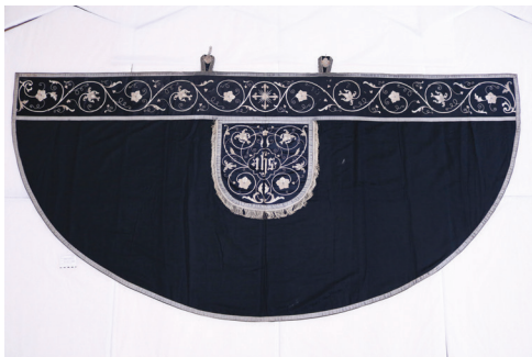
Sl. 9. Plašt 1 – prednja strana