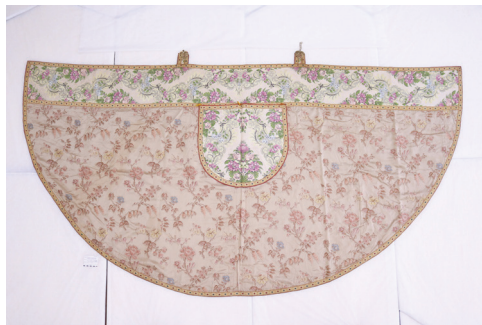
Sl. 10. Plašt 2 – prednja strana