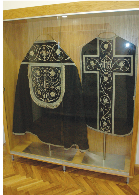
Sl. 13. Crni komplet liturgijskog ruha u vitrini stalnog postava samostana

Crkveni tekstil podvrgnut je dezinfekciji u komori Restauratorskog odjela Hrvatskog restauratorskog zavoda u Ludbregu anoksi-metodom uz primjenu inertnog plina dušika kojemu su predmeti bili izloženi deset tjedana, koliko je potrebno da se suzbiju svi razvojni stadiji drvnih i tekstilnih nametnika te da