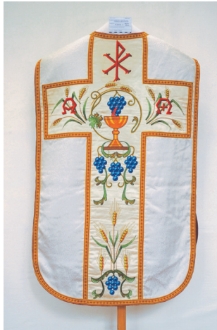
Sl. 1. Misnica 1 – prednja i stražnja strana