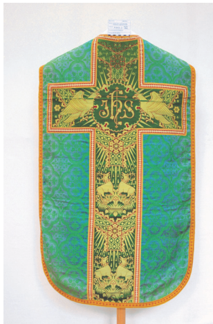
Sl. 2. Misnica 2 – prednja i stražnja strana