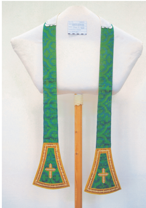
Sl. 8. Stola 8 – prednja strana