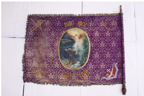
Sl. 11. Crkvena zastava, strana 1 i 2