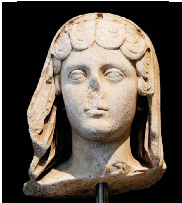
Slika 3 Faustina Mlađa, Metropolitan Museum New York

Odjeća je također vidljiva, a sastoji se od tunike i stole koji prelazi preko ženina lijevog ramena. Stola je obuhvaćala donji dio tijela, ali to, dakako, nije vidljivo, ali se