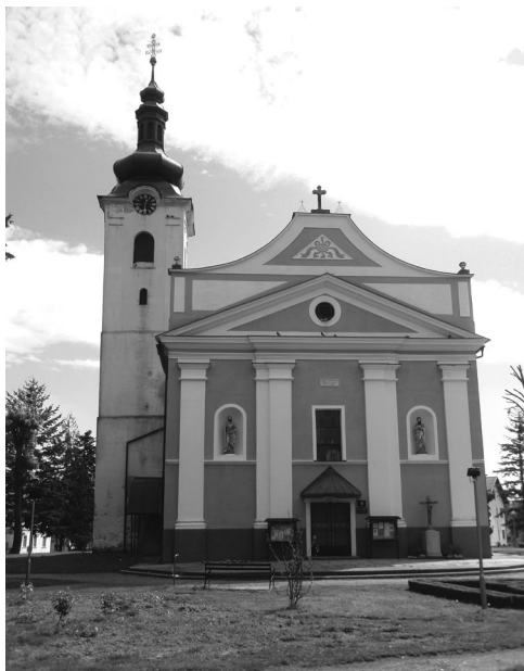
Sl. 1. Župna crkva sv. Martina u Virju.