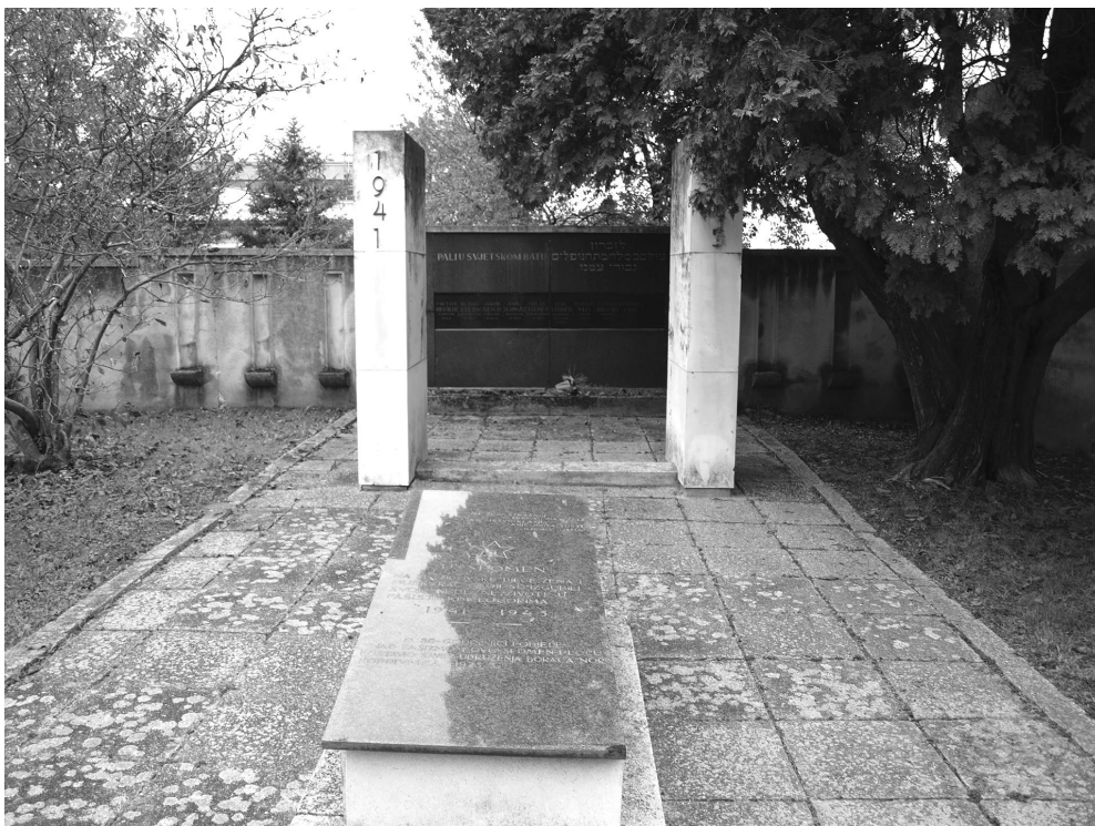
Sl. 1. Recentno stanje Spomenika stradalim Židovima u Prvom svjetskom ratu u Koprivnici.

stradalima u Prvom svjetskom ratu ipak je vezana uz podizanje Spomenika neznanom junaku na Avali, kao i podizanje spomenika na glavnom zagrebačkom groblju Mirogoj. Prvi spomenik nastao je u razdoblju između 1934. i 1938. godine, gradio ga je Ivan Meštrović i trebao je biti posvećen u spomen svim žrtvama Prvog svjetskog rata, ali godine upisane u spomenik (1912. – 1918.) pokazuju da spomenik nije posvećen samo žrtvama Prvog svjetskog rata nego i žrtvama Balkanskih ratova. 17 Drugi spomenik, onaj zagrebački, rad je nekoliko autora. Autor kosturnice je zagrebački arhitekt Ante Grgić, a spomenik Pieta rezultat je zajedničkog tandema Vanje Radauša i Joze Turkalja. Spomenik je ustvari kosturnica, a izgradnja je pokrenuta 1932. godine, dovršena 1934. godine, a spomenik nad kosturnicom je podignut tek u ožujku 1940. godine kada je grobnica svečano predstavljena javnosti. U kosturnici se nalaze posmrtni ostatci oko 3.300 vojnika različite nacionalne, vjerske i vojne pripadnosti. 18