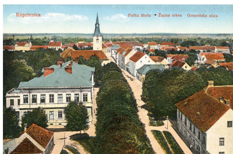
Sl. 2. Zgrada pučke škole sagrađena 1892. godine, srušena u eksploziji 1945. godine, vidi se crkva sv. Nikole i Gospodska ulica, danas ulica Đure Estera

Od 1864. godine nastava u osnovnim školama vršila se isključivo na hrvatskom jeziku, a počela su se objavljivati i godišnja školska izvješća. Na temelju ovih izvješća možemo pratiti rad Osnovne i Šegrtske škole u Koprivnici, a u ovom radu obuhvaćeno je samo razdoblje