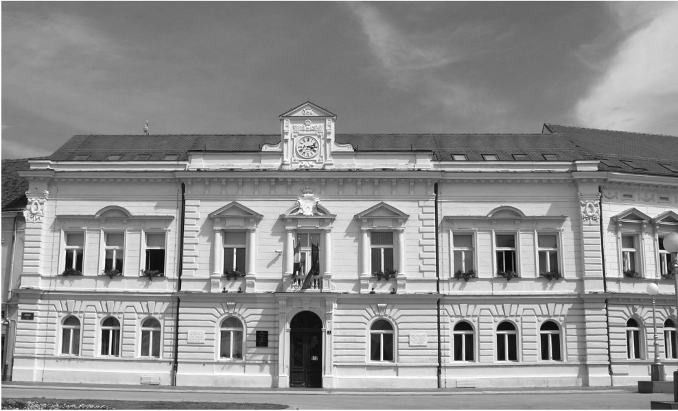
Sl. 4. Zgrada koprivničke Pučke škole sagrađena 1857. godine, danas Gradsko vijećnica

ti su se za Uskrs obvezno morali ispovjediti i pričestiti. Ocjene su bile za pojedine predmete iskazivane slovima: nd – nedovoljan, dv – dovoljan, db – dobar i vd – vrlo dobar. Ocjenjivanje je bilo vrlo strogo i u pravilu je šegrt tijekom svog naukovanja ponavljao barem jedan razred, a vrlo česti i dva. I disciplinske mjere su bile vrlo stroge i dijelile su se, ne samo za neadekvatno ponašanje, već i lijenost pa su često bile razlog izbacivanja iz škole. U Glavnom imeniku postojala je i rubrika Opaska – kada je 1890./91. godine jedan učenik bio isključen iz škole, bilo je upisano Zaključkom sjednice učiteljskog zbora isključen poradi posvemašnje moralne pokvarenosti, jer nije bilo nade da se isti popravi i pošto je bio sablazan cijelom zavodu.