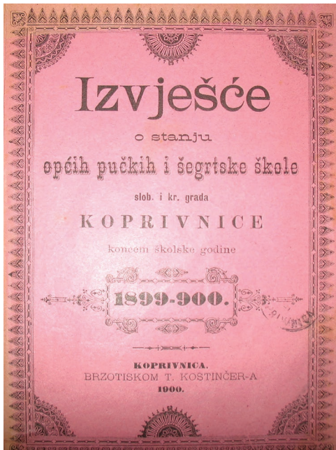
Sl. 1. Naslovna stranica Godišnjeg izvješća općih pučkih škola slob. i kralj. grada Koprivnice (snimila: R. Medvarić-Bračko., 2017.)

uspjehom, dakle, koji su bili gotovo analfabeti, a u drugi dio su primani šegrta koji su svršili glavnu učionu s dobrim uspjehom pa je i njihova pouka bila bogatija i svestranija te to potvrđuje gornji navod.