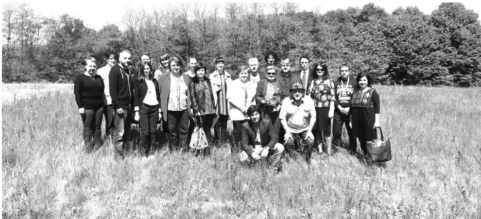
Sl. 9. Sudionici VII. Dana Ivana viteza Trnskog u Novigradu.