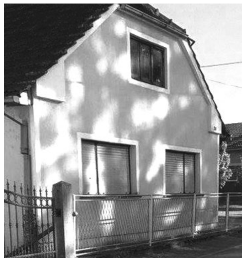
Sl. 7. i 8. Predaja kaže da je na ovom mjestu, u domu Mladenovog i Velimirovog oca, nekada često boravio Ivan vitez Trnski.

stvo povisilo učiteljem plaće, ako ne bog zna za koliko, vidi se, da je uviđajući i uvažavajući zasluge učiteljah, voljno dati po mogućnosti nagradu onim, kojim povjeravaju svoja mila čeda. 20