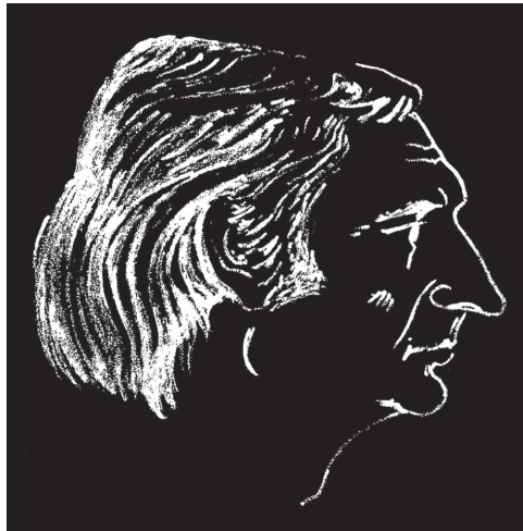
Sl. 5. Tomislav Boršo, Autoportret [BORŠO, Tomislav; FELETAR Dragutin: Svakodnevne karikature . Koprivnica: Nakladna kuća Dr. Feletar, 2000.]

karikatura u Bajkačima , važno je napomenuti da su neke od njih verzije već prije objavljenih karikatura. Najviše ih je ranije objavljeno u Koprivicama , i to često bez potpisa, pa nam Bajkači mogu poslužiti kao potvrda autorstva. Za neke karikature ipak možemo pretpostaviti da su nastale upravo prigodno uz tekstove jer prate njihov sadržaj. Da Boršine karikature u knjizi nisu samo puka nadopuna tekstovima, svjedoči činjenica da je njegovo ime stavljeno na naslovnicu i da se ravnopravno navodi kao autor. Dodatna je potvrda Boršino sudjelovanje s Bajkačima na festivalima humora u Knokke-Heistu u Belgiji i Amstelveenu u Nizozemskoj. 19