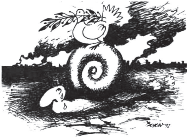
Karikatura: Tomislav BORŠO

Sl. 4. Karikatura Puž i golubica [Glas Podravine, XLVII, 32 (14. 8. 1992.), 12.]