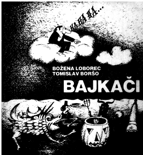
Sl. 1. Naslovnica Bajkača [LOBOREC, Božena; BORŠO, Tomislav: Bajkači . Koprivnica: Centar za kulturu, Muzej grada Koprivnice, 1984.]

logorskom planinaru, Narodnoj armiji, Poletu, Večernjem listu, Vjesniku... 3 Boršo je smatrao da je karikaturi prvenstveno mjesto u novinama, da tu ima svoj pravi smisao, svoje opravdanje 4 i tek je povremeno izlagao na skupnim izložbama.