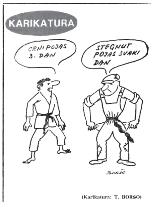
Sl. 3. Karikatura Stegnut pojas [ Glas Podravine , XLIV, 14 (14. 4. 1989.), 12.]