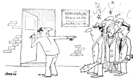
– Šefe, neki građani došli su da nam čestitaju Novu godinu!