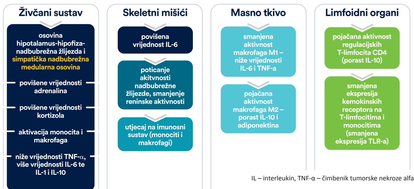
Slika 1. Osnovni fiziološki mehanizmi u razumijevanju protektivnih učinaka vježbanja

osobito neutrofila, makrofaga i monocita, potiče se sistemski odgovor uz otpuštanje proupalnih citokina: interleukina 6 (IL-6), čimbenika tumorske nekroze alfa (TNF-alfa) i interleukina 1-beta (IL-1-beta). Navedeni citokini na kraju ostvaruju interakcije s različitim organskim sustavima (drugi skeletni mišići, jetra, hipotalamus i srce), što dovodi do smanjenja fizičkih mogućnosti i ostalih neželjenih učinaka (5).