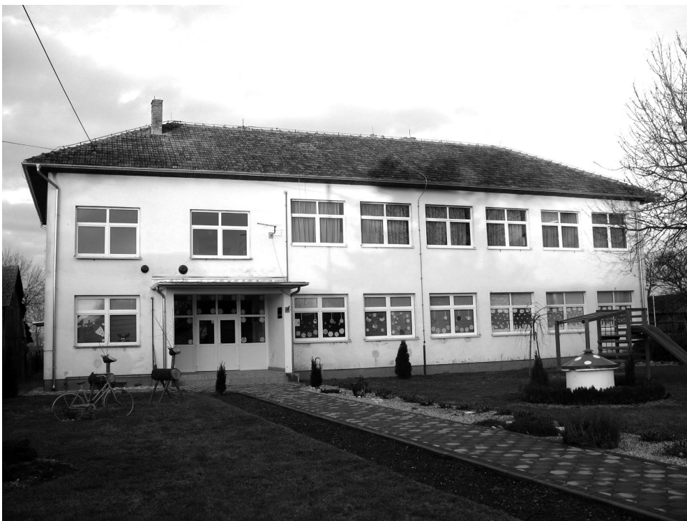
Sl. 3. Nova Osnovna škola Gotalovo, s društvenim prostorijama i učiteljskim stanovima – završena 1962. godine.

idući godinu. U ožujku 1957. godine dogovoreno je da se utvrdi stanje hrastovih debala na pilani u Goli, namijenjenih za gradnju škole, dok će se drvo u školskom dvorištu dati istesati da ne propadne. Orahovo posječeno deblo će se ispiliti za mosnice i iskoristiti za gradnju. Na sjednici u studenom 1957. godine odlučeno je da i članovi Općinskog odbora porade na pitanju gradnje škole. Iduća sjednica bila je posvećena iznajmljivanju prostora za školsku kuhinju. Kao zadnja točka sastanka, krajem 1957. godine, pročitano je naređenje kotarske sanitarne inspekcije o neophodnom otklanjanju nedostataka u školskoj zgradi. Posljednji nalaz sanitarne inspekcije je od 31. lipnja 1957. godine. 21