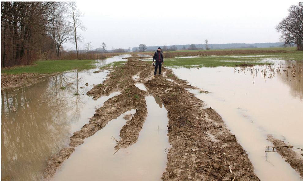
Sl. 1. Teški vremenski uvjeti tijekom terenskog pregleda.

mak tamnosmeđe do tamnosive boje. Oba su izrađena od pročišćene gline. Na temelju ranije prikupljenog materijala, ovaj se materijal može pripisati brončanom dobu.