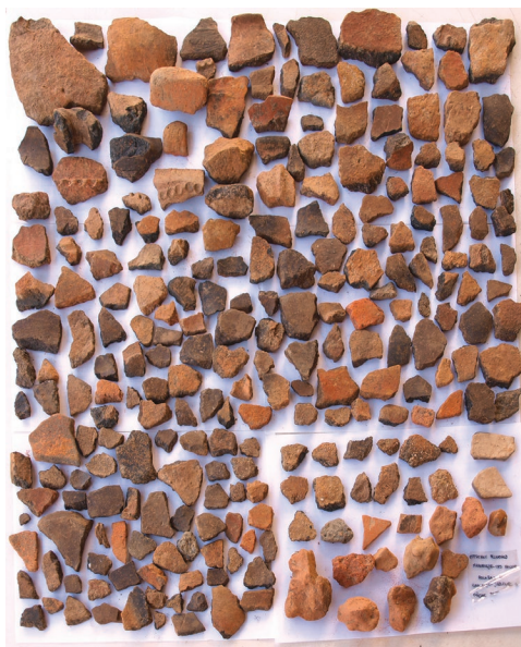
Sl. 4. Materijal s lokaliteta Imbriovec – Jablanec 4.