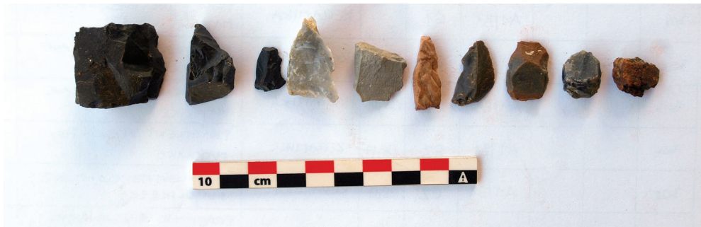
Sl. 5. Materijal s lokaliteta Novigrad Podravski – Slivice (snimio: I. Valent).

nja. Sjeverni se dio lokaliteta nalazi u manjoj potolini nakon koje se prema jugu penje prema blagom uzvišenju te zatim prelazi u ravničarski prostor koji se nalazi na 120 metara n. v. Na lokalitetu su prepoznata naselja iz kasnog brončanog i starijeg željeznog doba te ranog srednjeg vijeka. 6