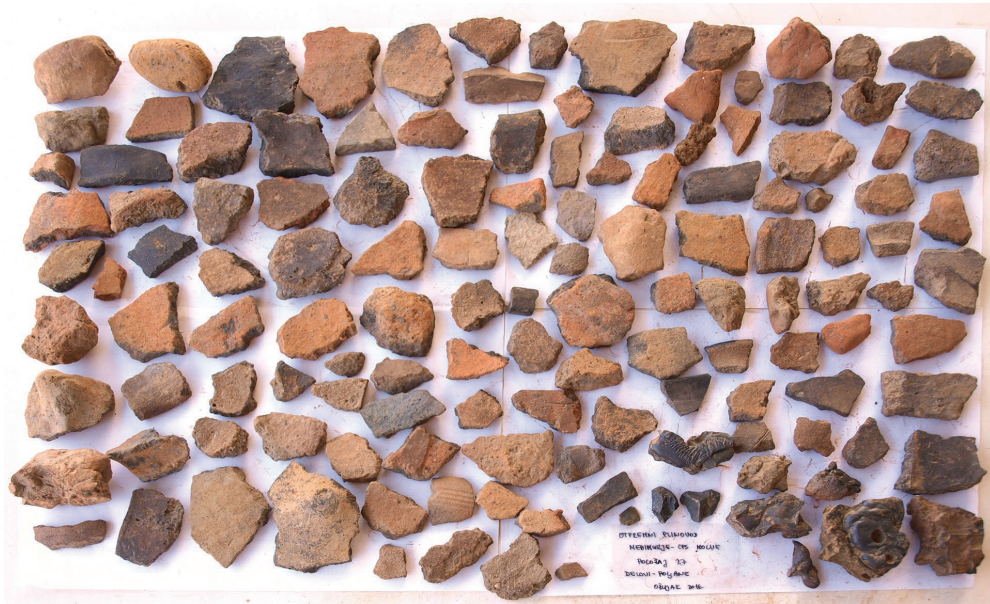
Sl. 3. Materijal s lokaliteta Delovi – Poljane.