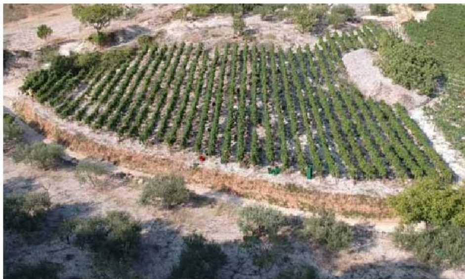
Slika 1. Vinograd u općini Postira/ Picture 1. Vineyard in Postira Municipality