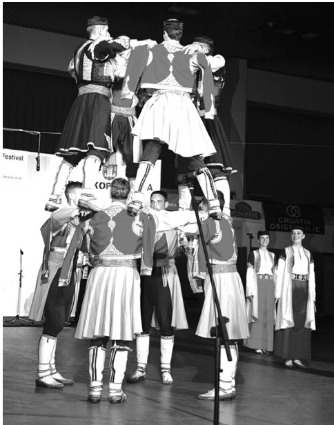
Sl. 2. KUD Njogoš iz Cetinja, Crna Gora, 2007. godina.