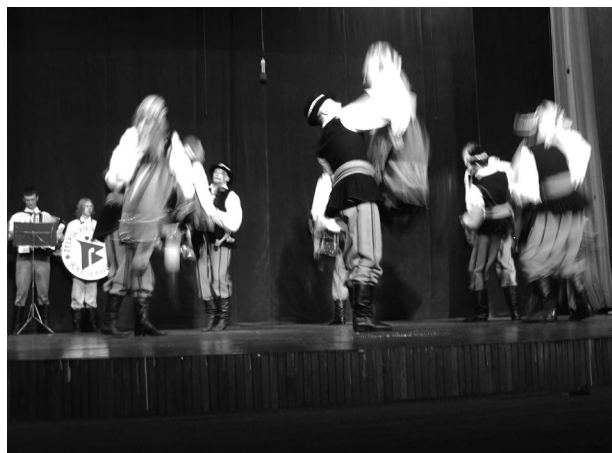
Sl. 3. Gosti iz Boleslawieca iz Poljske, 2007. godina.

Malo-pomalo i stiglo se do petog izdanja festivala, koji je održan 21. – 24. srpnja 2011. godine u Koprivnici u organizaciji KUD-a Koprivnica i TZ-a Koprivničko-križevačke županije, pod pokroviteljstvom Koprivničko-križevačke županije i Grada Koprivnice. Treba naglasiti kako je i GU HTZ-a prepoznao vrijednost ovog festivala i financijski podržao (kao i prethodne dvije godine) održavanje ove manifestacije. Prva festivalska večer održana je 21. srpnja 2011. godine u Domu za starije i nemoćne osobe u Koprivnici, i to je postala tradicija koja traje i danas. Dvije festivalske večeri u prepunoj dvorani Doma mladih u Koprivnici (22. i 23. srpnja) oduševile su publiku atraktivnim nastupima naših gostiju: FA Radi (Aizkraukle, Latvija); Zespół Pieśni i Tańca Pomorze (Chelmno, Poljska); FS Toma...Toma (Montefalcone nel Sannio, Italija); FA Semen (Topojë, Fier, Albanija); Skupina polifonike, Mallakastër (Fier, Albanija); FS Groblje (Domžale, Slovenija) te domaćini KUD Koprivnica . Vrijedno je istaknuti suradnju s Međunarodnom