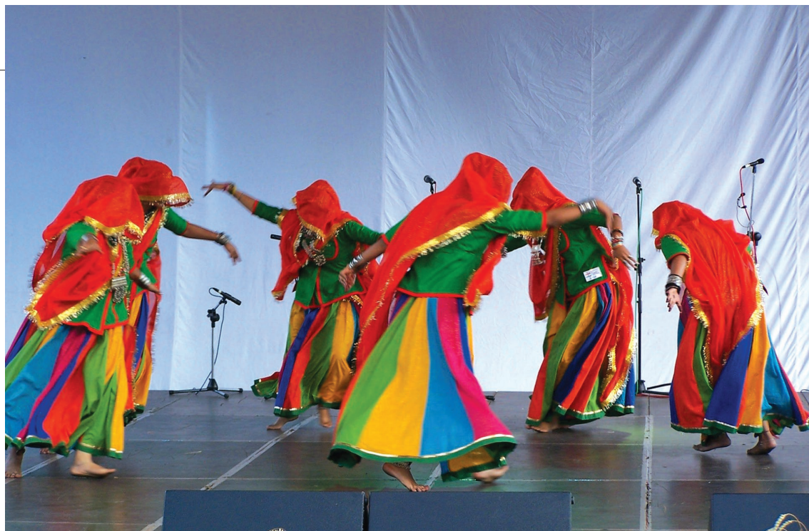
Sl. 4. Gosti iz Indije, 2009. godina.

privničko-križevačke županije u suorganizaciji s TZ-om Područja đurđevačke Podravine, FA-om Koprivnica i KUD-om Petar Preradović iz Đurđevca. Uz pokroviteljstvo Koprivničko-križevačke županije te uz partnerstvo i potporu glavnog sponzora festivala – hotela Picok iz Đurđevca, festival je održan 11. – 14. srpnja 2013. godine. Od ove godine HTZ financijski više ne pomaže festival. Prva festivalska večer održana je u petak 12. srpnja u Domu kulture u Đurđevcu. Na koncertu u subotu 13. srpnja u Koprivnici nazočio je i g. Pëllumb Qazimi, izvanredni i opunomoćeni veleposlanik Republike Albanije u Republici Hrvatskoj. U nedjelju je uslijedio nastup u Domu za starije i nemoćne osobe u Koprivnici. Te su godine nastupili ansambli Folklorna grupa Bilbili (Vlorë, Albanija); folklorni ansambl Kitka (Istibanja, Makedonija); Brauchtumsgruppe Salzburg West (Salzburg, Austrija); Folklorna grupa Agidigbo (Nigerija); Varaždinski folklorni ansambl (Varaždin) i HKGD Dunav (Vukovar, Hrvatska) te suorganizatori i domaćini: KUD Petar Preradović u Đurđevcu i FA Koprivnica u Koprivnici. Svi su, bez iznimke, svojim nastupima oduševili publiku u ispunjenim dvoranama. U dva dana imali smo prilike vidjeti temperament mladih Albanaca, izvornost i sceničnost Makedonaca, afrički ritam Nigerijaca koji su u obje dvorane