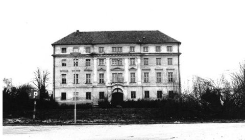
Sl. 4. Izgled dvorca Batthyany-Strattmann nakon rata, razglednica oko 1950. godine.

projekt. Osim rekreacije, perivoj bi mogao poslužiti i kao pozornica na otvorenom za neke od ludbreških manifestacija, poput Čitajmo grofovski, Otvoreni dani Restauratorskog centra ili neke nove. Na gradu i njegovim građanima je da obnovljeni perivoj čuvaju za buduće generacije.