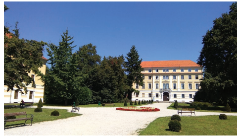
Sl. 2. Perivoj dvorca Batthyany-Strattmann, kolovoz 2016. godine.