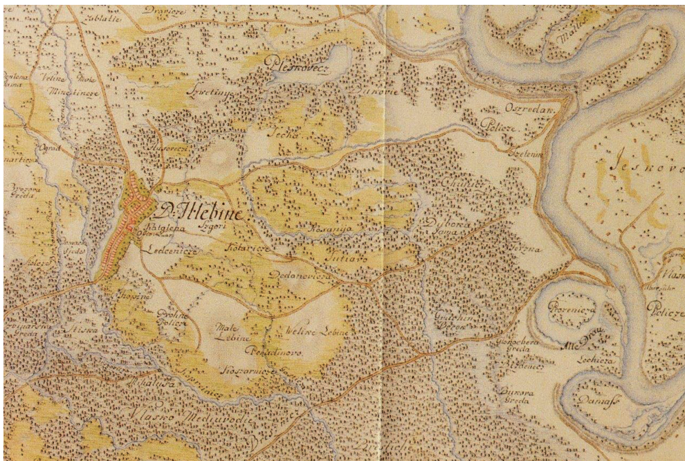
Sl. 1. Hlebine s okolicom na vojnoj karti iz 1782. godine. Bogatstvo šuma, blizina rijeke Drave i njen utjecaj na prostor (M. Z. Ištvan, Molve).

šim nadmorskim visinama pojavile su se šume hrasta lužnjaka koje su tijekom 19. i tijekom prve polovice 20. stoljeća bile intenzivno sječene. 3 Upravo ovakvi tereni koje je postepeno osvajala i divljač bili su interesantni domaćim, ali i vanjskim lovozakupnicima.