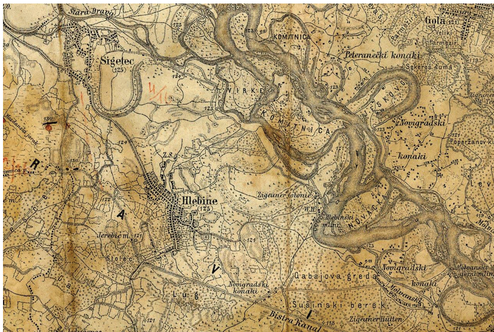
Sl. 2. Hlebine i okolica na vojnoj karti iz 1879. godine s vidljivim bogatstvom šuma, mnogobrojnim meandrima i rukavcima rijeke Drave.