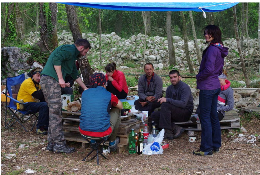
U kampu

pri nošenju vode i opreme. Sve je bilo spremno, osim dobre vremenske prognoze. Sjećajući se članka Gorana Rnjaka o Plješinoj jami i jedne rečenice "Jama je kolektor voda za okolno područje", rasla je zebnja oko izvedbe cijelog istraživanja, jednostavno nije bilo smisla za tako kratki period kampa izlagati se sjevernoj strani surove Sniježnice i najavljenim obilnim padalinama.