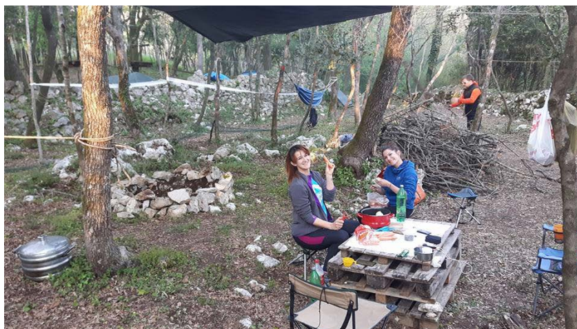
Priprema večere

Jama od 140 m dubine ugodno je iznenadila sve prisutne speleologe svojom veličinom, ljepotom i poslom kojeg nam je zadala u tri dana istraživanja. Posla u jami ima i dalje za članove SO Sniježnica kojima je ova organizacija speleološkog kampa dala određeno iskustvo za buduće speleološke pothvate i istraživanja. U dobroj energiji i zaletu, iste te godine organizirali smo speleološku školu, a odmah iza toga i Skup speleologa Hrvatske. Često se između sebe šalimo i ujedno mislimo ozbiljno da je 2017.g. bila godina speleologije Dubrovačko-neretvanske županije.