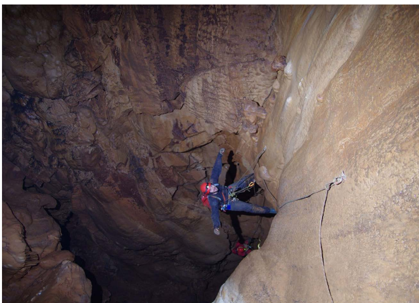
U Grunfovoj vertikali

se u nedjelju i ovaj put pogled koji se pružao iz kampa u konavoskom polju prema vrhu Sniježnice nije bio sa zebnjom, nego s olakšanjem i srećom zbog dobre odluke i postojanja plana B.