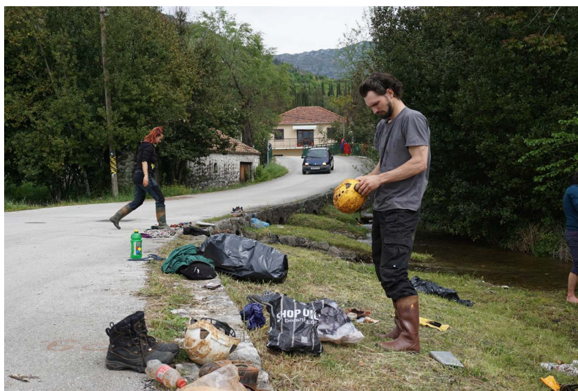
Pranje opreme, rijeka Ljuta, Konavle