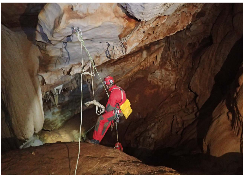
Ulaz u Grunfovu vertikalu