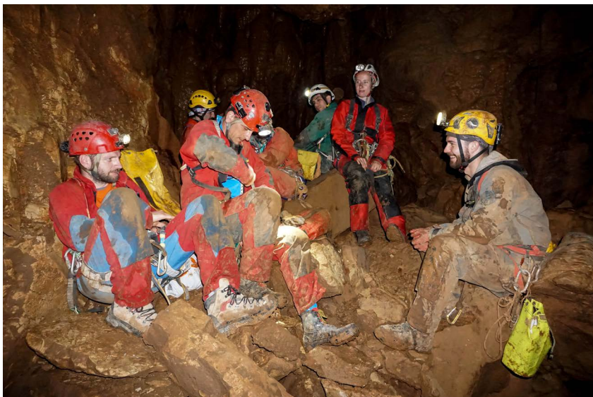
Odmor u dvorani djevojčice sa hranom