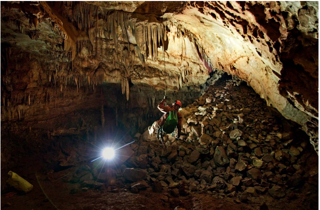
Dvorana Viktorovo pojilo