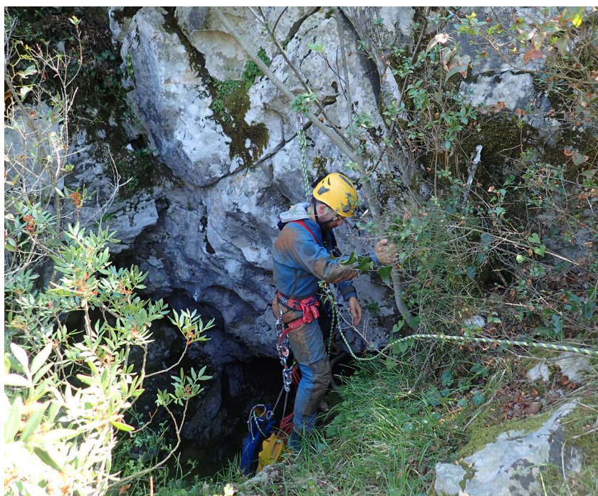
Ulaz u Bezdan

Jama se nalazi na vrlo negostoljubivom terenu, udaljena dva i pol sata hoda od sela Kuna Konavoska od kuda se kreće pješice po karavanskom putu iz doba Austrougarske. Logistika je bila teži dio posla koji smo dogovorili s HGSS stanicom Dubrovnik i planinarima iz HPD Sniježnica koji su bili voljni pomoći