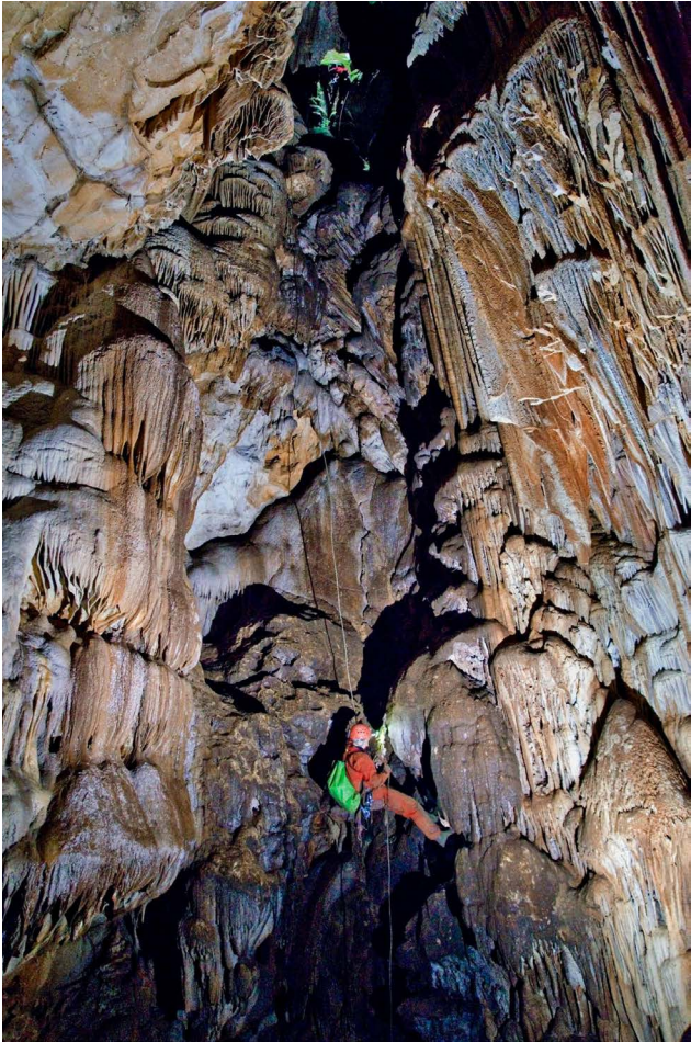
Ulazna vertikala