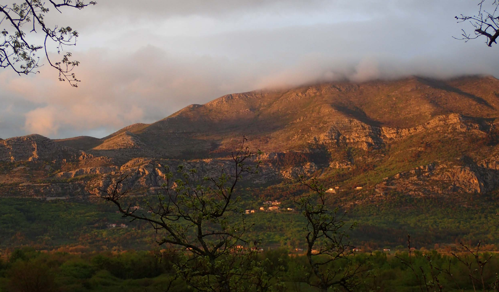
Pogled na Sniježnicu