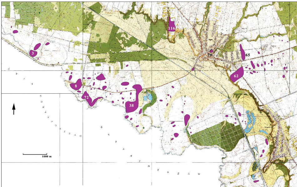
Fig.2. / Sl.2. Medieval sites in the region of Berzenca. / Srednjovjekovni lokaliteti u okolici Berzenca (created by / izradila: C. Zatykó).