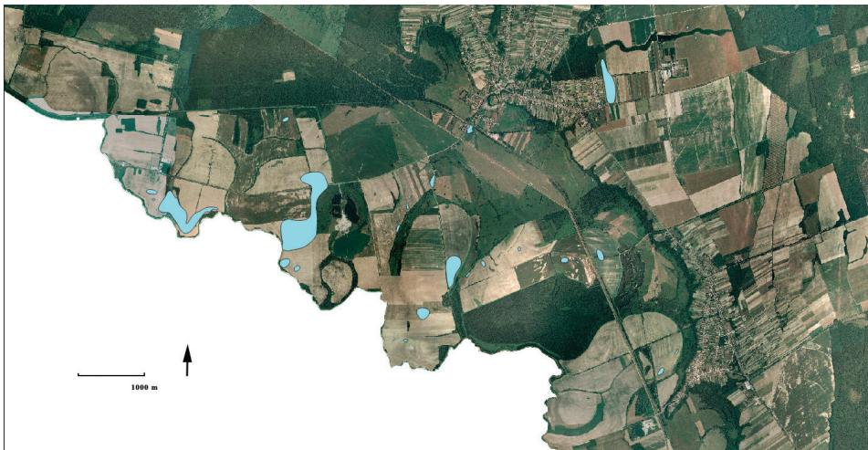
Fig.3. / Sl.3. The ORTO photo of the investigated area with sites related to iron production. / ORTO-fotografija istraženog područja s lokalitetima povezanim uz proizvodnju željeza (created by / izradila: C. Zatykó).

le. Obzirom da naše istraživanje nije pokrilo područje Republike Hrvatske, postoji mogućnost da se četiri lokaliteta nalaze na obje obale rijeke Ždale. Među većim naseljima, lokalitet 3 može se povezati sa srednjovjekovnim Lankócom koji se u pisanim izvorima pojavljuje od 1263. do 1696. godine. Lokalitet posjeduje arheološke nalaze datirane od doba Arpadovića pa do kasnog srednjeg vijeka. Druga tri lokaliteta (8, 72, 38) označavaju dva veća sela i posjeduju nalaze uglavnom od 15. do 17. stoljeća. Prema tome, vjerojatno se mogu povezati s bilo kojim od susjednih sela Szenterzsébet (Sv. Elizabeta / položaj Pelpelara), Lankóc, Kucsila, Szaniszló ili Geszte.