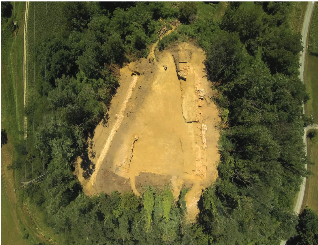
Sl. 7. Pogled iz zraka na istraženi burg Kamengrad u Starigradu tijekom ljeta 2013. godine.

nu kampanju od 46 radna dana u kojima je svakodnevno radilo 10 do 12 ljudi iskopano je oko 2.000 m 3 zemlje, 32 a u cijelosti je istražen plato utvrde (45 x 15-35 m), odnosno prostor gdje je nekad stajala utvrda sa zatvorenim dvorištem. Nažalost, istraženi su tek oni dijelovi koji su ostali očuvani, a ogledaju se u posljednjih nekoliko redova temelja zgrada (najviše do 11 redova, dakle 1 m visine). Uočeno je kako su temelji (i zidovi) pratili prirodnu konfiguraciju terena i trapeziodni oblik pjeskovitog brijega, a prepoznati su gotovo svi vanjski gabariti burga.