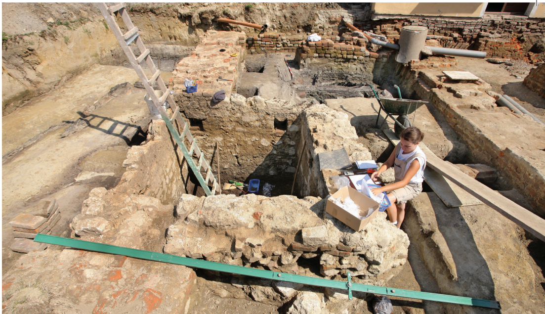
Sl.3. Pogled na istraženu kamenu konstrukciju u dvorištu koprivničkog franjevačkog samostana 2009. godine (snimio: V. Kostjuk).