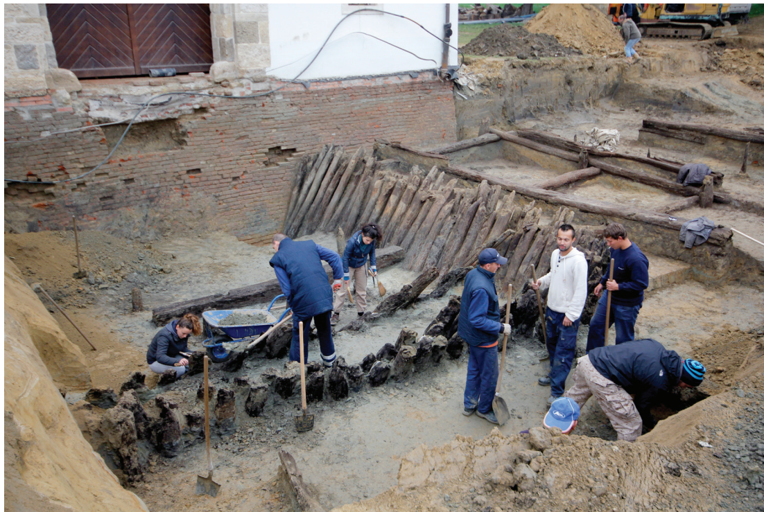
Sl.4. Sonda pred koprivničkim Gradskim vratima tijekom arheoloških iskopavanja u jesen 2012. godine (snimio: I. Brkić).

U iskopavanjima se istražila velika površina (250 m 2 ) i dobiveni su brojni novi podatci o načinu gradnje pojedinih dijelova tvrđave. 16 Iskopavanja su obuhvatila prostor pred Gradskim vratima, usredotočivši se prvenstveno na položaj i izgled drvenog mosta, a drugi zadatak istraživanja bio je prepoznavanje položaja i izgleda uške istovremenog, ili nešto mlađeg, jugoistočnog bastiona te dokumentiranje njenih kota, kosina i tlocrtnog položaja - dakle prikupiti potrebne podatke za projektni zadatak. Prepoznati su položaji prvih nosača pokretnog mosta uz sama vrata te položaj prvih stupova mosta u daljem dijelu,