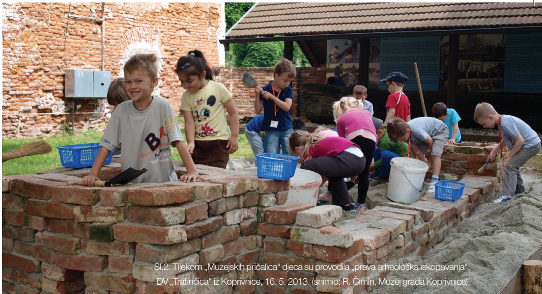
Sl.2. Tijekom „Muzejskih pričalica“ djeca su provodila „prava arheološka iskopavanja“, DV „Trafničica“ iz Koprivnice, 16. 5. 2013.

konstruirati putem istraženih objekata i kvalitetne terenske dokumentacije. Treba reći kako je takav način rekonstrukcije naselja umnogome teži jer iziskuje iznimno detaljnu obradu svakog pojedinom jamskog (ukopanog ili polukopanog) objekta kako bi se mogao steći uvid u izgled naselja u određenom vremenskom razdoblju, za što je potrebno izdvojiti određeno vrijeme.