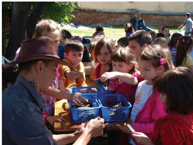
Sl. 1. Djeca iz DV „Zrno“ iz Virja susreću se s arheološkim keramičkim nalazima na radionici „Muzejske pričalice“ povodom Međunarodnog dana muzeja, 14. 5. 2013.

godine). 2 U tri navrata održavane su eksperimentalne arheološke radionice na temu srednjovjekovne talioničke djelatnosti, sa ciljem prikazivanja dobivanja „čistog“ željeza iz prirodne željezne rudače unutar zemljanih peći stožastog oblika: 1. Dan otvorenih vrata povodom Međunarodnog dana muzeja, Muzej grada Koprivnice, 18. 5. 2011. godine; 2. Renesansni festival, prostor gradskih bedema, 2. - 4. 9. 2011. godine) i 3. Renesansni festival, prostor gradskih bedema, 31. 8. - 2. 9. 2012. godine). Cilj sudjelovanja u središnjoj koprivničkoj kulturnoj manifestaciji bio je predočenje rezultata istraživanja lokaliteta Volarski breg sjeverno od Virja gdje su prikupljena saznanja o načinu dobivanja željeza u vrijeme ranog srednjeg vijeka, koji je, usput rečeno, do sada jedini takav istraženi prostor u Hrvatskoj. 3 Posebno zanimljiva bila je radionica održana povodom Međunarodnog dana muzeja pod nazivom „Muzejske pričalice“ (organizator 18. muzejska edukativna akcija bila je Sekcija za muzejsku pedagogiju i kulturnu akciju