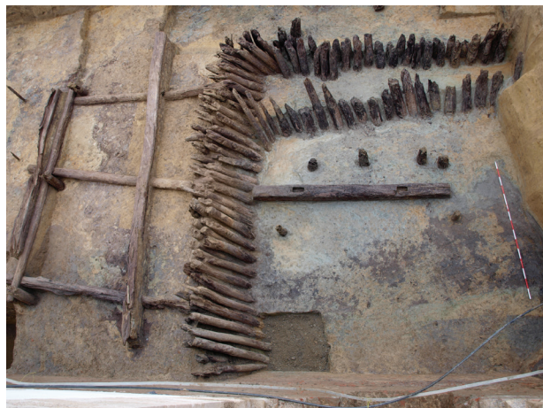
Sl.5. Pogled iz zraka na istražene drvene ostatke pokretnog mosta i mlađeg bastiona koprivničke tvrđave.

je jedino na temelju znanstvenih činjenica i prikupljenih spoznaja moguće rekonstruirati koprivničku prošlost - i nikako drugačije. Riječ je o jedinstvenom obrambenom arhitektonskom sklopu koji još uvijek posjeduje dvije bitne faze razvoja, a ubuduće će biti potrebno odabrati onu koja će zadovoljiti potrebe i zahtjeve struke i javnosti. Hoće li se na kraju prezentirati starija faza tvrđave s pokretnim drvenim mostom ili mlađa faza sa zaklonjenim Gradskim vratima, predbedemom i revelinama - to će nositelj projekta morati odlučiti u skoro vrijeme. Obje su faze legitimne, posebne i zanimljive na svoj način, ali obje donose i određene urbanističke izmjene u tom dijelu grada pa će biti zanimljivo vidjeti za što će se Koprivnica odlučiti.