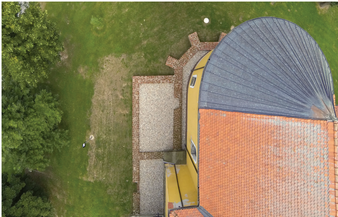
Sl.6. Pogled iz zraka na prezentirani dio kasnogotičke crkve sv. Martina u Virju istraživane od 2009. do 2012. godine.

1484. godinu. 20 Sličnost u izduženom i poligonalnom svetištu pronalazi se diljem SZ Hrvatske (Streza, Donja Vrijeska, Lepoglava, Nova Rača, Glogovnica) te je očito kako je crkva sv. Martina neposredno nakon gradnje bila sjedište jedne velike župe s patronatom nad mnogim okolnim selima. Popratno groblje također odgovara vremenskom okviru nastanka crkve, odnosno korišteno je u kontinuitetu od sredine 15. stoljeća pa sve do kraja 17. stoljeća, a kako su takva groblja u srednjoj Podravini relativno slabo istražena (Starigrad - sv. Emerik, Torčec - Cirkvišće), ono će ubuduće dobiti na