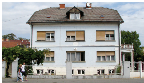
Sl.5. Bazijančeva kuća i ordinacija, a danas Područna škola za djecu s teškoćama u razvoju.

ČEKAONICA - ORDINACIJA - ČEKAONICA. Doktor je bio smiren čovjek, govorio polako i nikad nije povisio glas pogotovo na pacijenta. Za svaku je situaciju našao rješenje. Kako se u čekaonici, ali i ispred kuće znalo satima čekati na red, jednom prilikom veći broj nestrpljivih pacijenata ušao je istodobno u ordinaciju. Jasno da nije mogao raditi pojedinačno sa svakim od njih. Nije od toga napravio neki veliki problem, nego je lijepo zamolio pacijente da mu pomognu iznijeti radni stol u hodnik u čekaoniku. Kada je stol premješten reče: „Eto tako, sada je ovdje ordinacija, a tamo čekaonica.“