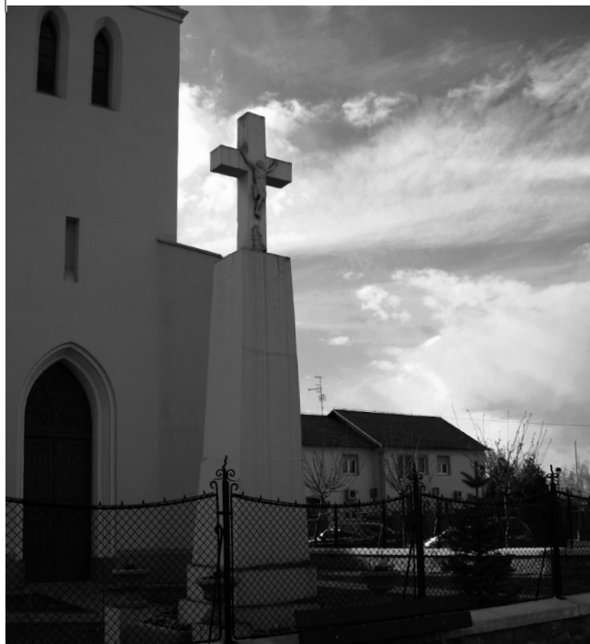
Sl. 6. Spomenik palima u Prvom svjetskom ratu u Kalinovcu iz 1927. godine (snimila: R. Medvarić-Bračko).