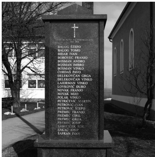
Sl. 5. Spomenik palima u Prvom svjetskom ratu u Gotalovu pokraj crkve podignut 2005. godine.

U blizini crkve u Gotalovu stoji spomenik s natpisom „Spomen palima u I. svjetskom ratu“ podignut 26. lipnja 2005. godine od „općine Gola i mještana Gotalova“. Stari spomenik, podignut između dva svjetska rata, bio je postavljen također pored crkve u blizini raspeća koje i danas postoji. Na novom spomeniku nalaze se imena poginulih, kao i na nekadašnjem spomeniku: