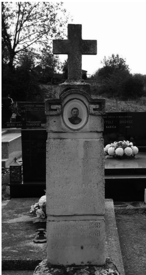
Sl. 8. Kameni nadgrobnji spomenik braći Gazivoda u Subotici Podravskoj.