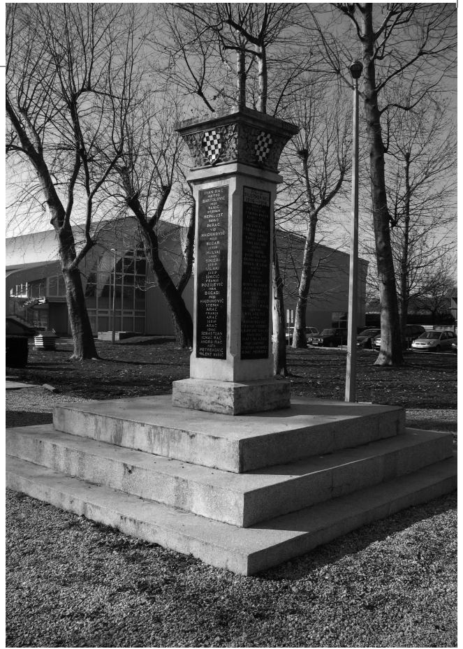
Sl. 4. Spomenik palima u Prvom svjetskom ratu u Goli izgrađen oko 1927. godine.