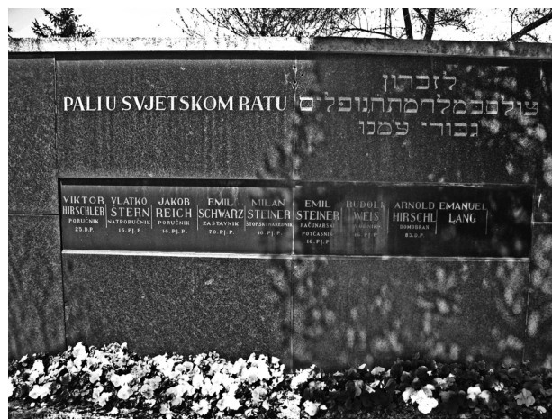
Sl. 3. Spomenik palima na židovskom groblju u Koprivnici.