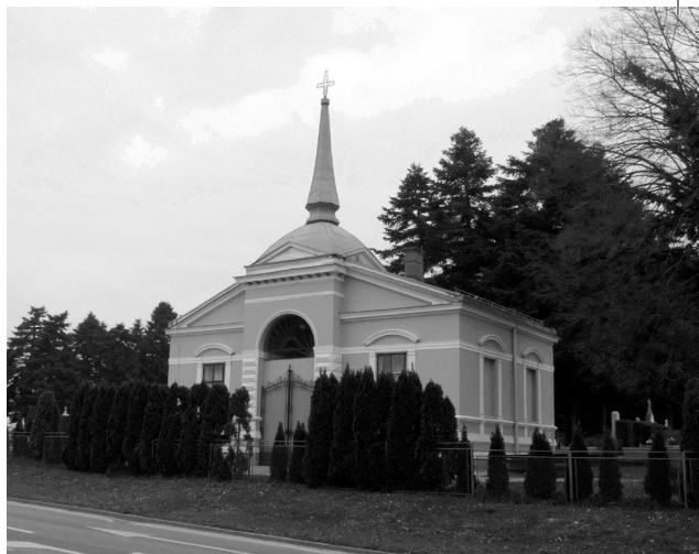
Sl. 1. Kupola koprivničke mrtvačnice na groblju sv. Duha.

Na bojištima Prvog svjetskog rata poginulo je 10 milijuna ljudi, a dvostruko više ih je ranjeno. Isto toliko, ako ne i više, umrlo je na kraju rata i 1919. godine od španjolske gripe. Djed i stric Mire Kolar umrli su od te strašne bolesti istog dana na kraju 1918. godine, a čitavo je gospodarstvo ostalo na leđima bake Marije. 5 Na sočanskom frontu svaki je dan pogibalo oko 6.000 vojnika, 6 a Podravci su prema prikupljenim podatcima najviše stradavali u Galiciji. No, stradavali su gotovo na svim bojišnicama Prvog svjetskog rata što se može vidjeti i iz ovog rada. Vjerojatno pod utjecajem ovih aktivnosti, Zagreb, Varaždin, Koprivnica, a i drugi gradovi podižu spomenike palima od 1914. do 1916. godine, ali su oni uništeni ili prenamijenjeni u kasnijim promjenama koje su zahvatile Hrvatsku. Spomenici su simboli hrabrosti, ali i tuge. Ovim radom pokušavamo izvući iz zaborava one koji su poginuli tijekom Prvog svjetskog rata, dakako, gotovo uvijek pod zastavom dvoglavog orla, tj. Austrije.