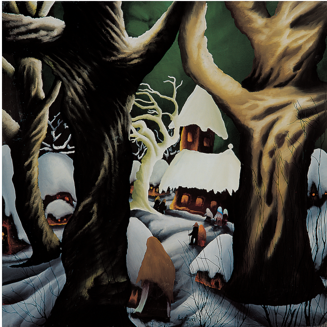
Sl. 5. Franjo Vujčec: Krčma pri Grgi , 1967., ulje/staklo, 375x503 mm (vl. Hrvatski muzej naivne umjetnosti, Zagreb).