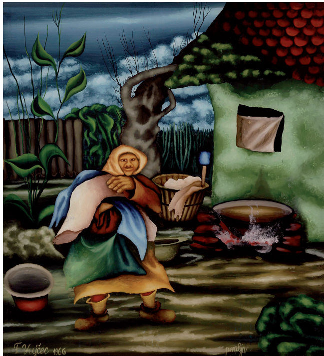
Sl. 3. Franjo Vujčec: Pralja , 1966., ulje/staklo, 450 x 410 mm (vl. Hrvatski muzej naivne umjetnosti, Zagreb).

Upoznali smo se u kasno ljeto 1968. godine, nakon što sam u Goli uspostavio već suradnju s Ivanom Večenajem i njegovim bratom Stjepanom. Od tada pa do najnovijih dana nikada nisam došao u Prekodravlje, a da ne bih posjetio slikarov dom. Jednostavnost, skromnost, iskrenost, poštenje i dobrota krasili su njegovu malu obitelj, gdje je živio s ocem i maj-