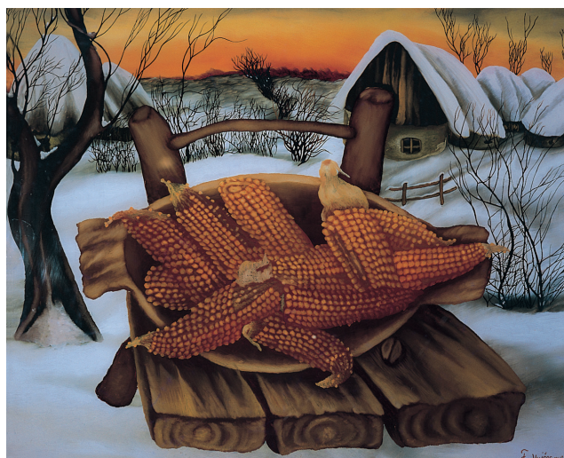
Sl. 5. Franjo Vujčec: Zima / Kukuruz , 1968., ulje/staklo, 520 x 600 mm (vl. Zbirka Scillitani, Foggia, Italija).

Potkraj 1960-ih i u prvoj polovici 1970-ih godina, umjetnikove sam slike izlagao i na više skupnih izložaba (Venecija 1970., Esslingen 1971., München 1972. i 1973., Como 1973., Foggia 1973.) koje sam potpisao kao au-