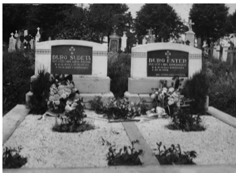
Sl. 2. Nekadašnji izgled nadgrobnih spomenika Đure Sudete i Gjure Estera na koprivničkom groblju (M. obitelj Sudeta).