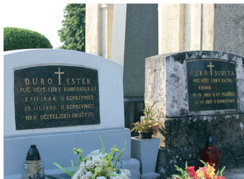
Sl. 3. Danas su nadgrobne ploče na pogrešnim mjestima, a strane su zamijenile prilikom posljednje obnove spomenika.

sjednice 25 stoji da su primjerak knjige dobili svi utemeljujući članovi zbora. Da je to stvarno tako i bilo saznajemo iz Zapisnika III. glavne skupštine Hrvatsko pedagogijsko književnog zbora , održane 24. ožujka 1876. godine, u kojem stoji „... a što se ostalog književnog rada za ovu godinu tiče, izdao je vrlo popularno pisanu knjigu 'Pogled na lučbu' koju su svi članovi dobili“. 26