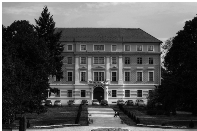
Sl. 1. Pročelje dvorca Batthyány u Ludbregu u kojem je smješten Restauratorski centar (snimio: M. Vađunec, 2015.)

ranesкулpture, osnovan je i Odsjek za tekstil u kojem se provode radovi preventivne zaštitne, konzervacije i restauracije povijesnog tekstila (liturgijskog ruha iz crkvenih i samostanskih zbirki, zastava cehovskih i vatrogasnih udruženja, narodnih nošnji iz svih krajeva Hrvatske, građanskih i vojnih odora te drugih oblika povijesnih artefakata izrađenih od raznovrsnih tkanina, često u kombinaciji i s drugim materijalima: žica, vosak, papir, staklo, perle, titranke, krzno, koža, metal, slika). Uz uspostavljanje restauratorskih radionica i održavanje stručno-znanstvenih skupova o zaštiti i restauriranju tekstila, u Restauratorskom centru u Ludbregu 2009. godine osnovana je specijalizirana zbirka (Tekstiloteka) u kojoj se pohranjuje ugrožena povijesna tekstilna građa. Do 2014. godine u toj je zbirci prikupljeno i čuva se oko 500-tinjak predmeta crkvenog tekstila iz sedam župnih zbirki sjeverozapadne Hrvatske. Tekstiloteka je pokrenuta s namjerom da se vrlo ugrožena tekstilna baština čuva na primjeren način i zaštiti od propadanja. Prikupljanjem predmeta ujedno se stvara i baza uzoraka povijesnih tkanina proizvedenih u Hrvatskoj i u drugim dijelovima Europe, a prikupljena građa izvor je mnogih informacija s područja kulture i znanosti.