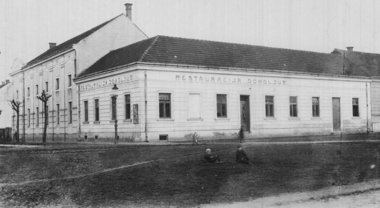
Sl. 1. Pogled na dvoranu »Domoljub« i restauraciju sredinom 20. stoljeća